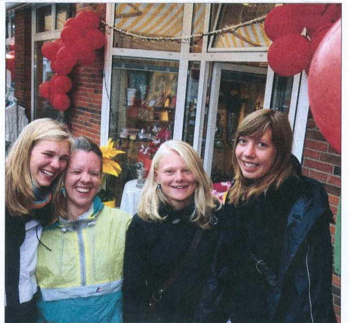
Gut gelaunt unterwegs: Zur Stunde gibt es in der Innenstadt allerlei besondere Angebote.

Nun heißt es Weiterbummeln, Weiterstöbern und Weiterklönen, denn erst mit Einbruch der Dunkelheit entwickelt der Nachtbummel seinen ganz besonderen Inselcharme.