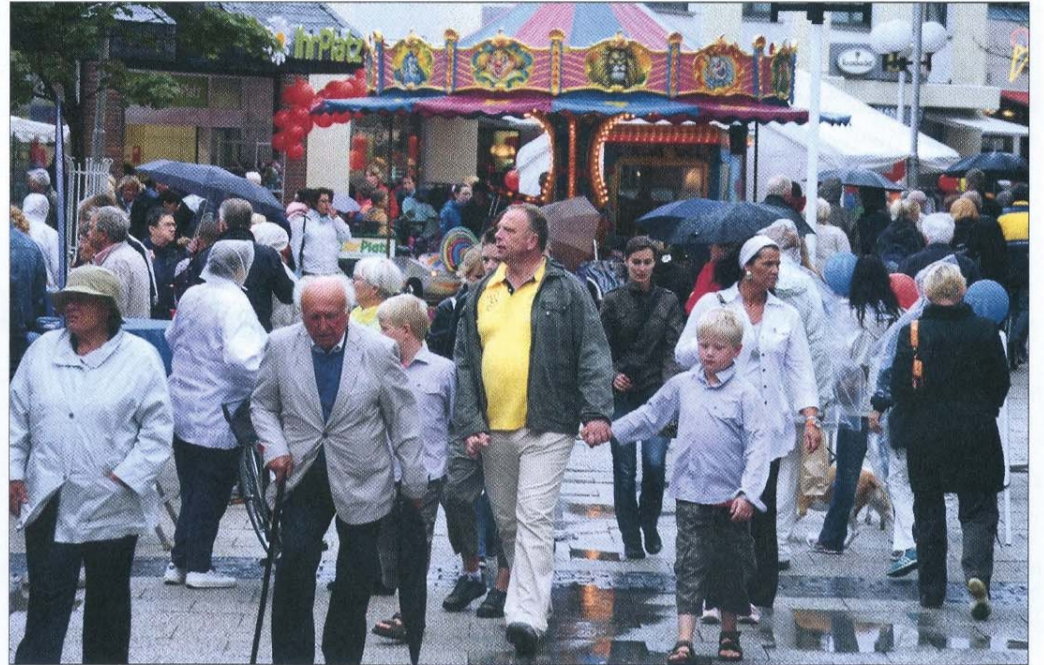
Mit den ersten zarten Sonnenstrahlen am grauen Himmel füllten sich auch die Straßen. So kann auch der 2. Norderneyer Nachtbummel wieder als Publikumsmagnet verbucht werden.