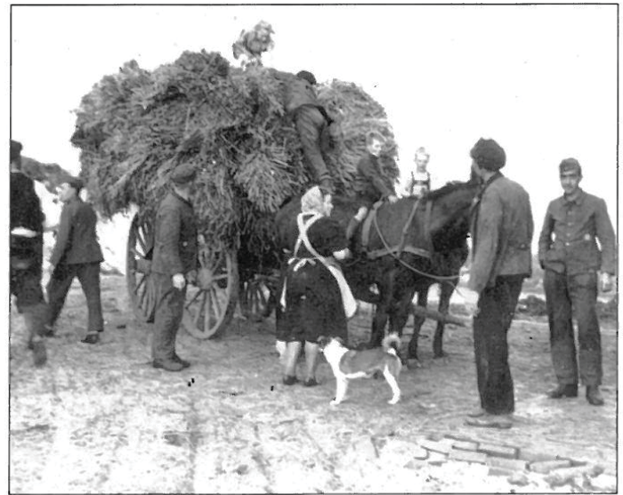
Französische Kriegsgefangene beim Ernteeinsatz auf der Domäne Eiland. 4

Auch heute noch werden vom Volksbund Deutsche Kriegsgräberfürsorge e.V. im Ausland gefallene deutsche Soldaten geborgen und auf einem der vielen Soldatenfriedhöfe einer würdigen Bestattung zugeführt. Auch die Angehörigen der gefallenen Soldaten und zivilen Opfer im Ausland trauern um ihre Angehörigen. Stanislaw Pienkowski und Czeslaw Jaworski blieb eine würdige Bestattung versagt. Ein sichtbares Zeichen an ihren gewaltsamen Tod fehlt. Gleich dem Gedenken an deutsche Soldaten im Ausland, sollte auf unserer Insel die Erinnerung an Stanislaw Pienkowski und Czeslaw Jaworski wach bleiben.