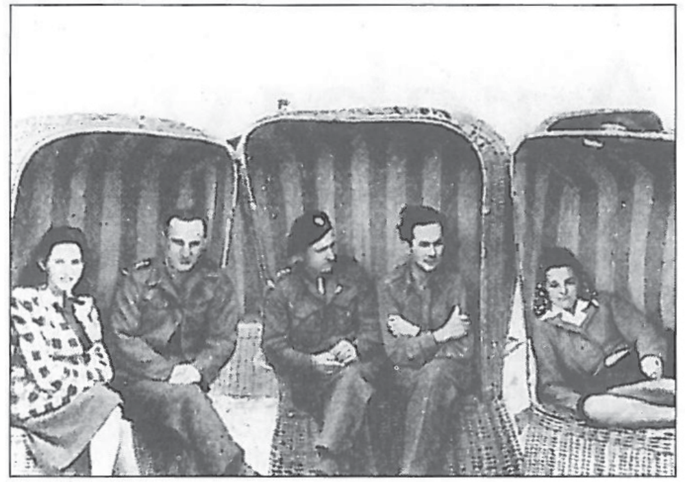
Abb.3: Polnische Soldaten im Strandkorb am Nordstrand der Insel.

Für die Unterbringung wurden zwei sehr gute Hotels beschlagnahmt. Die Bettwäsche wird jedes Mal gewechselt. Es handelt sich vor allem um Doppelzimmer. Einzelzimmer sind nur wenige vorhanden. Alle Zimmer sind groß und hell. Das Hotel für Offiziere „Europäischer Hof“ befindet sich an der Strandpromenade 7 , der „Rheinische Hof“ für die Soldaten in der Stadtmitte des Kurortes. Die Kantine für beide Häuser befindet sich im „Rheinischen Hof“. Die Gemeinschaftsräume sind mit Spielkarten, aktuellen Zeitschriften und Tischtennis