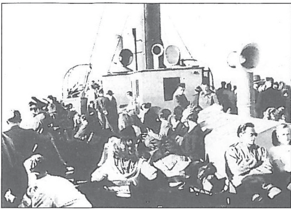
Abb. 7: Auf der Überfahrt von Norderney nach Norddeich.

division aus Maczków (Haren) ab. Im September 1948 verließen die letzten Polen die Stadt. Die überwiegende Mehrheit der polnischen DPs im besetzten/befreiten Deutschland konnte repatriert werden. Für die Menschen, die nicht nach Polen zurück wollten, bot sich eine Ansiedlung in Übersee bzw. die Integration in die deutsche Gesellschaft. Nach Gründung der Bundesrepublik bekamen die verbliebenen DPs die Rechtsstellung von „heimatlosen Ausländern“.