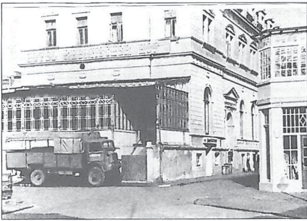
Abb.2: Hotel „Rheinischer Hof“ – Quartier und Kantine für polnische Unteroffiziere und Mannschaften.

erfolgte die Rückreise zu den Familien, bei Krankheit und fort bestehender Unterernährung ein verlängerter Aufenthalt von weiteren zwei Wochen.