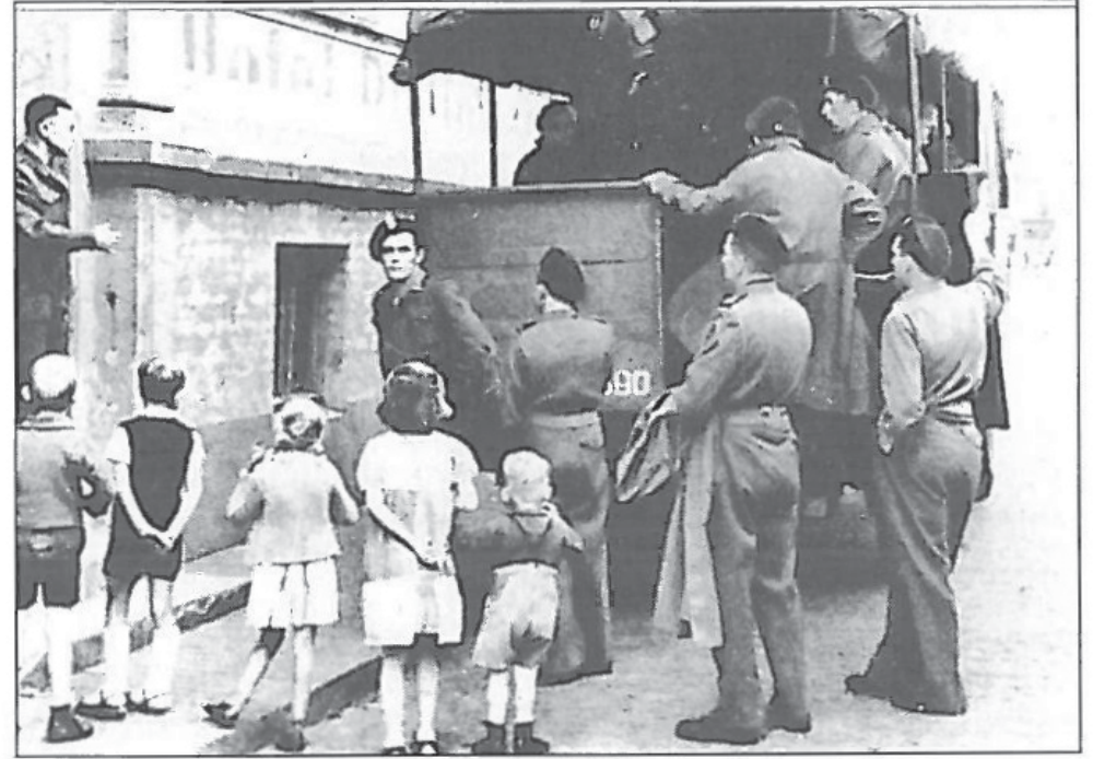
Abb.4: Abreise polnischer Soldaten aus dem „Rheinischen Hof“, von Norderneyer Kindern aufmerksam beobachtet.

ausgestattet. Die Gäste werden mit Armeefahrzeugen abgeholt und ins Hotel gebracht, wo das Frühstück und ein fertig gemachtes Zimmer warten. Mit denselben Fahrzeugen werden die Gäste bei der Abreise zum Hafen gebracht. Die Überfahrt dauert eine Dreiviertelstunde, der Transfer mit dem Auto zwei Minuten. Militärfahrzeuge dürfen nicht auf das Schiff fahren.