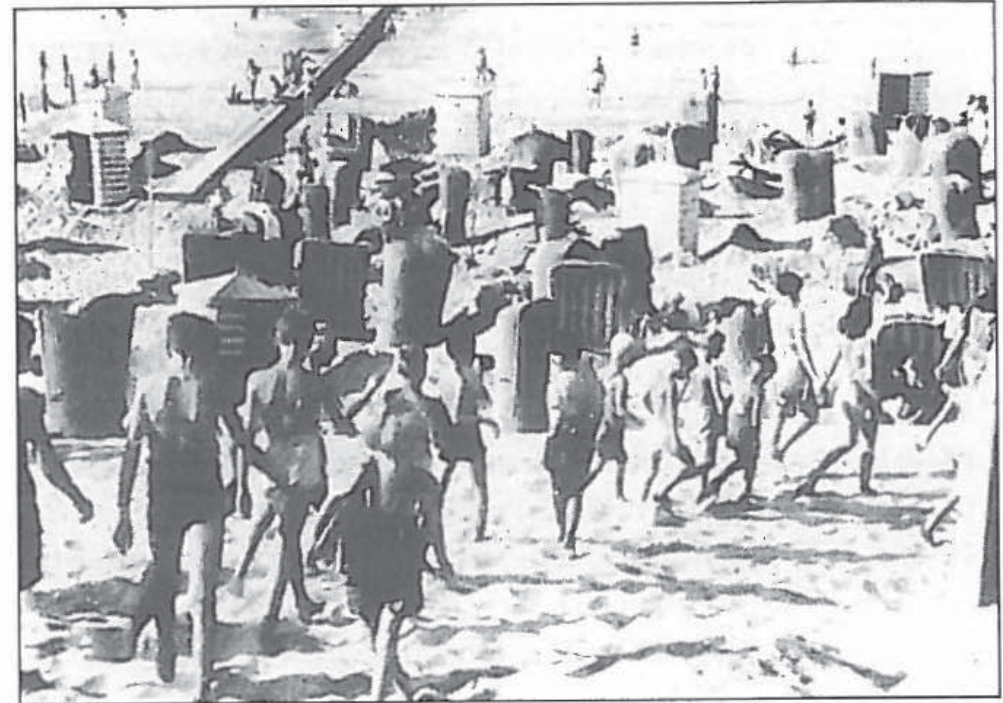
Abb. 6: Polnische Kinder auf dem Weg zum Strand.

ausreichendes und ausgewähltes Personal zur Verfügung steht. Auf der Tagesordnung steht nicht nur ein Bad im Meer, sondern auch ein Besuch im Wellenbad, wo die Kinder Schwimmunterricht erhalten. Im Laufe des Tages findet Turnen statt, sie lernen Englisch, singen und führen ein Tagebuch, worin sie ihre Eindrücke von der Reise und von ihrem Aufenthalt auf der Insel festhalten. Ein gutes Radio befindet sich in dem geräumigen Gemeinschaftsraum, in dem Spiele und andere Unterhaltungsmöglichkeiten angeboten werden. Die Kinder halten sich in der Regel für zwei Wochen in der Ferienkolonie auf. Gleich nach der Ankunft werden sie von einem Arzt gründlich untersucht. Für die Kinder, bei denen sich Mangelerscheinungen zeigen, ordnet der Arzt eine Verlängerung des Aufenthaltes für weitere zwei Wochen an. Am 8. August (Anm.: des Jahres 1947) wurde die Ferienkolonie feierlich eröffnet. Anwesend waren: Oberstarzt Szydowski, sowie Vertreter der RSFP und der englischen Lokalbehörden. Die Gäste wurden von den Kindern mit Gesang und Gedichten (das eine auf Polnisch, das andere auf Englisch) begrüßt. Die RSFP hofft darauf, dass die Kolonie bis Ende September bestehen bleiben kann, um so Kinder von Soldaten aller Militärlager zu betreuen.“