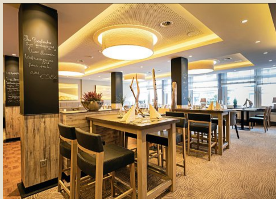
Das Restaurant besteht aus klaren Formen, Naturtönen und einem zeitgemäßen Mobiliar.