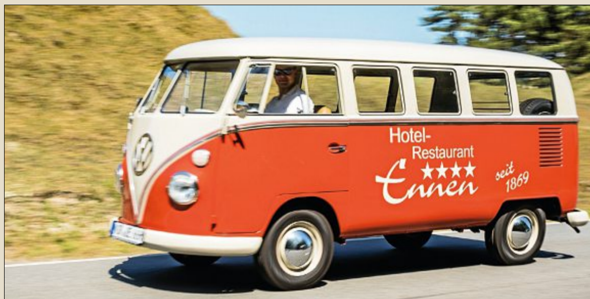
Der VW Bulli, Baujahr 1963, dient nicht nur als Blickfang vor dem Hotel. Hin und wieder kommt der Oldtimer des Hotels auch bei Caterings zum Einsatz.

Wer nicht weiß, was man zu einem so großen Geburtstag schenken sollte, dem macht es Uwe Ennen leicht. Denn statt Geschenke wünscht er sich lieber Geldspenden. Diese werden gesammelt und an Norderneyer Institutionen weiterverschenkt. An wen genau, das wird der Norderneyer Hotelier in fünfter Generation erst auf der Feier verraten.