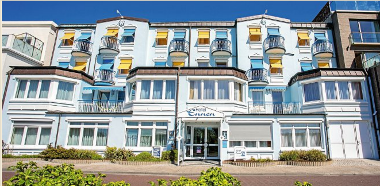
Ein fester Bestandteil des Straßenbildes im Norderneyer Damenpfad: Hotel Ennen.