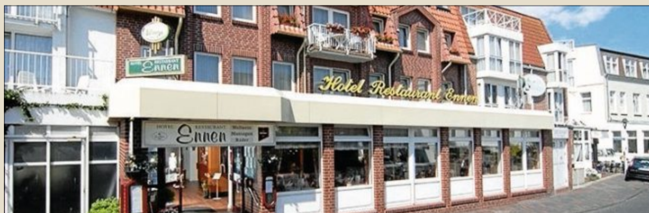
Das Hotel Restaurant Ennen in der Luisenstraße.