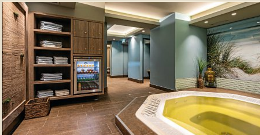
Entspannen und sich wohlfühlen im frisch renovierten Wellnessbereich.

Die Doppel- und Einzelzimmer sind hell und freundlich eingerichtet und von unterschiedlicher Größe. In der ersten Etage zur See- seite befinden sich die Suiten und Doppelzimmer mit Liegebalkon, die Zimmer zur Landseite haben teilweise einen Balkon.