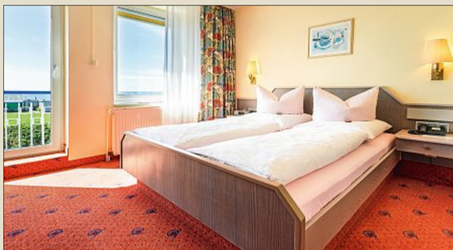
Helle und freundliche Zimmer laden auch zu einem längeren Aufenthalt ein.