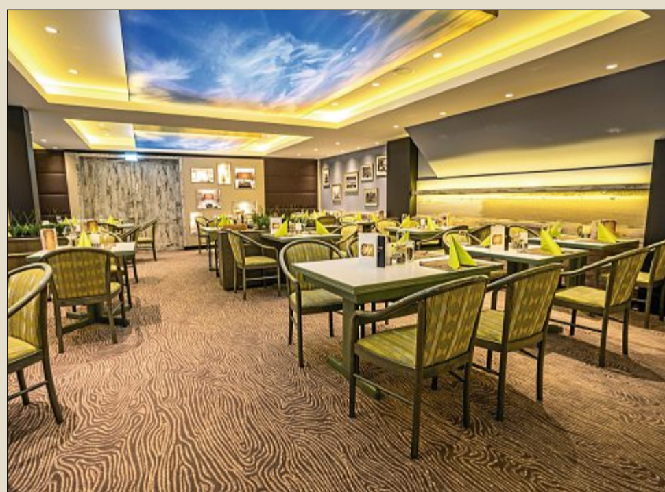
Auch ein stimmungsvolles Lichtkonzept trägt nun zum Wohlfühlfaktor im Restaurant bei.