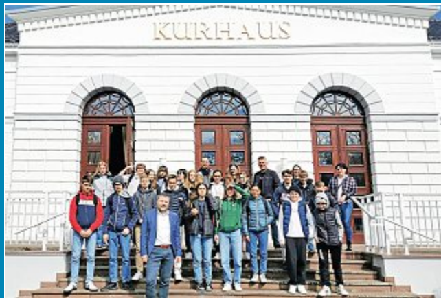
21 Austauschschüler waren zu Gast bei Norderneys Bürgermeister Frank Ulrichs.