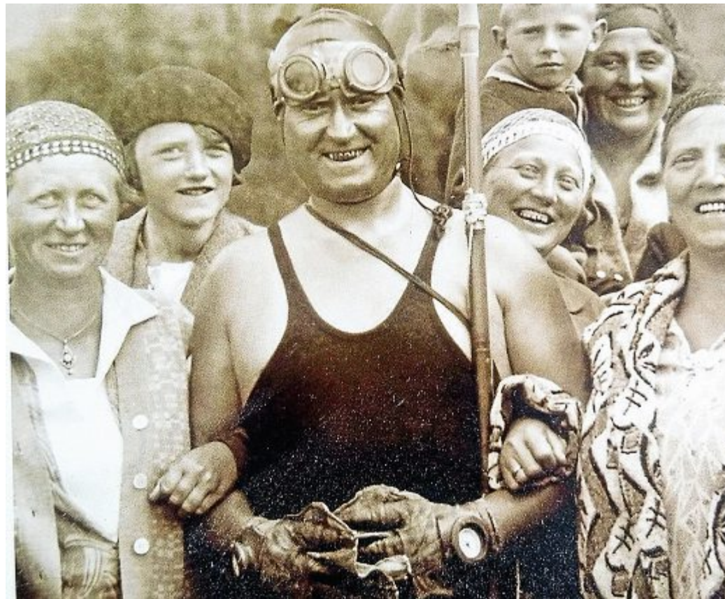
Otto Kemmerich mit Schwimmhandschuhen und der darin eingearbeiteten wasserdichten Uhr.

Nur mit einer roten Flagge machte er sich im Wasser bemerkbar. Auf der Strecke Norddeich-Norderney sollte es statt der roten Flagge zehn groe rote Kinderluftballons – in 20 Meter H he schwebend – sein, die seinen Standort markierten. Der Start erfolgte am 11. Juni 1925, nachmittags um 15 Uhr. „Mutterseelenallein zog er seine Bahn, um ihn herum der brausende Gesang des urrewigen Meeres, gegr t von eilig vor berziehenden M wen im lichten Federkleid, betreut von