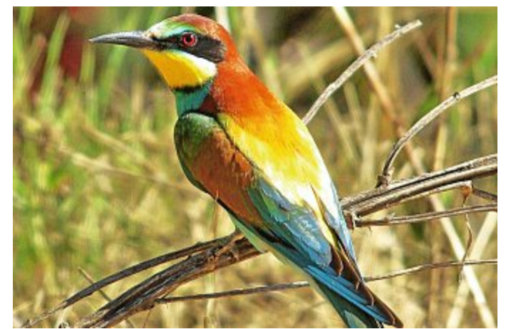
Am Brutplatz in der Algarve: Hier ist das bunte Gefieder gut zu sehen.

Deutschland. Bevorzugt werden wärmere Bereiche, wo die Brutröhren von den Paaren in möglichst senkrechte Sandsteilufer gegraben werden. Trotz seines Namens werden nicht nur Bienen gefressen, sondern auch Wespen, Hummeln, Heuschrecken und andere größere Insekten. Sie werden vor dem Fressen zunächst mehrmals mit dem Schnabel gegen einen Ast geschlagen, um der Gefahr von Stichen zu entgehen.“