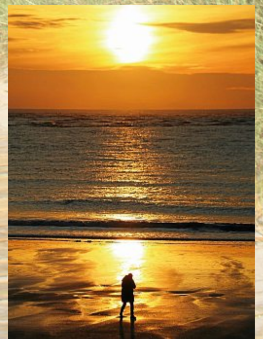
Schnell noch ein Foto, sonst ist die Sonne weg.