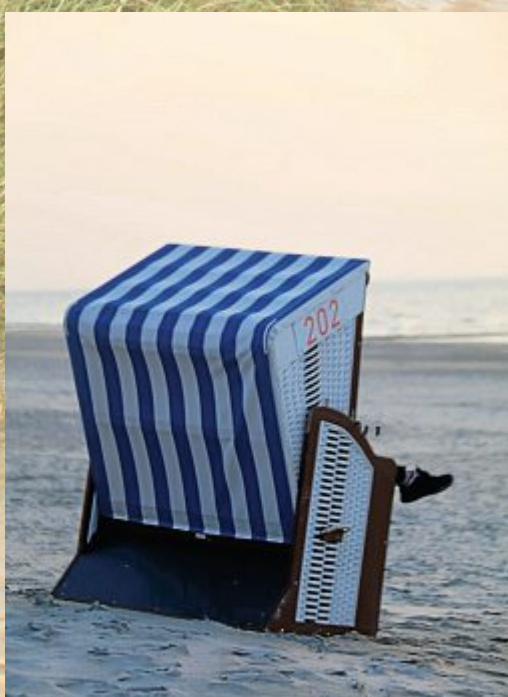
Da baumelt nicht nur die Seele.