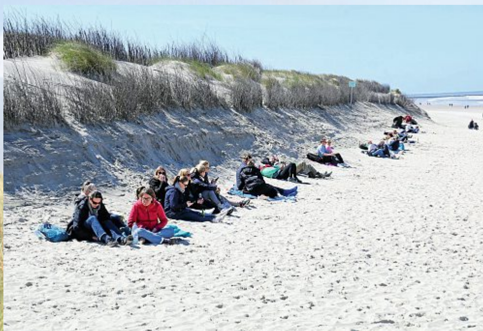
Noch braucht man die Jacken. Selbst im Windschatten der Dünen ist es noch kühl.