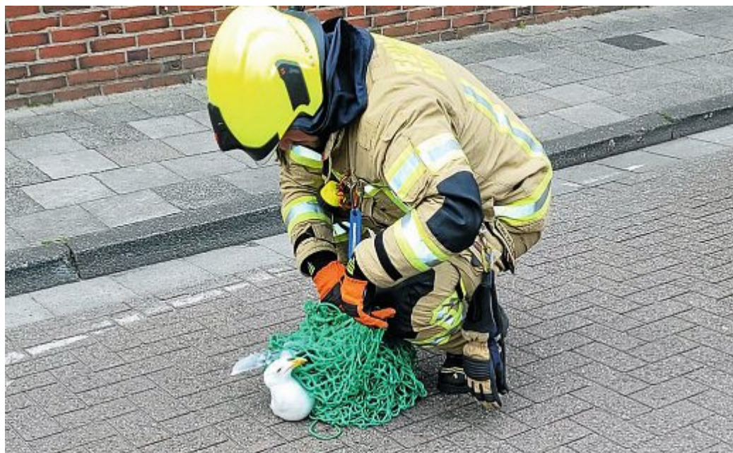
Nach aufwendiger Rettung endlich wieder in Freiheit.

So lie der Stadtbrandmeister die neue Drehleiter zur Einsatzstelle kommen. Schnell stellte man allerdings fest, dass die Leiter mit ihrem Gelenk-