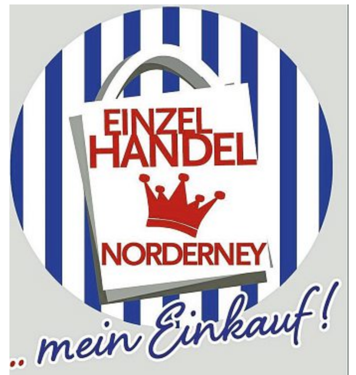
Das Logo des EHV Norderney.