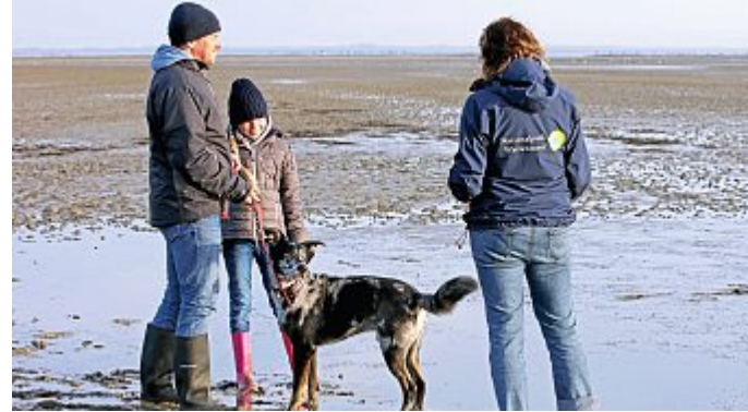
Wattspaziergang mit Hund. Am Montag um 18 Uhr.

11.30 Uhr „Young Old Man“, Musikveranstaltung, Kurplatz. Eine musikalische Zeitreise durch die letzten 50 Jahre. Gutes musikalisches Handwerk, Spielfreude und ostfriesisch freches Entertainment. Auch um 16 Uhr.