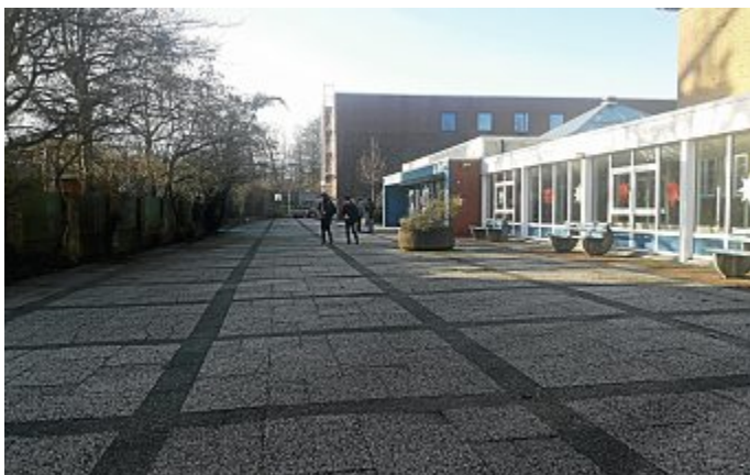
Seit 100 Tagen Claus Huths Arbeitsplatz: die KGS Norderney.

Nein, leider noch nicht. Ich bin mittlerweile in der dritten Ferienwohnung angelangt. Aber ich bin sehr optimistisch, dass sich das bis zum Schuljahresbeginn nach dem Sommer ändert und ich dann eine feste Bleibe beziehen kann. Denn erst dann bin ich wirklich richtig auf Norderney angekommen.