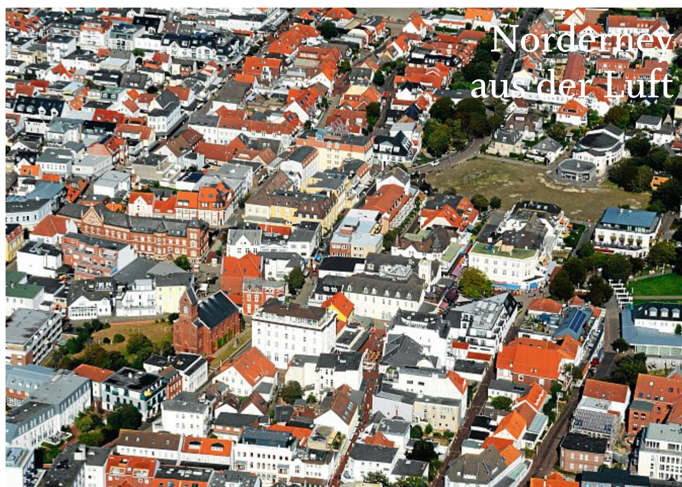
Das Foto stammt aus August 2022, die Bestellnummer lautet 2320.

Ihr seht also, was für weitreichende Auswirkungen der Klimawandel hat. Sogar hier bei uns. Und das ist nur ein Beispiel von vielen. Der Klimawandel ist also eine echte Bedrohung für uns und unsere Umwelt. Der Klimawandel ist menschengemacht. Das heißt wir Menschen sind dafür verantwortlich, dass die Erde wärmer wird. Das bedeutet auch, dass wir auch dafür verantwortlich sind, dass die Erde nicht noch wärmer wird. Setzt euch gern einmal mit euren Eltern zusammen und überlegt, was ihr tun könnt, damit nicht noch mehr Abgase in die Atmosphäre kommen. Aber nicht nur ihr müsst überlegen, wie ihr unsere Umwelt schützen könnt. Auch die Politik und die Unternehmen müs-