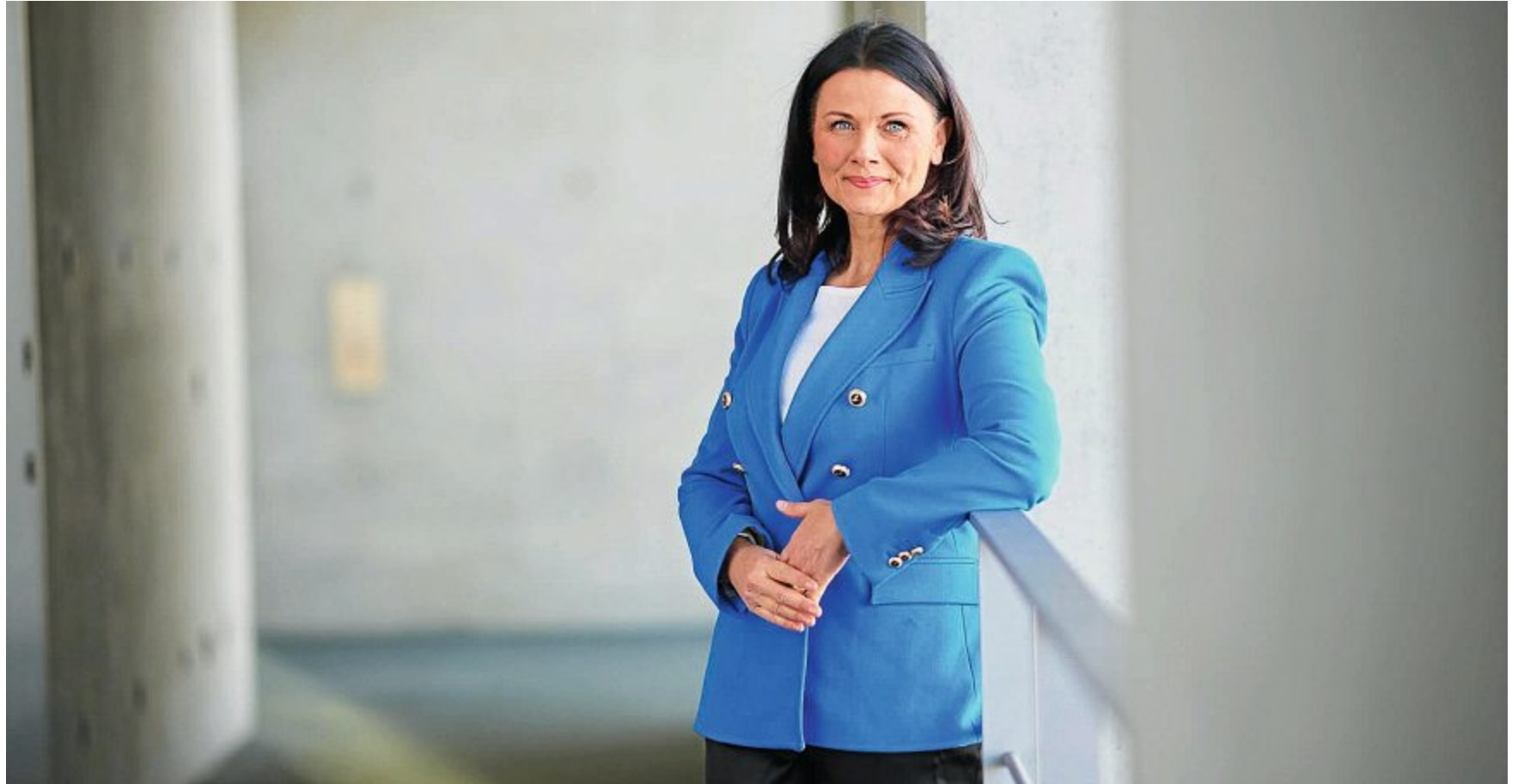
Gitta Connemann aus Leer gehört seit 2002 dem Deutschen Bundestag an.

Auf Norderney wird alljährlich eine Menge Geld in die Hand genommen, um die Schäden der Winter- und Herbststürme zu kaschieren. Die Sandabgänge zeigen gerade im Bereich des beliebten Strandes an der Weißen Düne immer mehr offensichtliche Einschnitte in Natur und