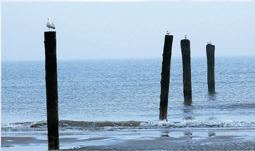
Pro Pfahl eine Möwe. Offensichtlich sind die Sitzplätze sehr begehrt.