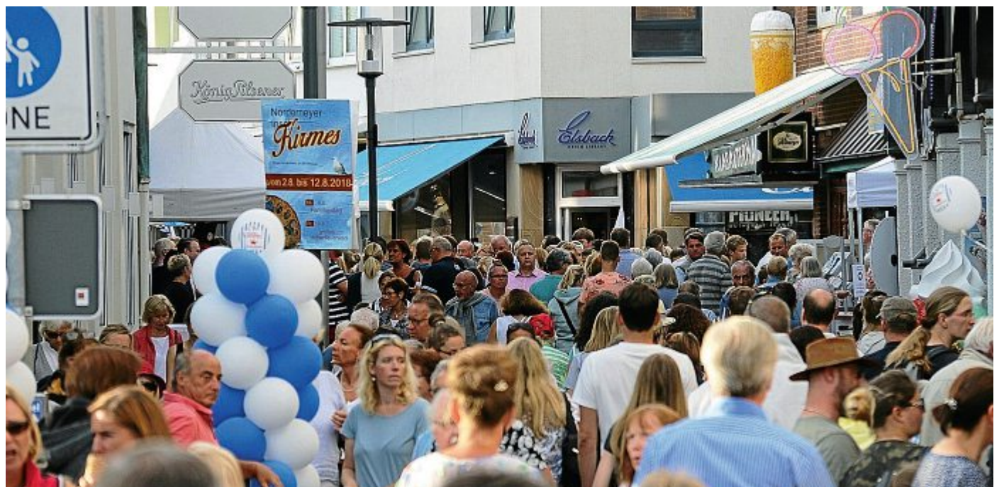
Bis spätabends waren die Nachtbummler beim letzten Event unterwegs – hier die Poststraße.

Entsprechende Plakate werden frühzeitig auf dieses Event hinweisen. bos