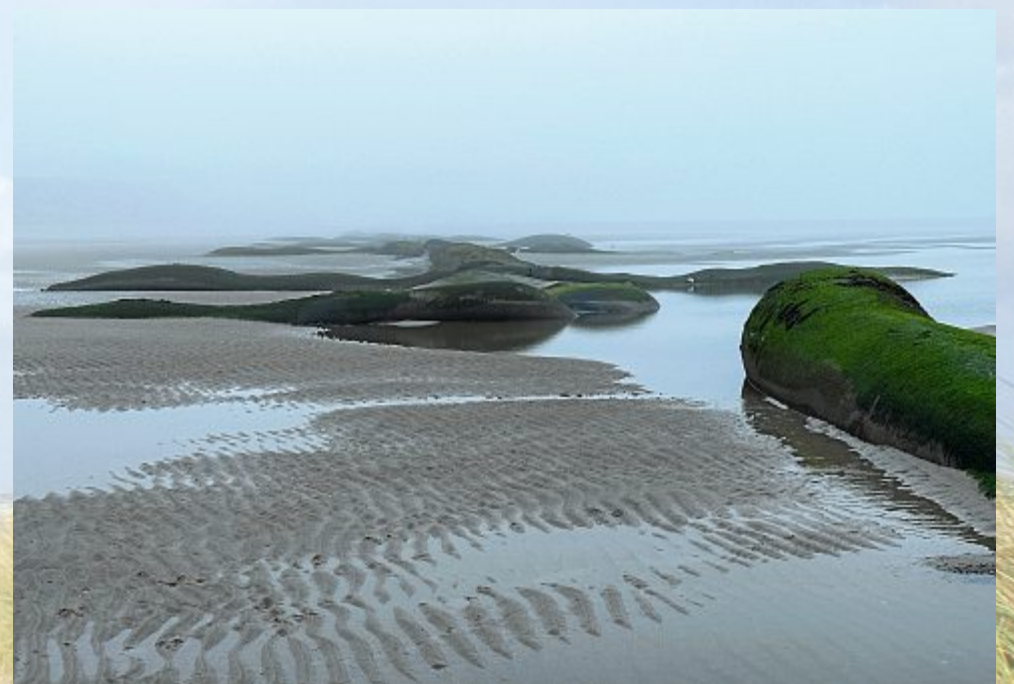
Wie eine Szene aus dem Film „Dune“: die Sandwürmer zeigen sich an der Oberfläche.