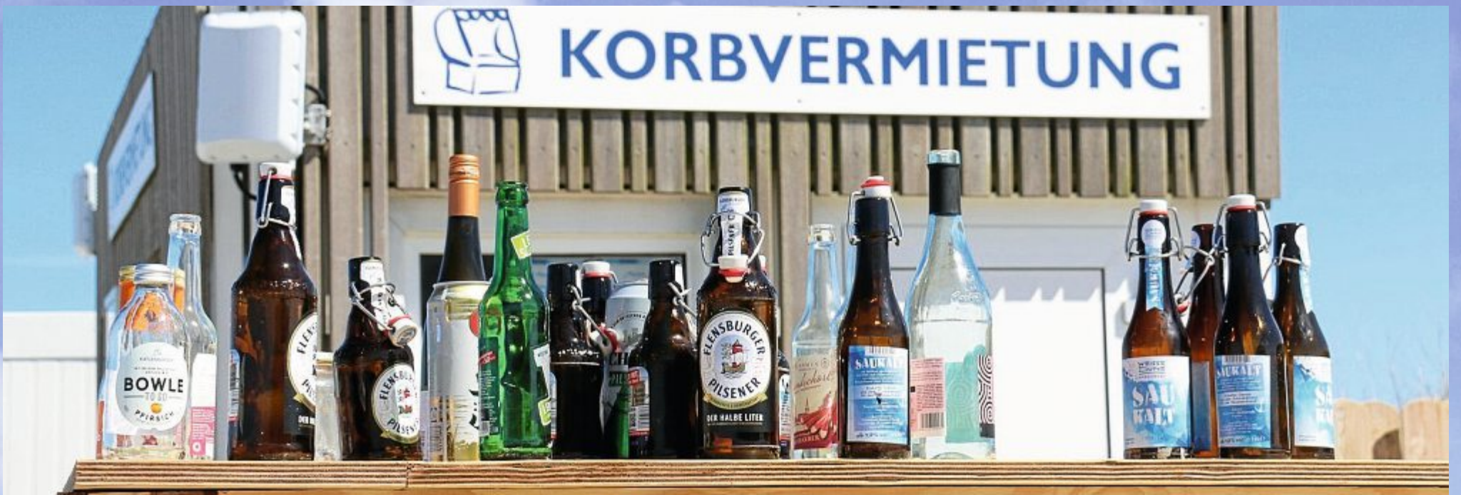
Mit der Sonne kommt der Durst. Die Überreste stehen dann, wie hier an der Weißen Düne, für Pfandjäger bereit.