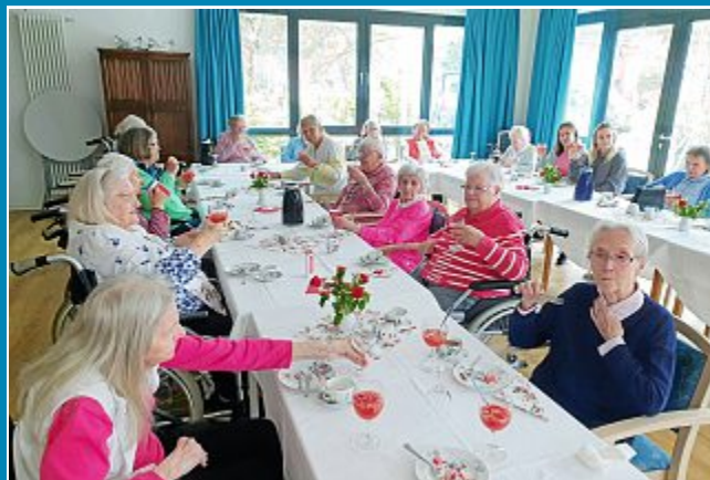
Die Damen vom „To Huus“ erhielten zum Muttertag Rosen.