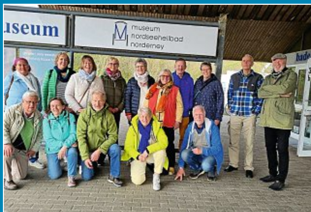
Nach 54 Jahren trafen sich ehemalige Norderneyer Schüler zum Klassentreffen.