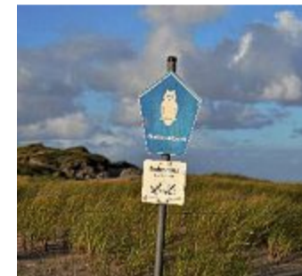
Hinweisschild auf die Nationalparkzone Ruhezone.

Der größte Nationalpark Deutschlands ist der Mü-ritz-Nationalpark in Meck-lenburg-Vorpommern, wo