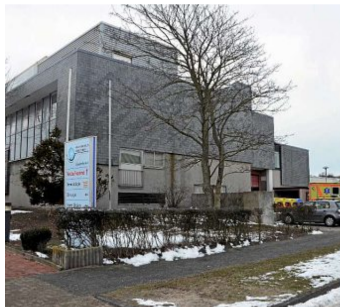
Mit jährlich etwa 100000 Euro unterstützt der Förderverein das Norderneyer Krankenhaus. Archivbild

Am 23. und am 30. Dezember findet traditionell wieder das beliebte „Winterfest von Norderneyern für einen guten Zweck“ vor Kurt's Fahrradshop in der Nordhelmstraße statt. Bei Glühwein und Bratwurst kann man jeweils ab 17 Uhr einen gemütlichen Abend verbringen. Der Erlös kommt dem Förderverein zugute.