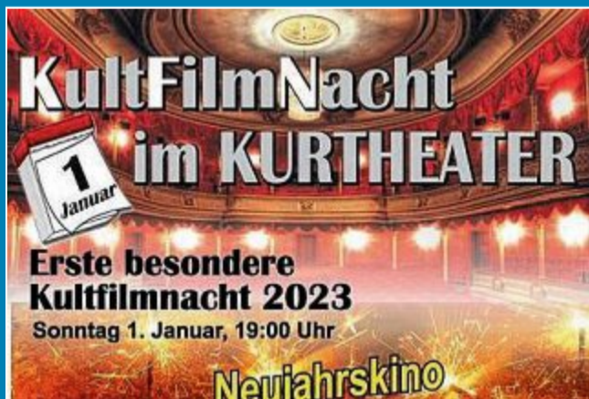
Auf der Kultfilmnacht wird „Münchhausen“ gezeigt.