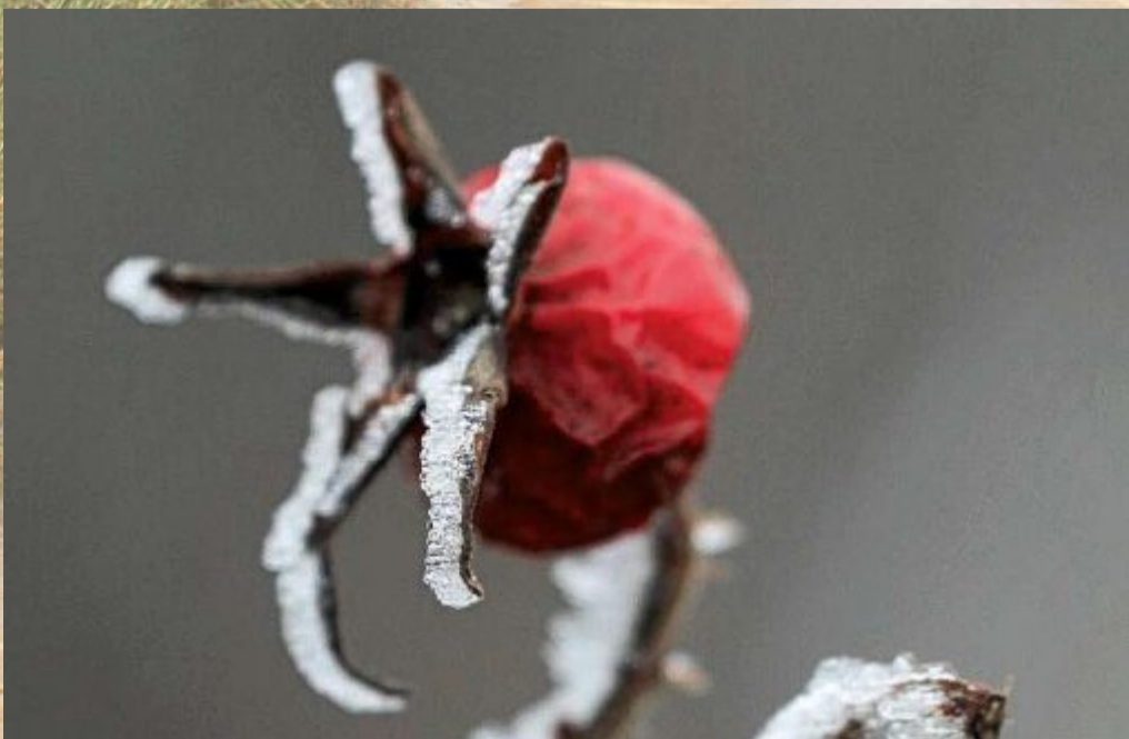
Starr bleiben auch die Früchte.