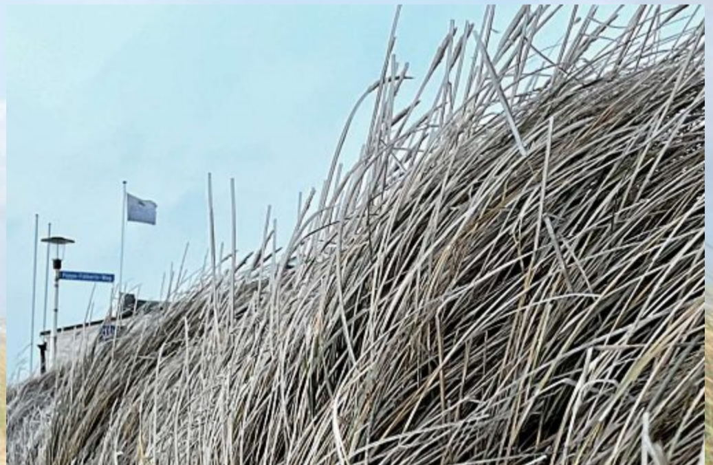
Und die Gräser bewegen sich auch bei Wind nicht mehr.