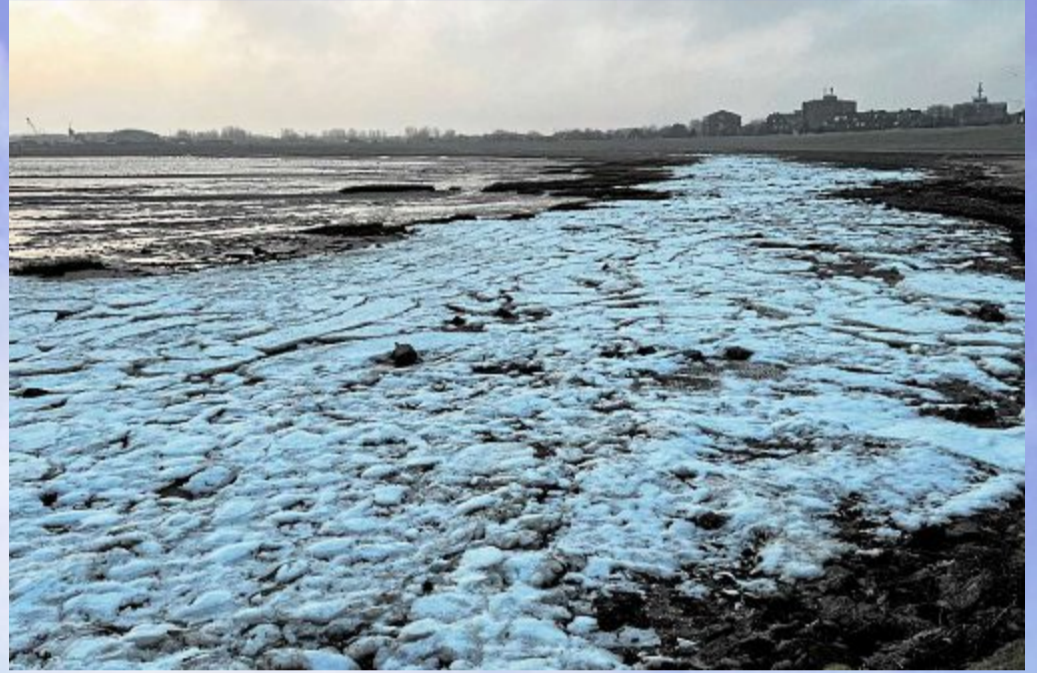
Das Eis in der Surferbucht hielt sich nicht lang.