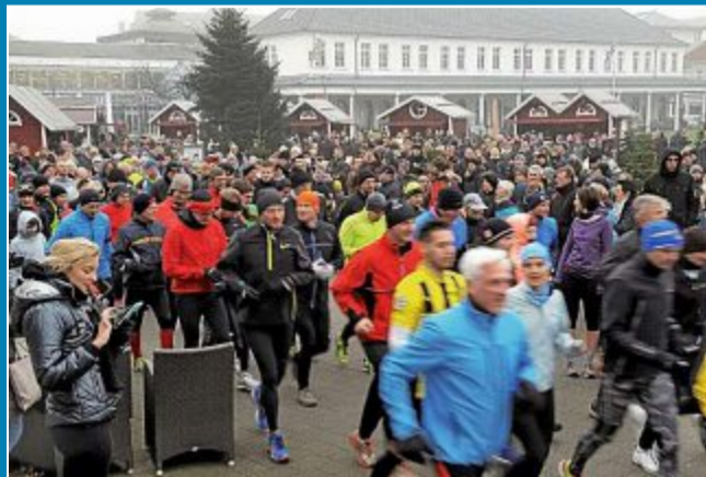
Auch in diesem Jahr findet wieder der traditionelle Silvesterlauf statt.