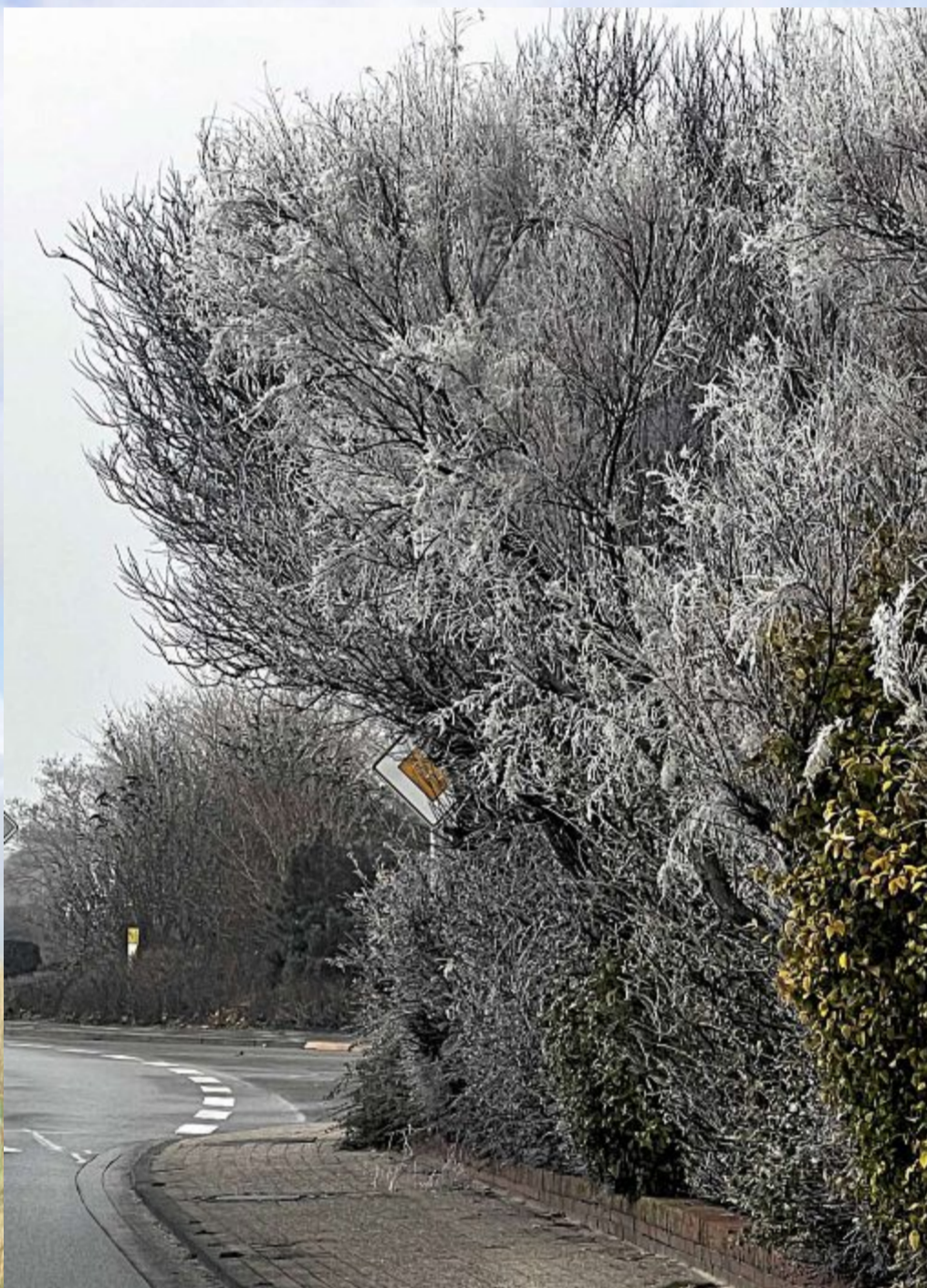
Ganz früh am Morgen ergrauen auch die Bäume.