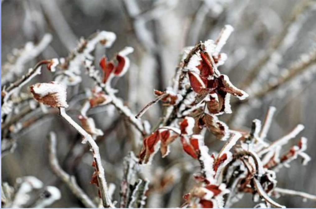
Für einige Pflanzen ist der Eispanser überlebensnotwendig.