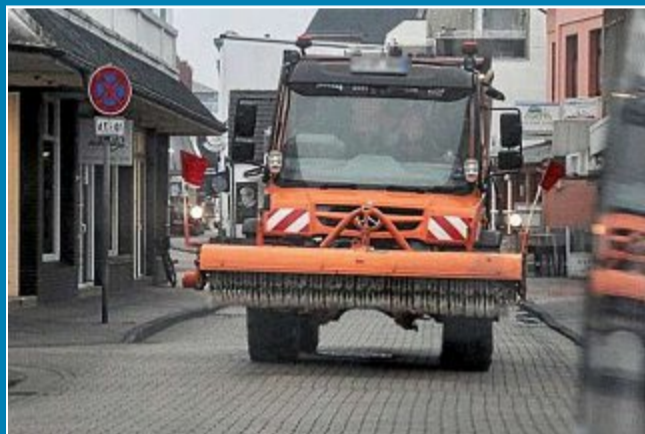
Eisige Tage, aber der Schnee bleibt nicht liegen.