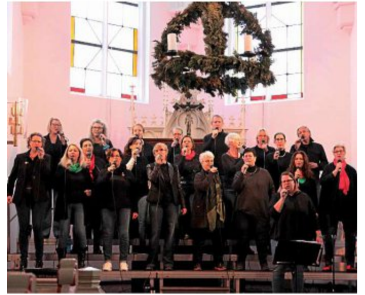
Mitglieder des Gospelchors und der Starfish-Singers boten eine akkurate Alternative zum Krippenspiel.

die deutsche Version von Rudolf mit der roten Nase, „Rudolph the red nosed Reindeer“, ein und auch für das Lied „Stern über Beth-lehem“ gab es einen Text zum Mitsingen für das Pub-likum. Zum Lied „Wir sagen Euch an den lieben Advent“ wurden passend vier Ker-zen entzündet und mit der Zugabe lud der Gospelchor Starfish-Singers ein, zu ei-nem musikalischen Spa-ziergang durch das „Winter Wonderland“. Einen wun-derbaren Applaus mit Bra-vo-Rufen spendete das Pub-likum und alle freuten sich über das gelungene Ersatz-konzert.