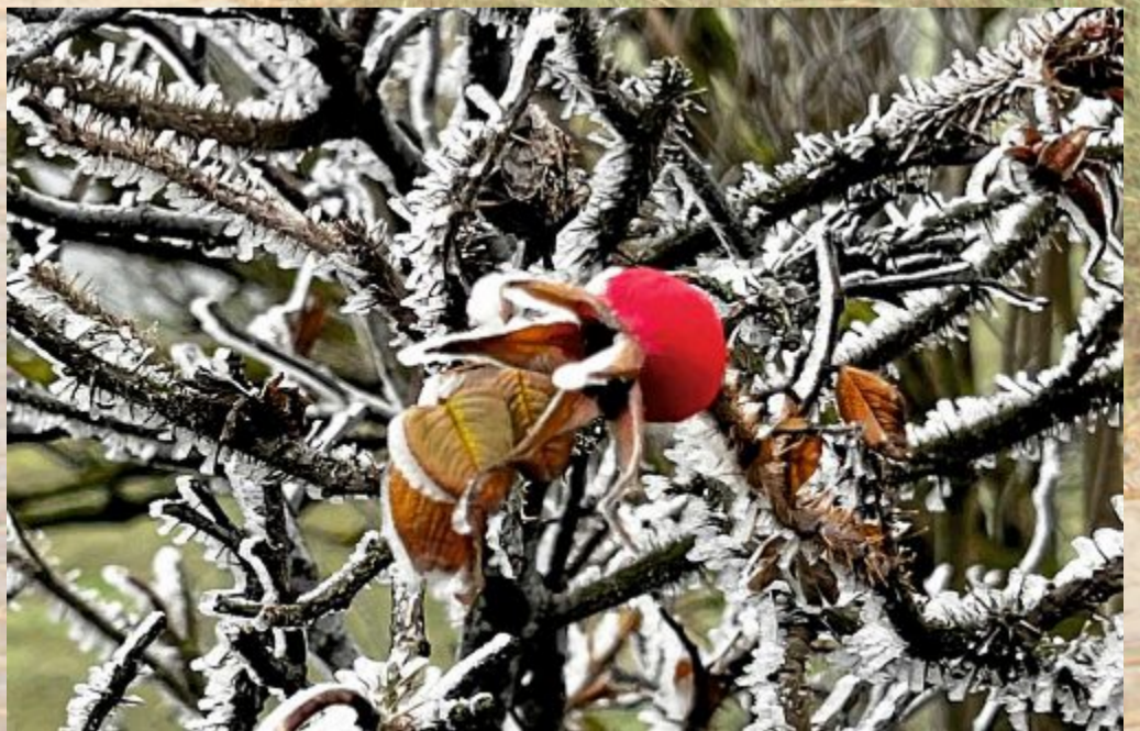
Aber nur für ein paar Stunden – dann taut es wieder.