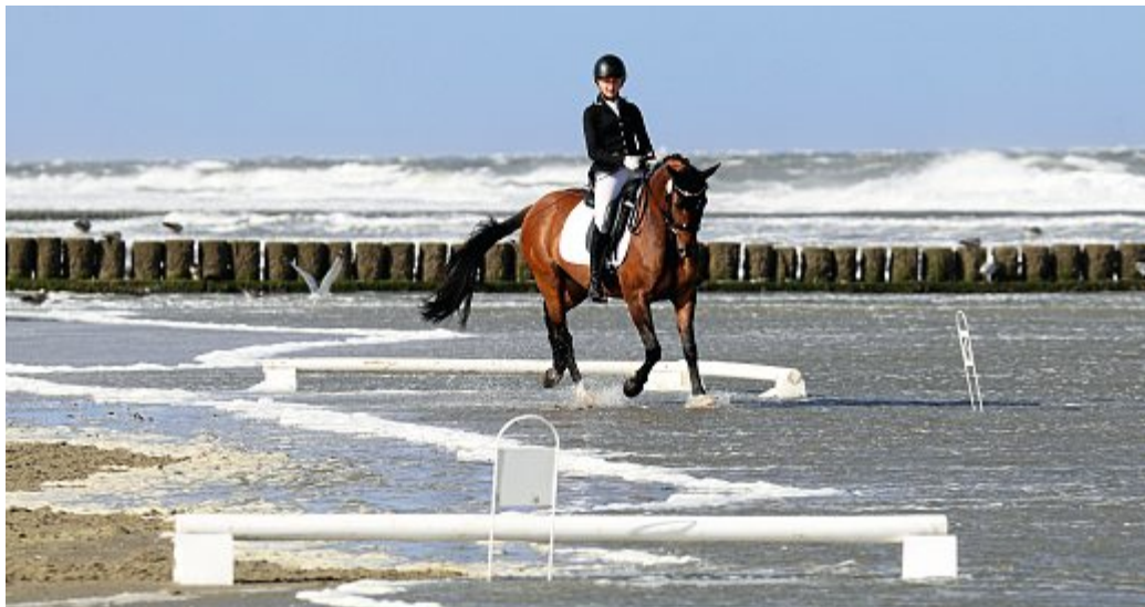
Die Dressurprüfungen wurden am Wassersaum geritten.

Das 35. Norderneyer Beachside Classics Reitturnier hat am Wochenende mehrere tausend Zuschauer auf den Turnierplatz gelockt. Das Wetter hatte von Sonnenschein bis Orkan alles zu bieten, was einen erfolgreichen Ablauf der Veranstaltung nicht beeinträchtigte. Mehrere hundert Pferde samt Reiter waren für insgesamt 28 Dressur- und 26 Springprüfungen angereist. Besondere Highlights waren die Flutlichtkür am Samstagabend und die Dressur- und Springprüfungen am Strand.