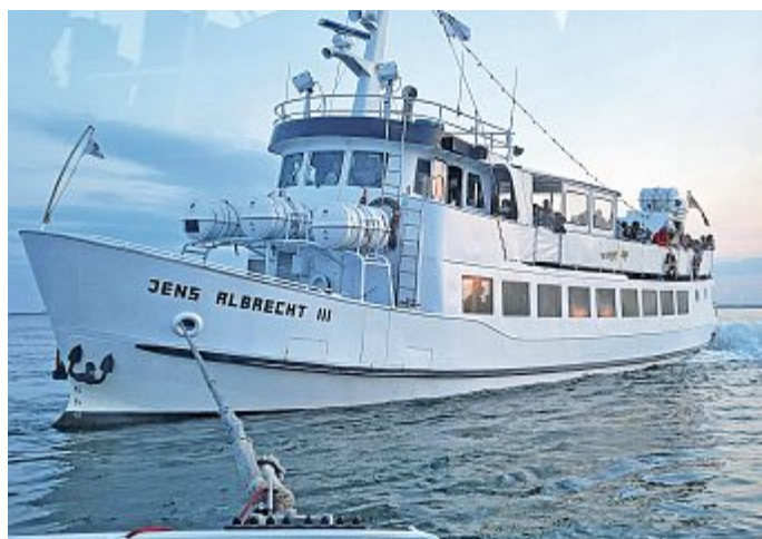
Das Fahrgastschiff im Wattenmeer.

Gegen 15 Uhr meldete sich der Kapitän des Ausflugschiffes „Jens Albrecht III“ bei der von der DGzRS betriebenen deutschen Rettungsleitstelle See, dem Maritime Rescue Coordination Centre (MRCC) Bremen: Das rund 26 Meter lange Schiff war bei ablaufendem Wasser am Rand des Harlefahrwassers etwa eine Seemeile südsüdwestlich von Wangerooge festgekommen. Aus eigener Kraft konnte die Besatzung es