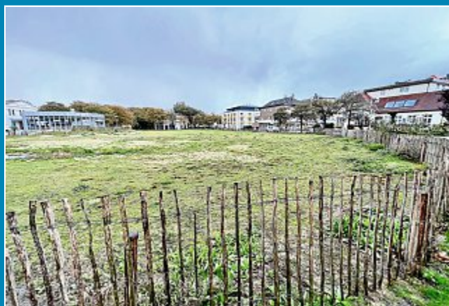
Theaterplatzprojekt gestoppt. Risiken sind für Stadt und Stadtwerke zum jetzigen Zeitpunkt unkalkulierbar.