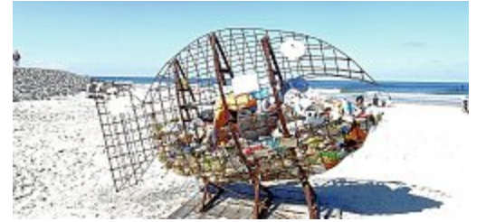
Der Plastikmüllfisch wird reichhaltig versorgt.