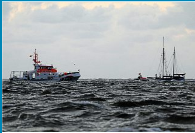
Vierköpfige Familie gerettet. Rettungskreuzer Hans Hackmack und Tochterschiff Emmi nähern sich dem Havaristen.