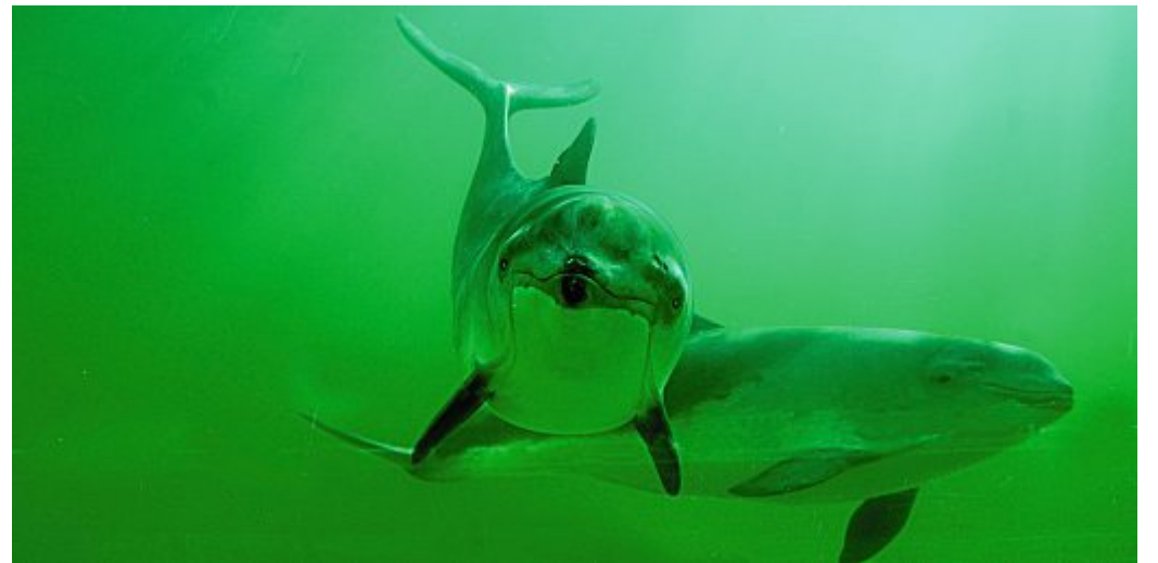
Zwei gewöhnliche Schweinswale. Gut zu erkennen ist die dunkle Finne.

Er kann eine Länge von bis zu 1,80 m erreichen und wird zwischen 45 und 75 Kilogramm schwer. Weibchen sind bei den Schweinswalen größer und können sogar bis zu zwei Meter lang werden. Die meisten Schweinswale werden etwa 10 bis 12 Jahren alt. Ihre Kälber bringen sie zwischen Juni und August zur Welt. Wichtige