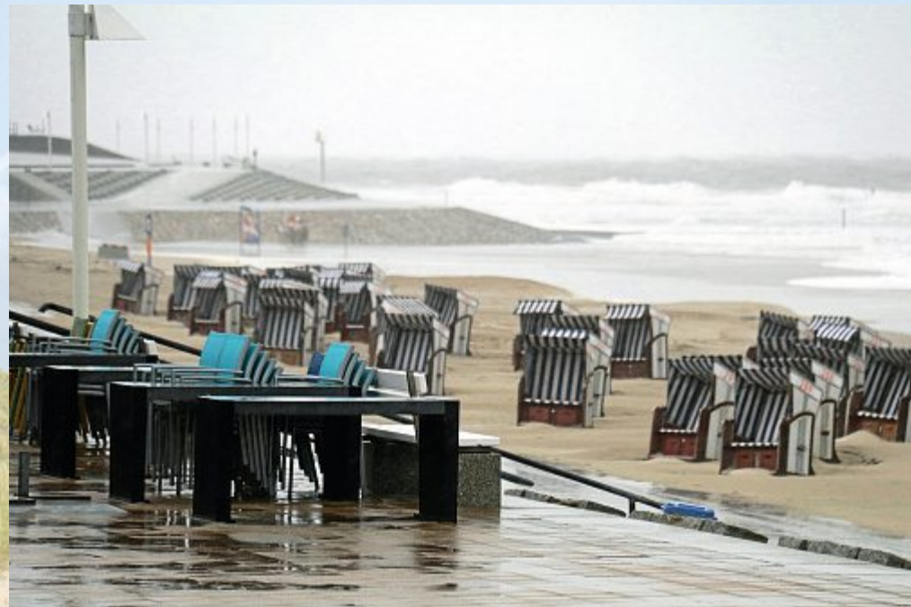
Grau in Grau – auch das gehört dazu.