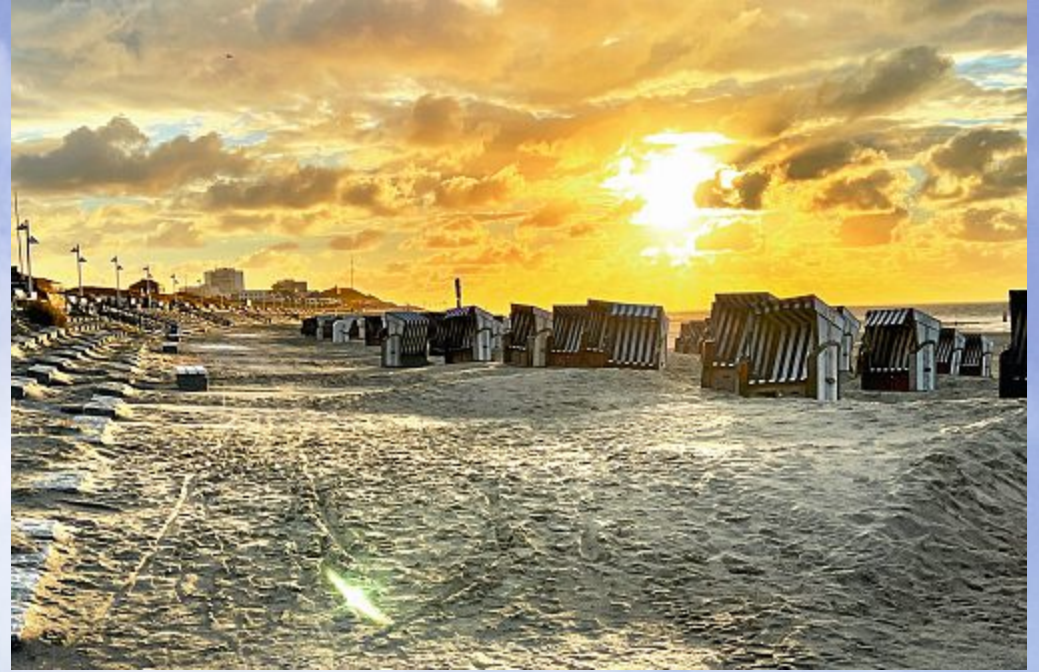
Goldener Himmel – wann hat man den schon?