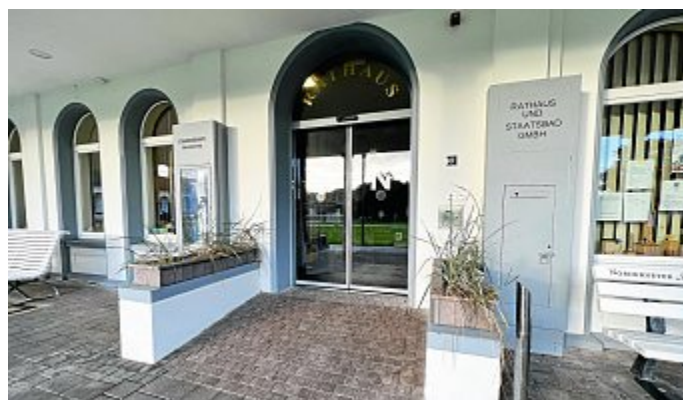
Das Rathaus wird immer digitaler.

OpenR@thaus bietet digitale Serviceleistungen an