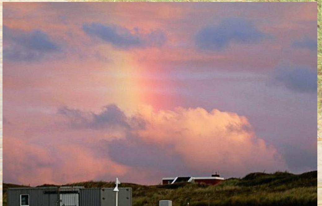
Und ein tieferer Sonnenuntergang läßt einen nochmal staunen am Ende des Tages.