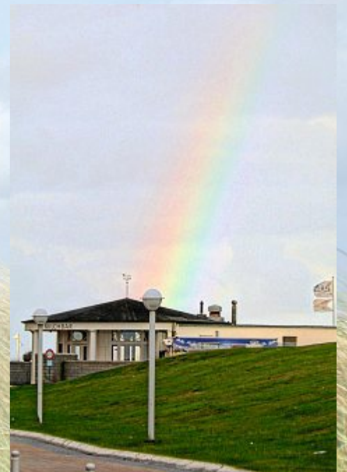
Ein Farbtupfer im Grau.