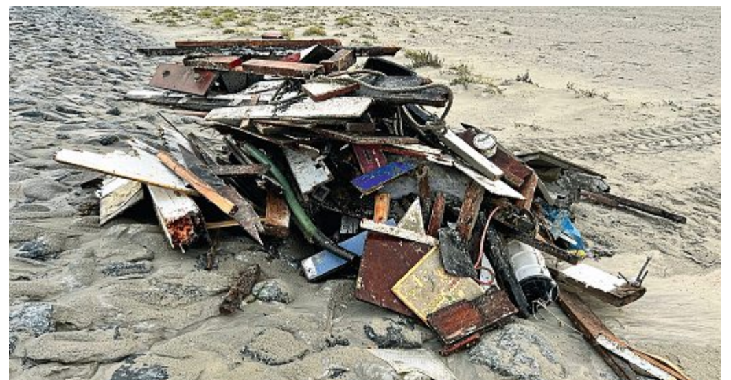
Trümmer wurden auf Norderney angeschwemmt.

letztendlich nicht mehr frei. Eine Rettungsaktion mit Schleppleine brachte keinen Erfolg, weil eine Klampe beim Antauen aus der Verankerung riss. Der starke Seegang mit ein bis zwei Meter hohen Wellen bei nördlichen Winden der Stärke fünf besiegelte schließlich das Schicksal und damit den Untergang der Segelyacht. Auf Norderney wurden die erschöpften Geretteten sofort mit warmen Getränken sowie mit Bekleidung aus dem Fundus der Arbeiterwohlfahrt versorgt. jva