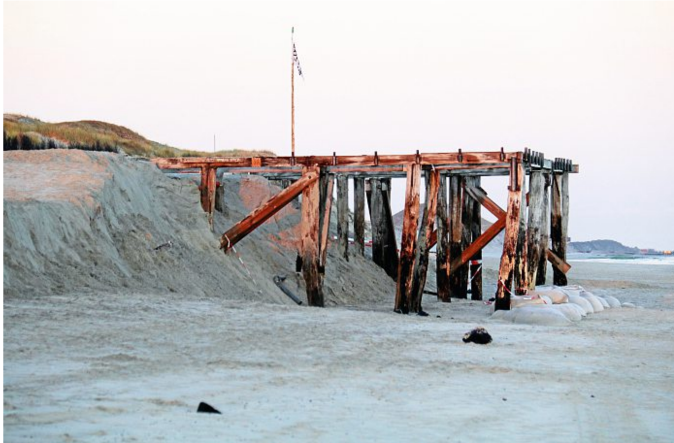
Die Holzkonstruktion an der Weißen Düne wurde bei der ersten kleinen Sturmflut massiv unterspült.