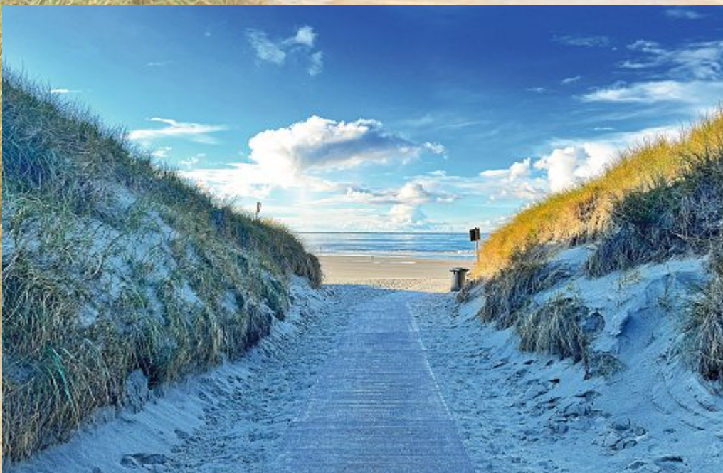
Blau-grau - eine beliebte Kombination, gerade auf der Insel.