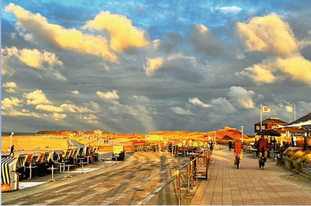
Eine ganz besondere Stimmung in fast unwirklichem Rot-Gold.