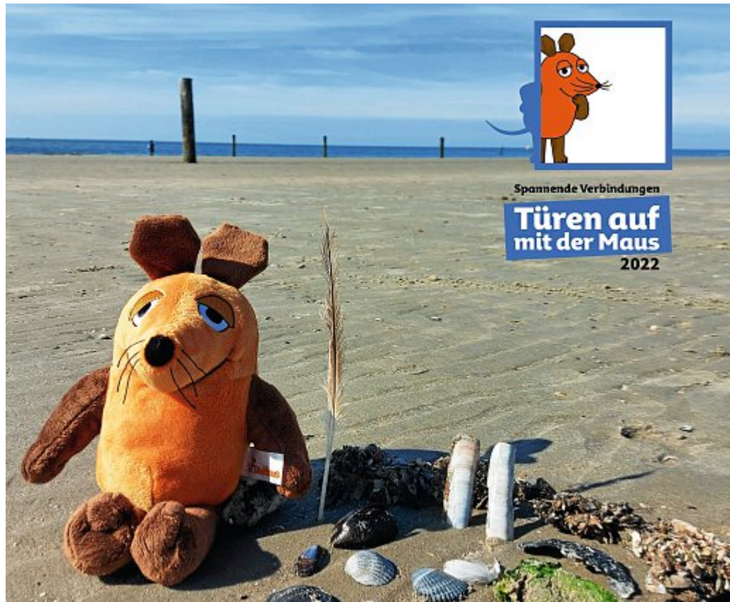
Erstmals beteiligt sich das Watt Welten Besucherzentrum am „Maus-Türöffner-Tag“.

Das Besucherzentrum ist von 10 – 17 Uhr geöffnet, die interaktive Ausstellung kann ihr eigenständig mit Euren Familien erkunden. Zudem warten noch kleine- re Überraschungen auf