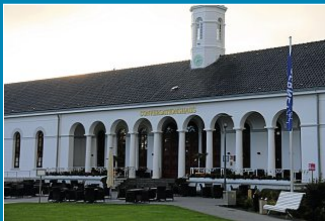
225 Jahre Nordseeheilbad. Norderney feiert am 3. Oktober ein außergewöhnliches Jubiläum.