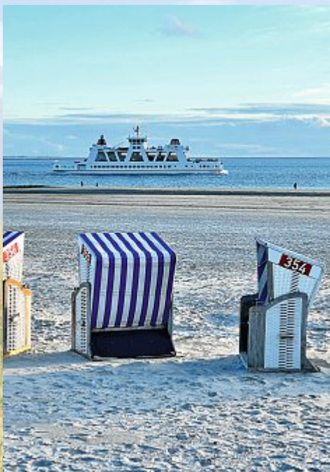
Das Blau schwimmt zu grau...