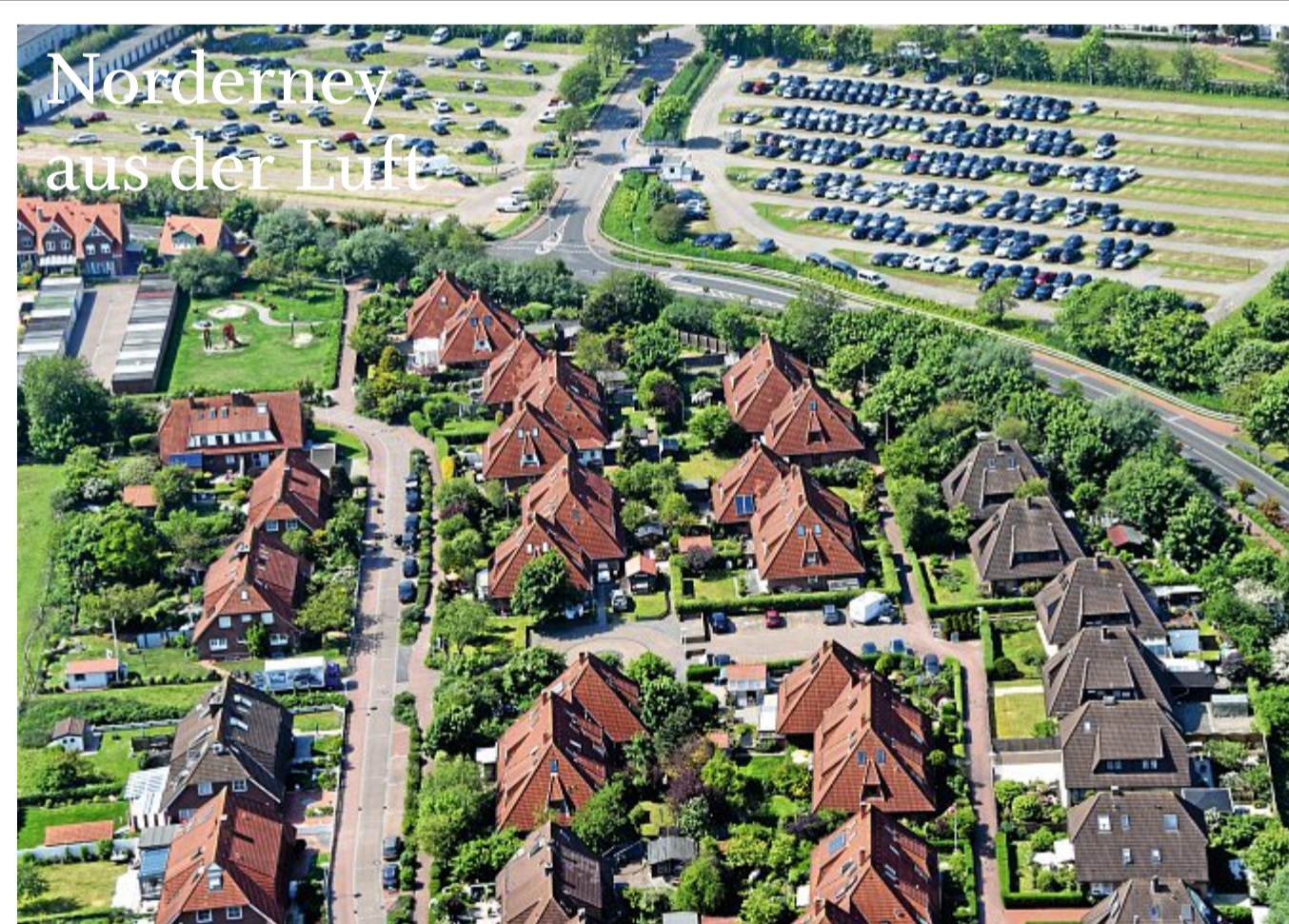
Das Bild stammt aus Juni 2018, die Bestellnummer lautet 2233.

Strauch mit orangefarbenen Beeren seht, wisst ihr, dass ihr einen Sanddornstrauch vor euch habt. Ich finde diese an der Nordsee so berühmte Pflanze auf jeden Fall äußerst hübsch und ziemlich interessant. Ich werde nun mal weiterfliegen! Bis nächste Woche, Euer Kornrad