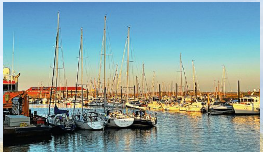
Noch ist es ruhig in den sanft wiegenden Kojen.