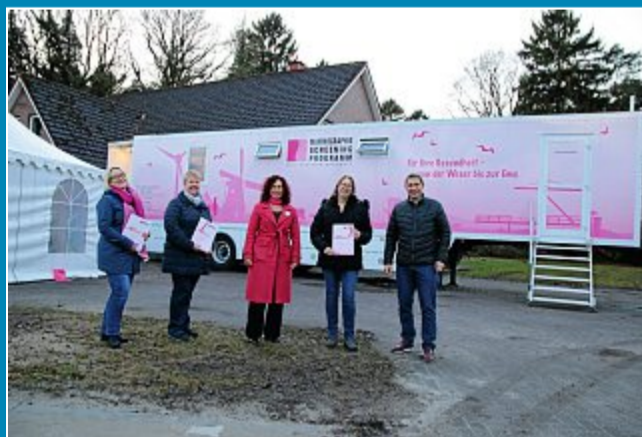
Noch bis Sonnabend steht das „Mammobil“ an der Grundschule.