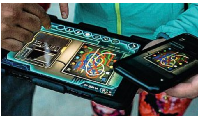
Handy und iPad helfen bei den Lösungen der Rätsel.

Hitze, Strömungen oder der Klimawandel? Warum gibt es zurzeit so viele von den Gelee-Fischen an den Inselstränden? Worauf sollte man achten?