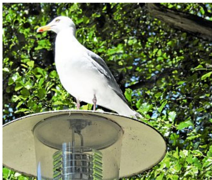
Von hier oben hat die Silbermöwe den besten Überblick.

Hin und wieder sang eine Amsel während der musikalischen Darbietung in der Nähe der Konzertmuschel. Wenn dann die Musik aus den Lautsprechern ertönte, wurde der Gesang der Am-