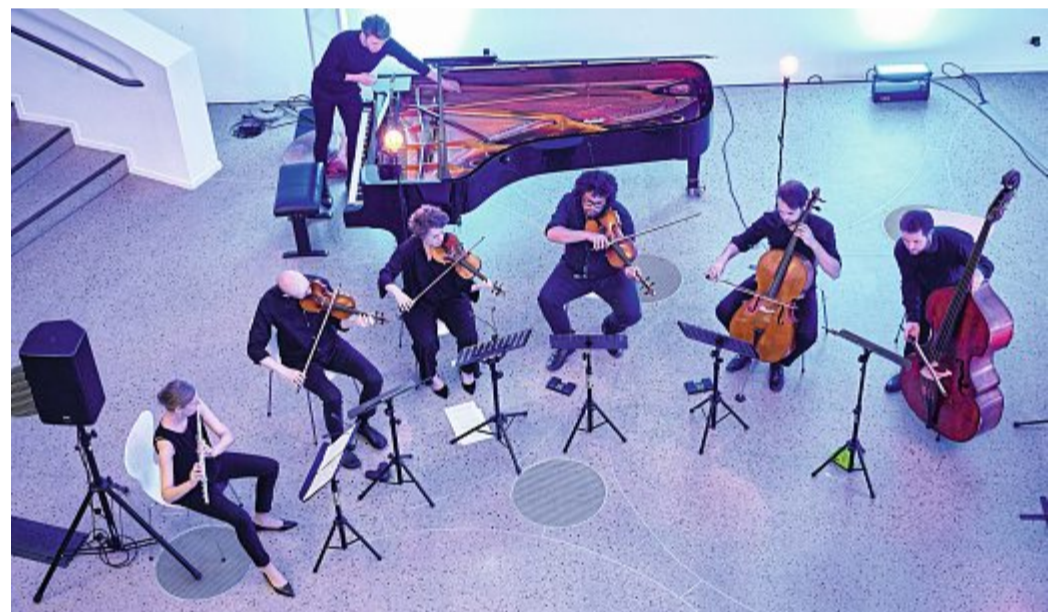
Das Orchester im Treppenhaus beim SeaSounds Festival 2022.

Das Eröffnungskonzert im Großen Saal des Conversationshauses wurde gut angenommen. Frei nach dem Motto: Bringen Sie sich ein kleines Picknick und eine Decke mit, suchen sich ein nettes Plätzchen auf dem Kurplatz und feiern Sie in