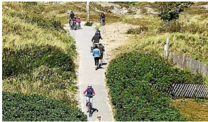
Der Zuckerpad ist nicht die einzige Problemzone.

Es geht um das Wegenetz im Inselosten – Bis zum 19. September läuft die Aktion