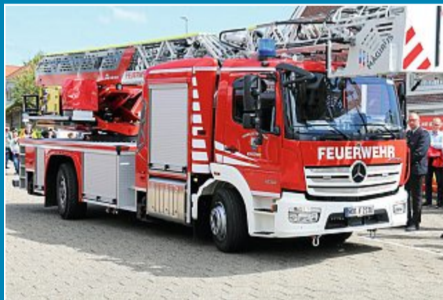
Die Freiwillige Feuerwehr Norderney kündigt für Sonnabend, 20. August, ab 14 Uhr einen Tag der offenen Tür an.