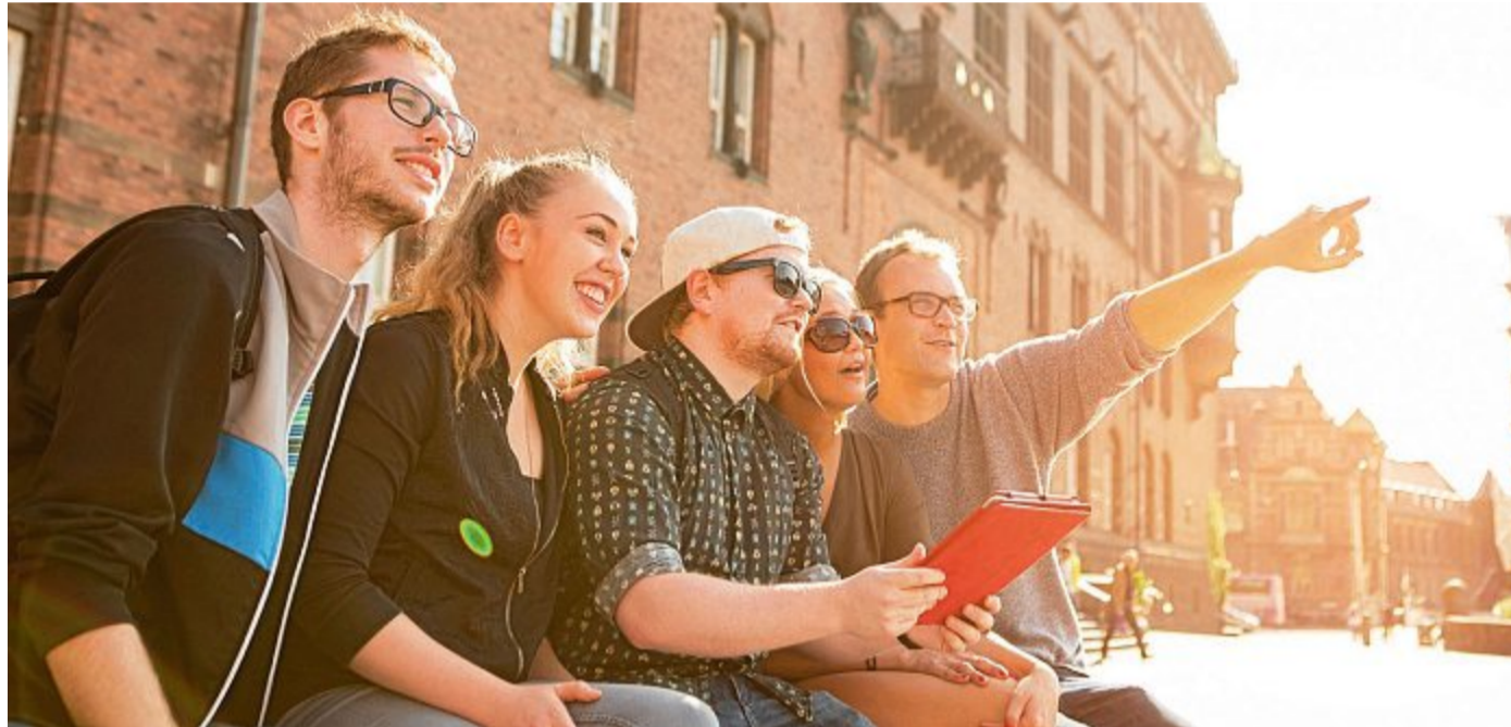
Besonders für Gruppen sollen sich die neuen Outdoor-Spiele eignen.

Die Teilnehmer erhalten ein „Action-Pack“ mit analogen und digitalen Hilfsmitteln. Dabei sind Kobold-Karten, magische Münzen und eine Rätselscheibe aus Holz. Dabei ist auch ein iPad, mit dem Spielsequenzen