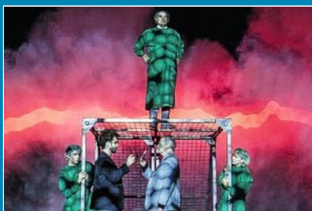
Die Landesbühne kündigt Vorstellungen auf der Insel an.