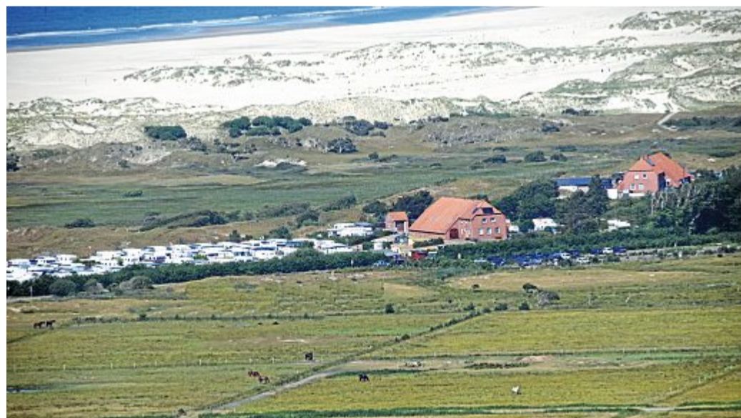
Auf der Domäne Tünnbak unterhält Familie Harms einen Campingplatz.

Übereinkommen über Domänen Grohde und Tünnbak bis 2041