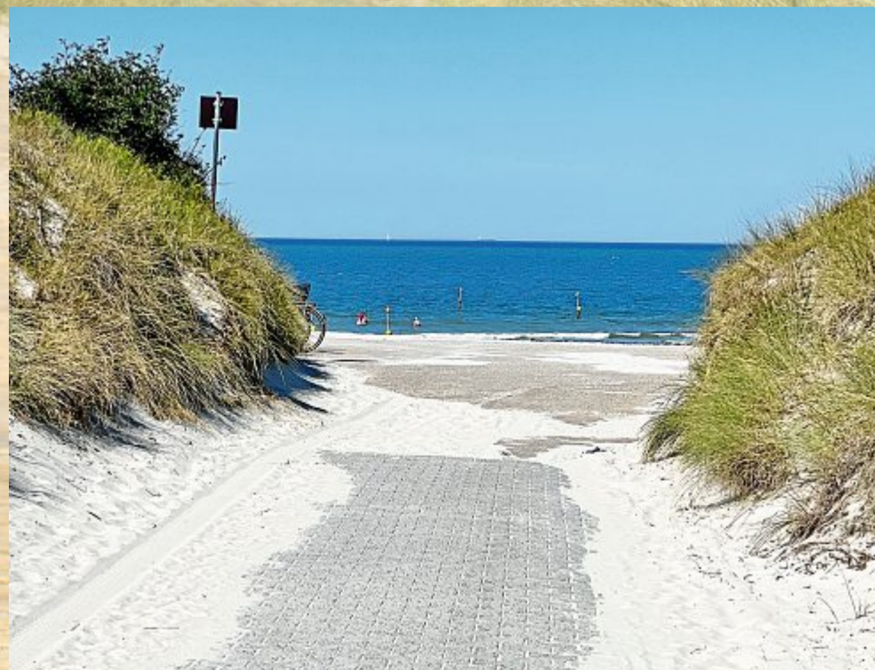
Viele Einheimische gehen früh am Morgen ins Wasser.