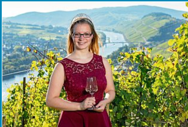
Das Winzerfest auf dem Kurplatz geht zu Ende.