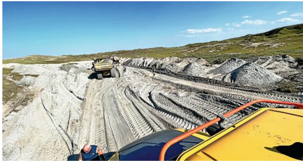
Was aussieht wie bei einem Panzermanöver sind naturgeschützte Dünentäler.