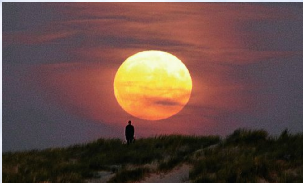
Vollmond über dem Dünenhorizont.