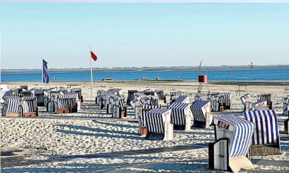
Gegen 9 Uhr sind noch alle Strandkörbe frei.