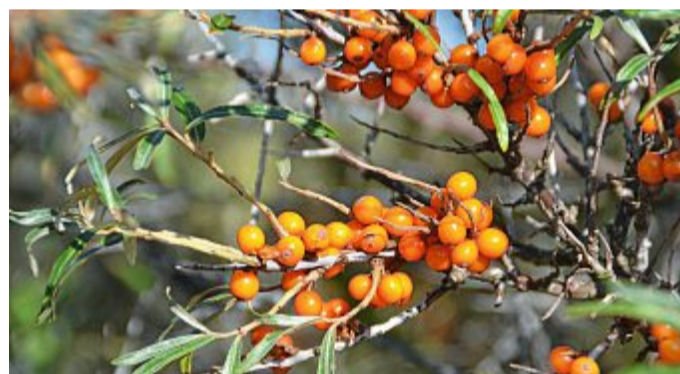
Kleine Beere ganz groß. Die Früchte gelten als Superfood. Archivbild

Die „Zitrone des Nordens“ kann unter sehr kargen Bedingungen gedeihen