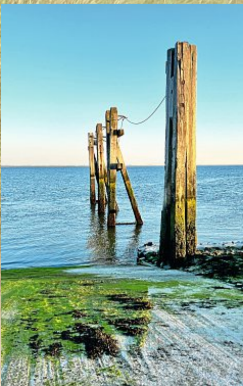
Auch Richtung Hafen ist es morgens ruhig.