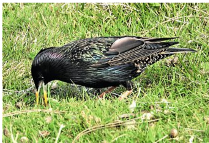
Der Vogel „zirkelt“ durch das Gras, um Nahrung zu finden.