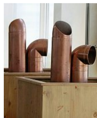
Aus Messingrohren strömt das Aerosolkonzentrat ein.