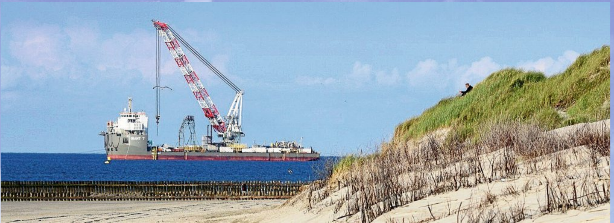
Wahrscheinlich hatte sich der Dünengast die Aussicht etwas anders vorgestellt als 136 mal 37 Meter Stahl.