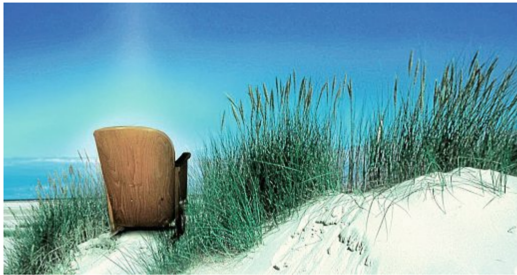
Tickets für die Filme gibt es online und im Conversationshaus.

Im Verlauf des Festivals werden insgesamt Preisgelder in Höhe von 55 500 Euro vergeben. Dabei entscheidet bei den Filmwettbewerben das Publikum über die Gewinner. Der Emdener Drehbuchpreis wird durch eine vom Marler Grimme-Institut berufene Fachjury vergeben und ist mit insgesamt 12 000 Euro dotiert. Workshops, Filmgespräche, Talkrunden und Galaveranstaltungen zur Eröffnung und Preisverleihung ergänzen das umfangreiche Programm.