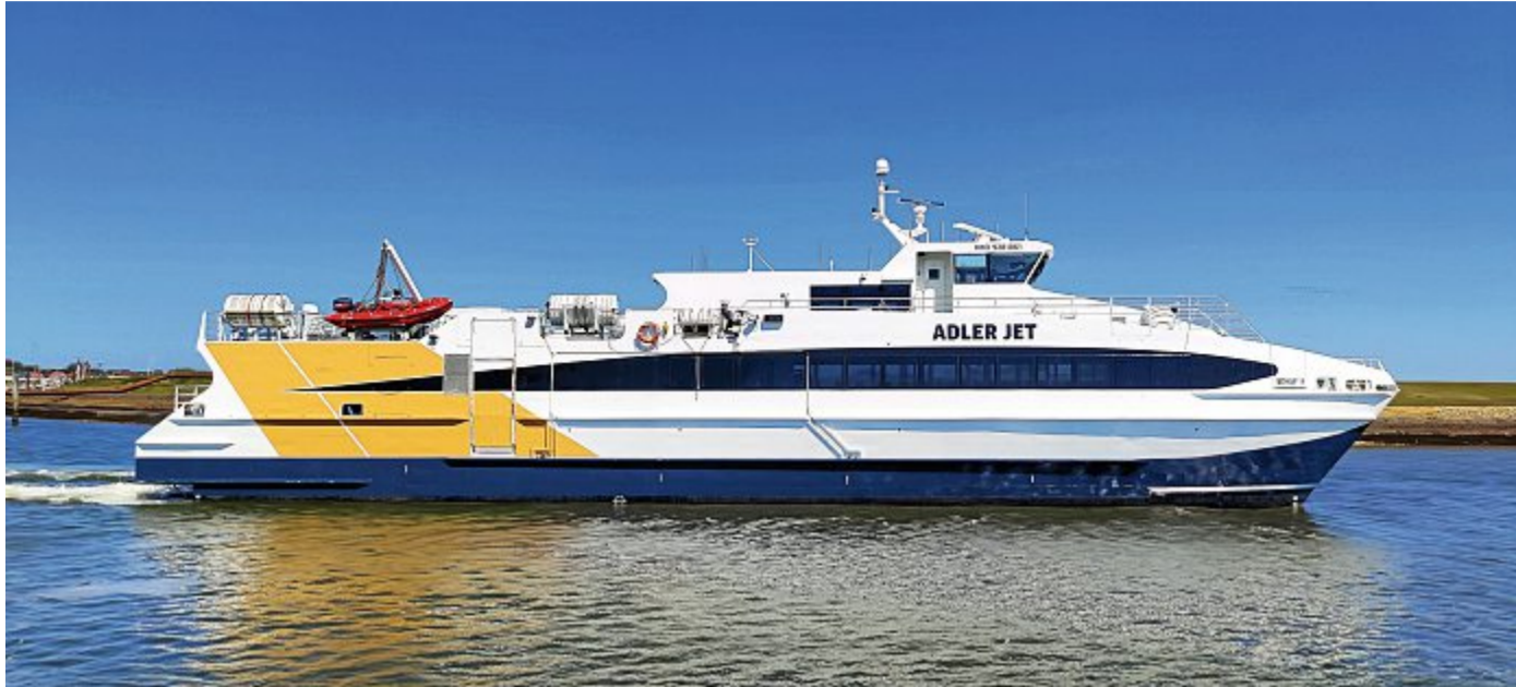
Von Anfang Mai bis Oktober fährt der Katamaran „Adler Jet“ für die Reederei Norden-Frisia im Helgolandverkehr.

Aufgrund der großen Nachfrage bietet die Reederei Norden-Frisia seit Beginn des Monats bis in den Oktober endlich wieder Tagesfahrten zu Deutschlands einziger Hochseeinsel in der Deutschen Bucht an. Die Helgolandfahrten sind ein Angebot der Inseltouristik Norderney in Kooperation mit der Reederei Adler Schiffe. Jeweils von Sonnabend bis Mittwoch geht es bei fast jedem Wetter nach Helgoland und zurück. Dabei setzen die Veranstalter mit dem Katamaran „Adler Jet“ auf einen zuvor auf den Lofoten eingesetzten hochseegängigen Katamaran. Ein mit Jetantrieb ausgestattetes und für die Flachwasserzonen des Wattenmeeres bestens geeignetes Schiff für insgesamt 267 Passagiere. 30 Reisende finden dabei Platz auf dem exklusiven Oberdeck. Insgesamt ist das Schiff gut 41 Meter lang und 11,50 Meter breit. Die Kabine mit den Sitzgelegenheiten für die Passagiere erinnert in ihrer Struktur an einen übergroßen Jumbojet. Bequeme Ledersitze anstatt harter Plastikschalen. Dazwischen übergroße Monitore, die Außenansichten in das Innere übertragen. An alles wurde ge-