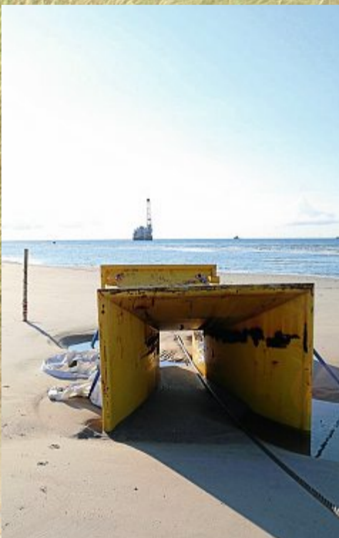
Durch diese hohle Gasse muss es kommen.