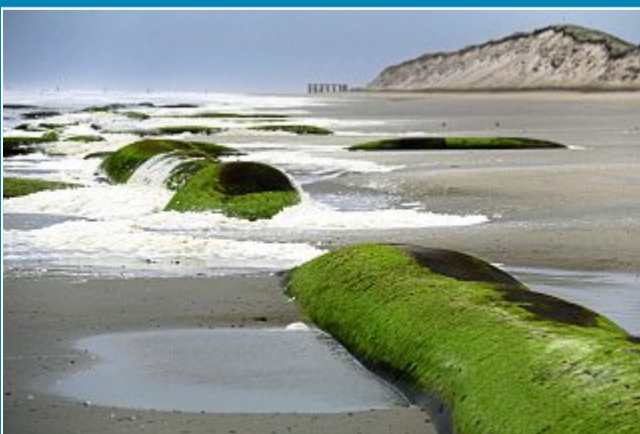
Wann die Sandaufspülung kommt, bleibt unklar.