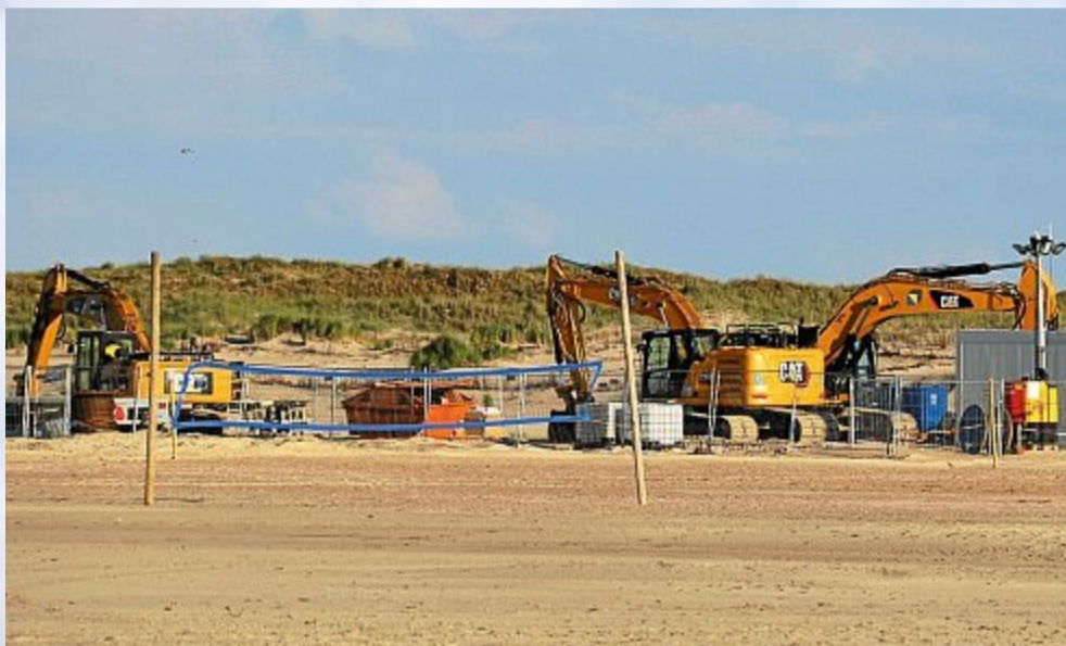
Aber auch andere Schwergewichte werden am Strand eingesetzt.