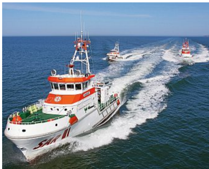
Beim Aktionstag wieder „live“ im Einsatz.

Die DGzRS hat als Rettungsdienst eine besondere Verantwortung, um die