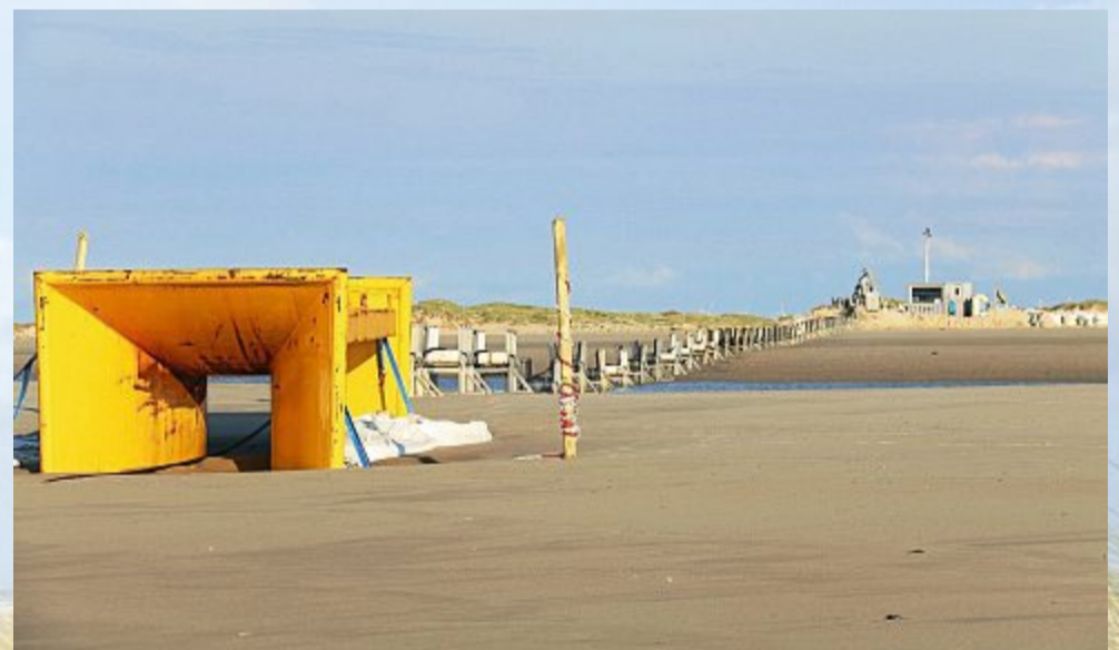
Dieser gelbe Metalltunnel wird als Nadelöhr genutzt, um das Seekabel zu leiten.