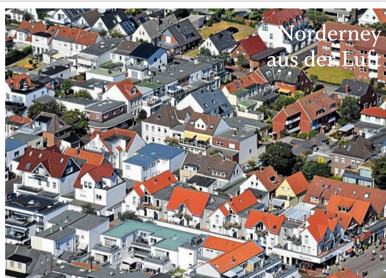
Das Bild stammt aus Juni 2018, die Bestellnummer lautet 2222.

Liebe Leserinnen und Leser! Dieses Foto und weitere Luftbilder können Sie unter Telefon 04932/991968-0 bestellen. In unserer Geschäftsstelle, Wilhelmstraße 2, auf Norderney nehmen unsere Mitarbeiter Ihre Bestellung auch gern persönlich entgegen. Ein Fotoposter im Format 13 x 18 cm ist für 5,80 Euro, im Format 20 x 30 cm für 14,80 Euro, im Format 30 x 45 cm für 25,80 Euro zu haben. Auch größere Formate bis zu Sondergrößen auf Leinwand sind möglich. Weitere Luftbilder finden Sie auch online unter www.skn.info/fotoweb/archives/5006-Bildergalerie_Luftbilder/ .