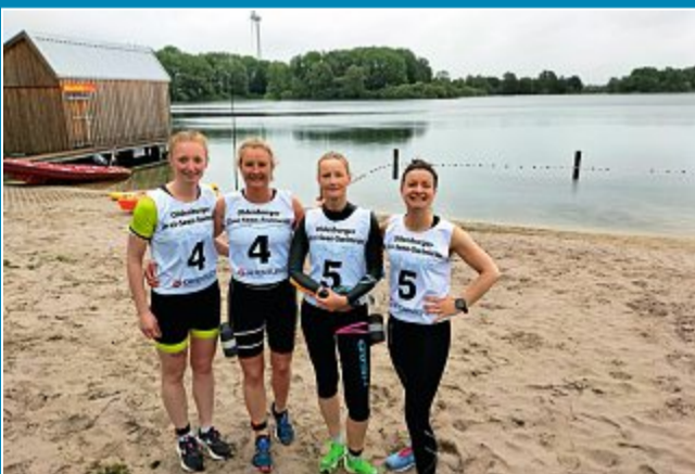
Triathletinnen mit guten Ergebnissen.