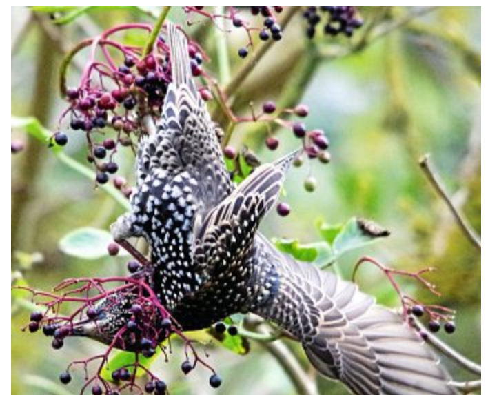
Beeren für das Körperfett.

man auf den Rasenflächen im Vorland unglaublich viele dieser durch das Zirkeln geformte „Trichter“ dicht beieinander. Der Gesamtanblick erinnert an ein großes Netz. Dieses bedeutet allerdings keinen Schaden für den Rasen, sondern die Flächen werden dadurch belüftet. Selten konnte bisher das Zirkeln so deutlich abgebildet werden wie auf diesem Foto, weil der Schnabel bei der Aktion meist schon im höheren Gras verschwunden ist. Auf diesem Foto ist allerdings deutlich der ge-