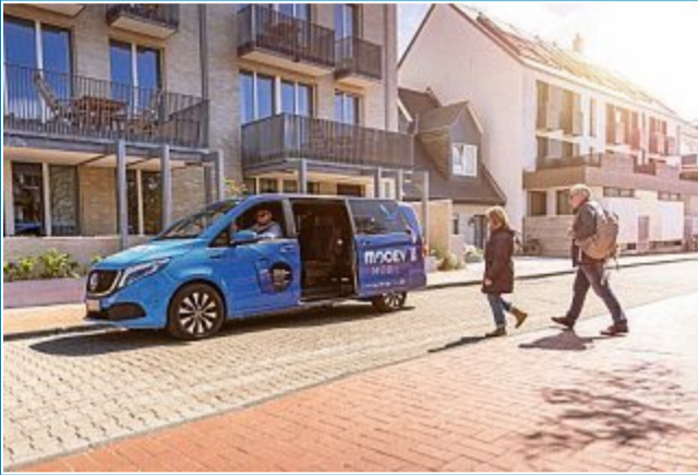
Nach Aussagen der Betreiber ist Moovee gut angelaufen.