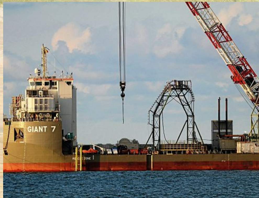
In der Mitte erkennt man den Aufnahmebogen für das Kabel.