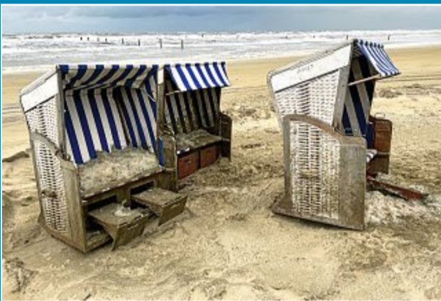
Da war die Flut wieder schneller.