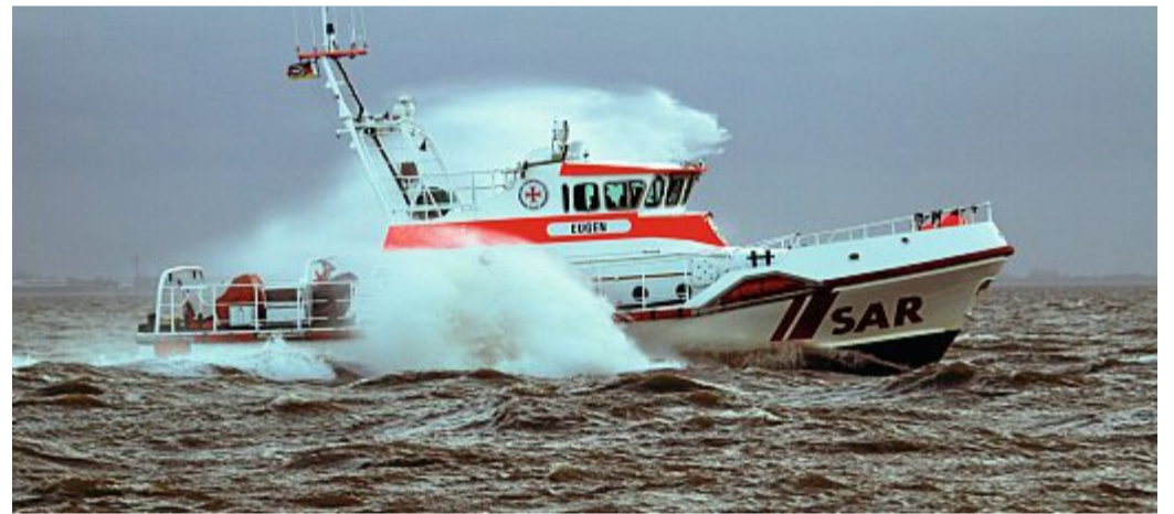
Seenotrettungskreuzer „Eugen“ unter Volldampf zum Einsatz.

Für alle da, die Hilfe auf dem Wasser brauchen