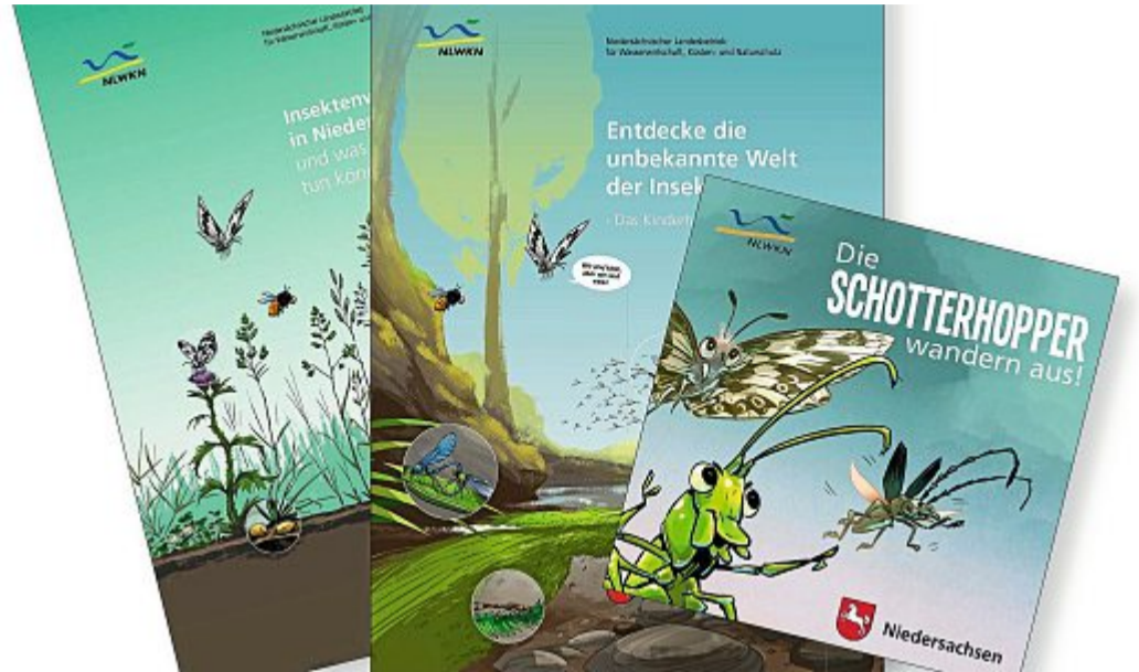
Drei Broschüren des NLWKN richten sich an Erwachsene, Kinder bis zur 2. und ab der 3. Klasse.

Alle Online-Informationen über die Schotterhopper und seine Kollegen sowie die Möglichkeit, die Hefte kostenlos herunterzuladen oder zu bestellen finden sich unter: www.nlwkn.niedersachsen.de/insektenvielfalt .