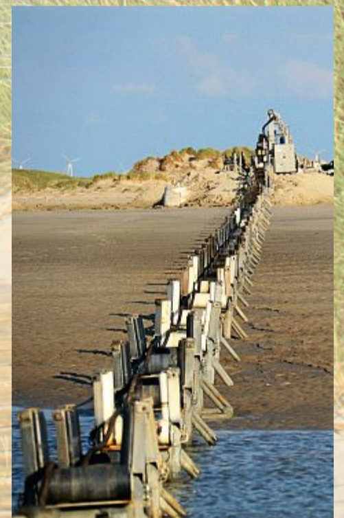
Auf Rollen geht es dann Richtung Insel.