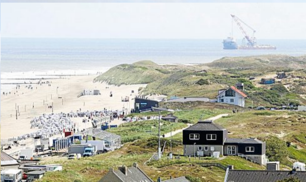
Selbst aus der Ferne wirkt das Multifunktions-Vessel noch imposant.