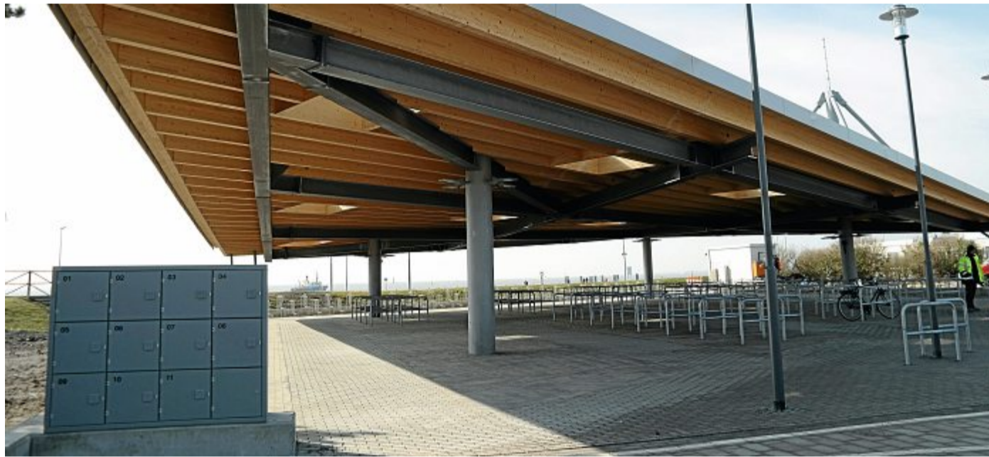
Noch gibt es reichlich Platz in der Anlage. Falls notwendig kann erweitert werden.

Es sind auch einige Stellplätze für Lastenräder und Fahrräder mit Anhängern angelegt. Die Anlage ist bis 22.30 Uhr beleuchtet, hat einen Blitzschutz und schließfächerartige Ladestationen für E-Bikes.