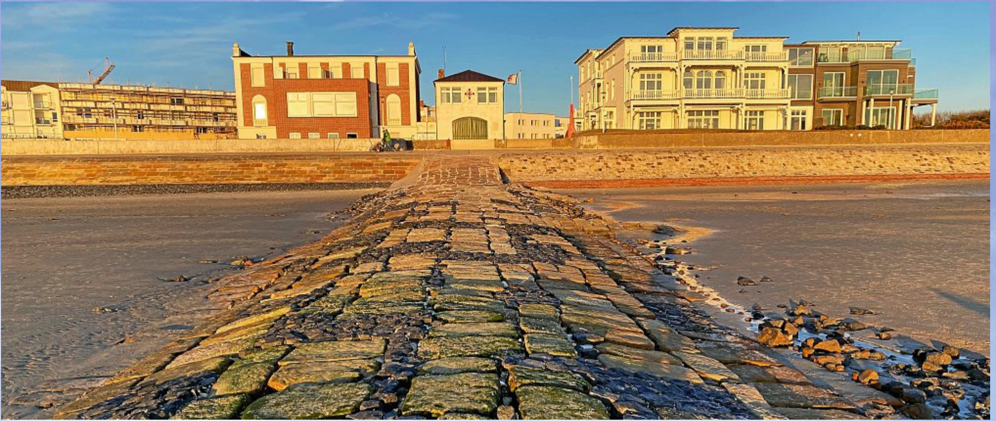
Blaue Stunde vor der alten Rettungsstation am Weststrand..