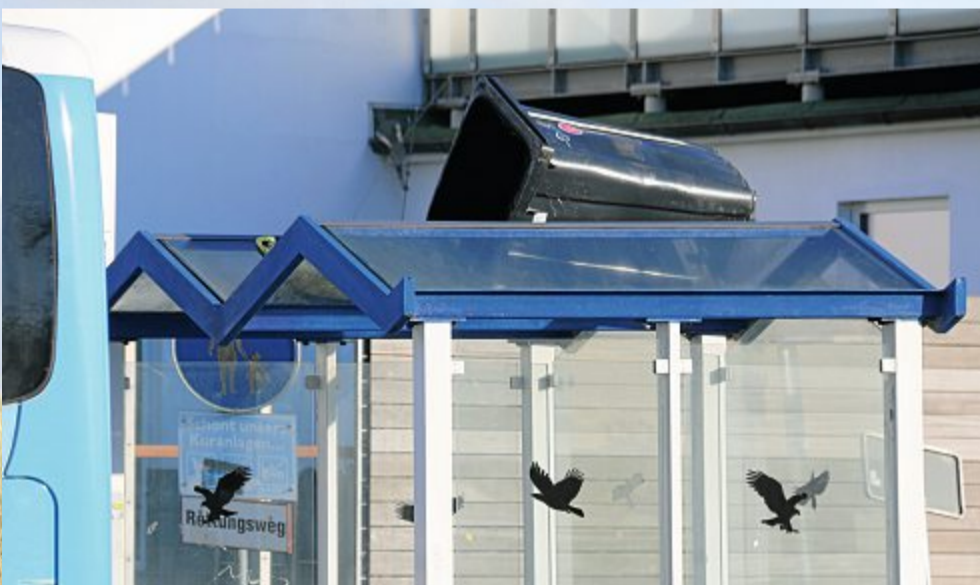
Mülltonne mit neuer Position..