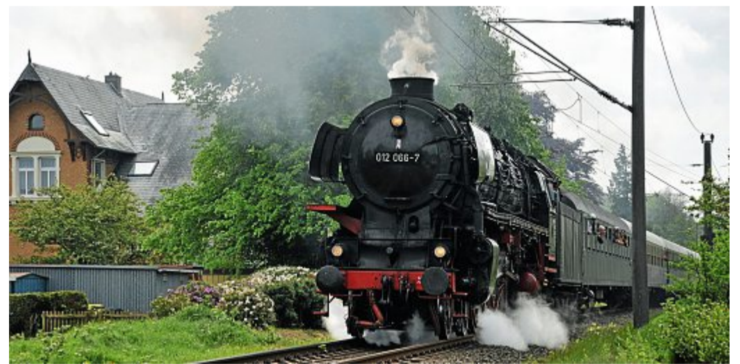
Reisen wie anno dazumal.

Gezogen wird der Zug bis Münster zunächst von einem alten „Krokodil“, der 194158 der Hammer Eisenbahnfreunde. Ab Münster übernimmt dann die riesige und ungemein leistungsfähige Schnellzugdampflok 01519 der Eisenbahnfreunde Zollernbahn den Sonderzug. Die 2470 PS starke und 130 Stundenkilometer schnelle Dampflok sorgt mit