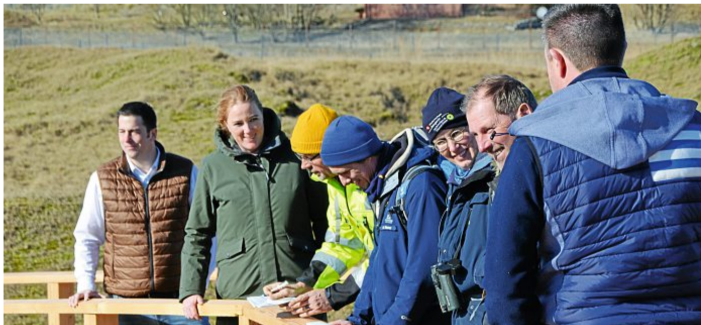
Bei der baulichen Abnahme wurden minimale Verbesserungen im Umfeld der neuen Anlage diskutiert und beschlossen.

Frei nach dem Motto: „Die schönsten Wahrzeichen bauen wir uns selbst“ hatte