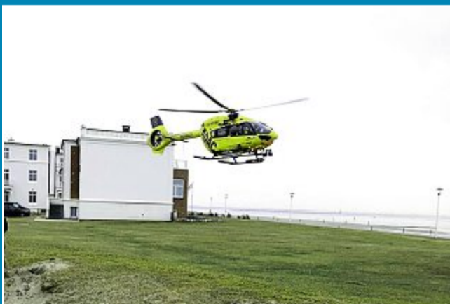
Nach einem Sturz erlitt ein Mann auf der Promenade eine schwere Kopfverletzung und wurde mit dem Hubschrauber abtransportiert.