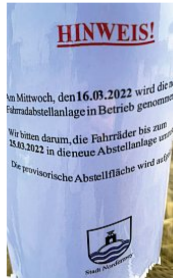
Die Stadt fordert die Fahrradfahrer auf, die jetzt außerhalb der Anlage parken, ihr Fahrzeug umzuparken.