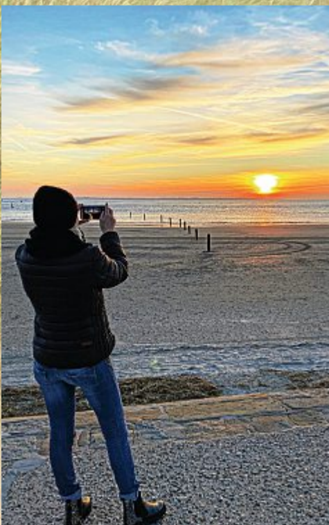
Sonnenuntergänge sind immer hoch im Kurs.