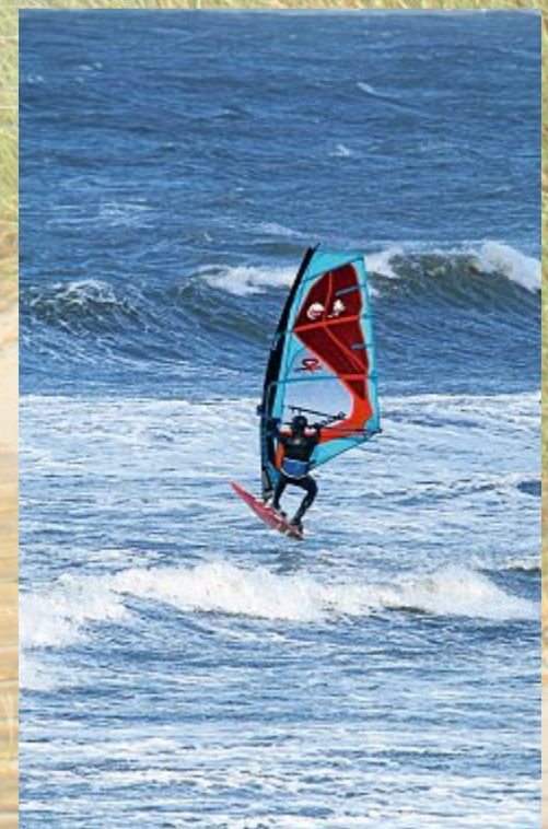
Surfen auch wenn es noch kalt ist..