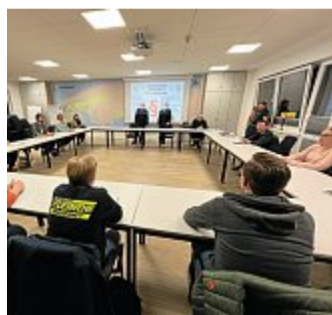
Die Ausbildung soll ab jetzt zu einem festen wöchentlichen Termin fortgesetzt werden.

Coronabedingt habe in den Monaten danach jedoch keine Ausbildung in Präsenz stattfinden können, erklärt Stürenburg. Da die Maßnahmen jüngst wieder gelockert wurden, kamen die neuen Mitglieder am Mittwoch ver-