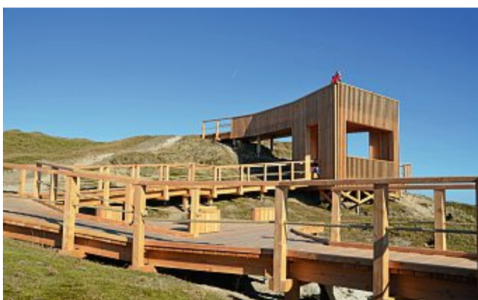
Die Holzkonstruktion fügt sich gut in die Landschaft.