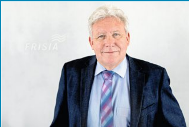
Die SPD-Fraktion bezeichnet die Vorgehensweise der Bürgerinitiative „Kieken wi mol“ als undemokratisch.