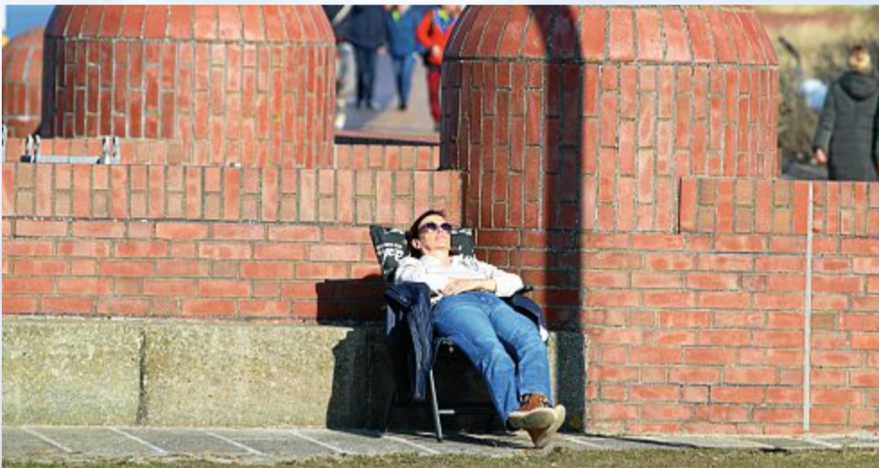
Foto-Mix zum Frühling