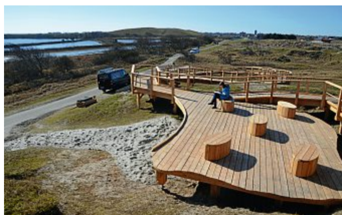
Schon von der unteren Terrasse hat man gute Sicht.