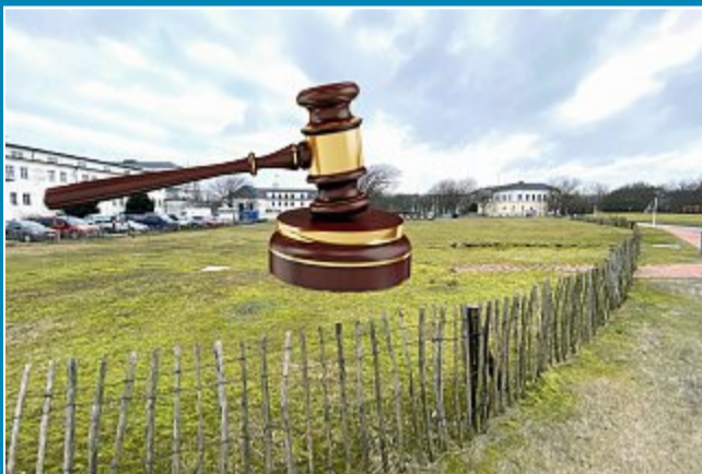
Die Entscheidung über das Bürgerbegehren liegt jetzt beim Verwaltungsgericht in Oldenburg.