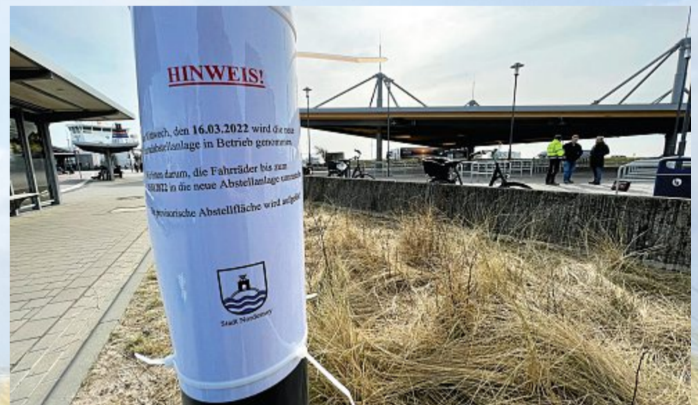
Die Anlag steht. Jetzt müssen nur noch die Räder umgestellt werden..