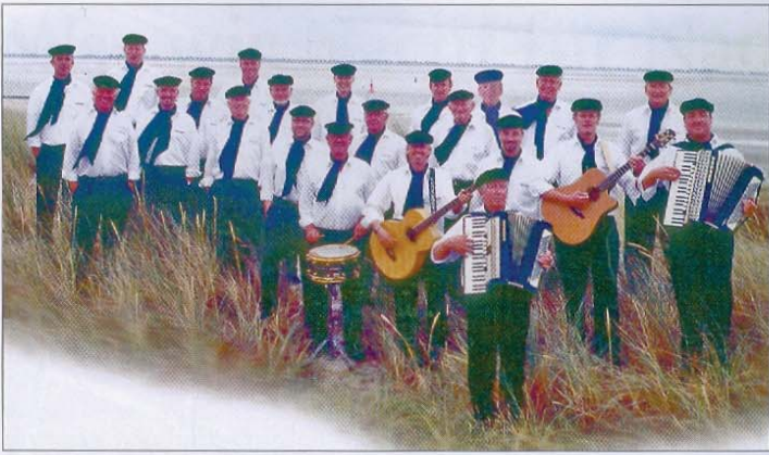
Immer gut gelaunt: die Döntje-Singers.