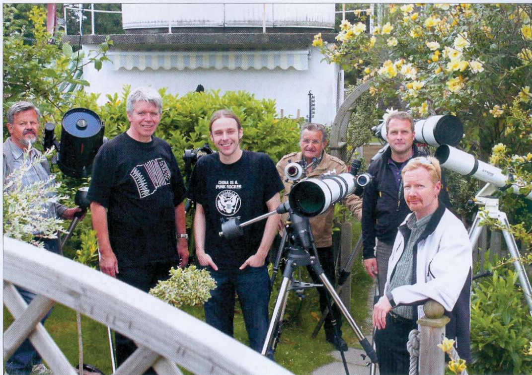
Auch sie haben den Durchblick: die Spezialisten von der Norderneyer Sternwarte.

Weitere Informationen unter www.Sternwarte-Norderney.de .