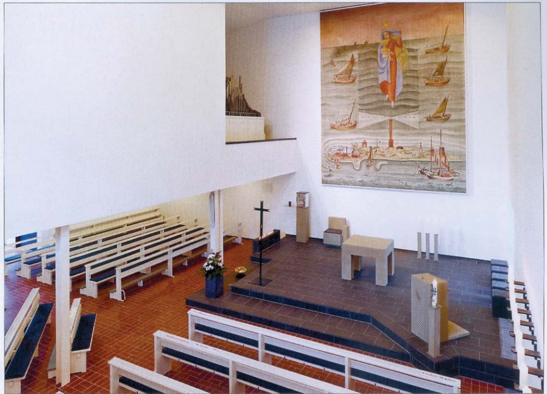
Die katholische Kirche Stella Maris.