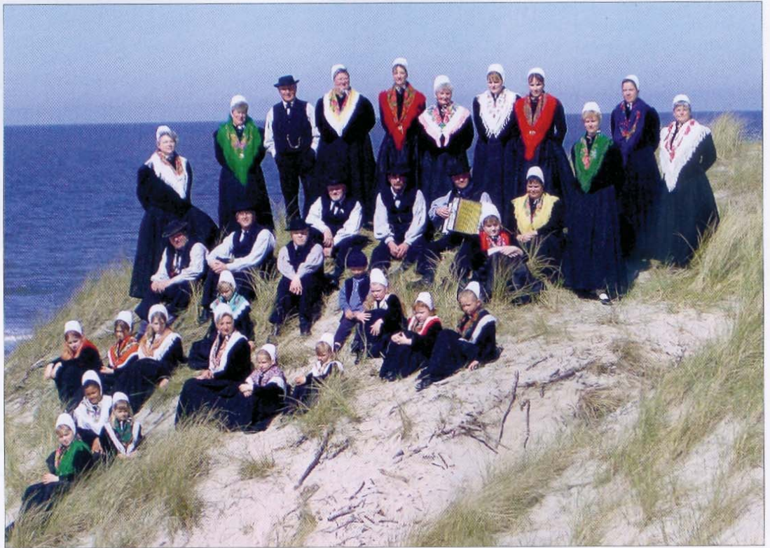
Bunte Farbtupfer in den Dünen: Der Heimatverein Norderney ist immer aktiv.

Mit der Vereinsgründung 1926 wurde zur gleichen Zeit die Spielschar als Trachtengruppe mit ins Leben gerufen. Der Verein wollte und will darauf hinweisen, dass er sich zur Aufgabe gemacht hat, sich für das Sprechen und somit für den Erhalt der plattdeutschen Muttersprache einzusetzen. Er will auch das alte Volksgut von unserem Eiland hochhalten und an unsere Kinder und Enkel weitergeben.