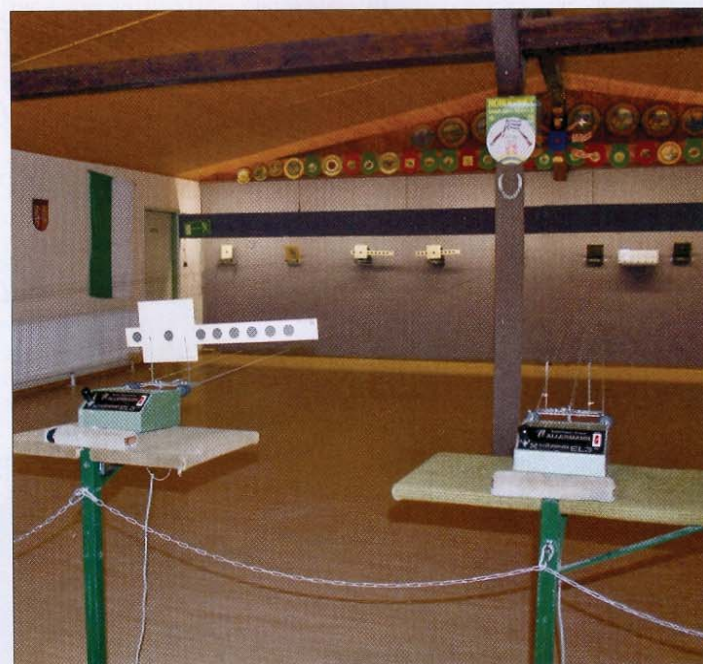
Gute Voraussetzungen für die Aktiven des Schießsportvereins.

Wir wünschen all unseren Nachbarn von den anderen Inseln für die Veranstaltung „Insulaner unner sück“ auf Norderney alles Gute und wir freuen uns auch auf ein Wiedersehen in unseren Räumen.