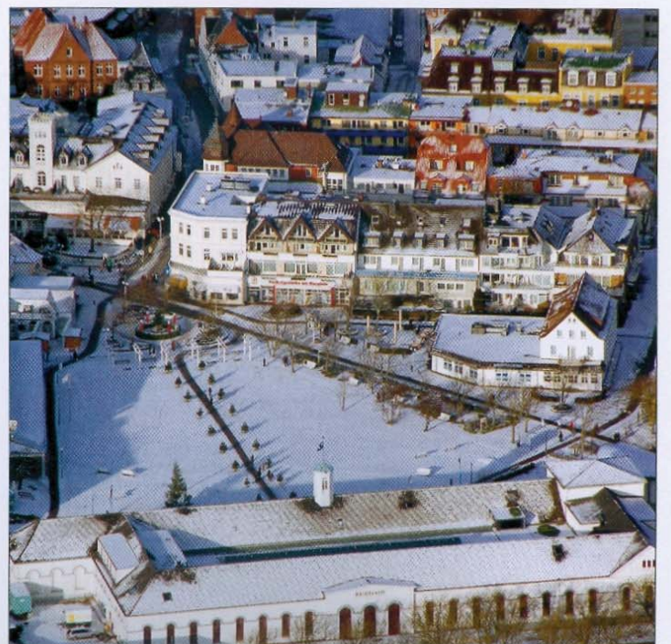
Das weiße Zentrum der Insel Norderney aus der Vogelperspektive.