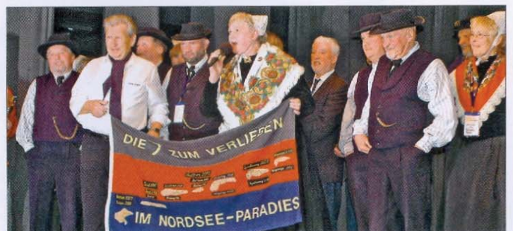
Im vergangenen Jahr wurde auf Baltrum die Fahne für die Organisation an die Norderneyer Gäste weitergereicht.

Norderneyer Tänze, plattdeutsche Lieder und Gedichte von der Insel und auch vom ostfriesischen Festland wie auch Shantys, so wie unsere Fischerleute sie damals mitgebracht haben, werden vorgetragen. Döntjes dürfen auch nicht fehlen. Die hochdeutschen Erläuterungen bringen das Brauchtum, die Tracht, die Lieder und Tänze den Gästen näher. Sie werden dankbar angenommen. Viel wird über Norderney und die Norderneyer aus den vergangenen Zeiten erzählt.