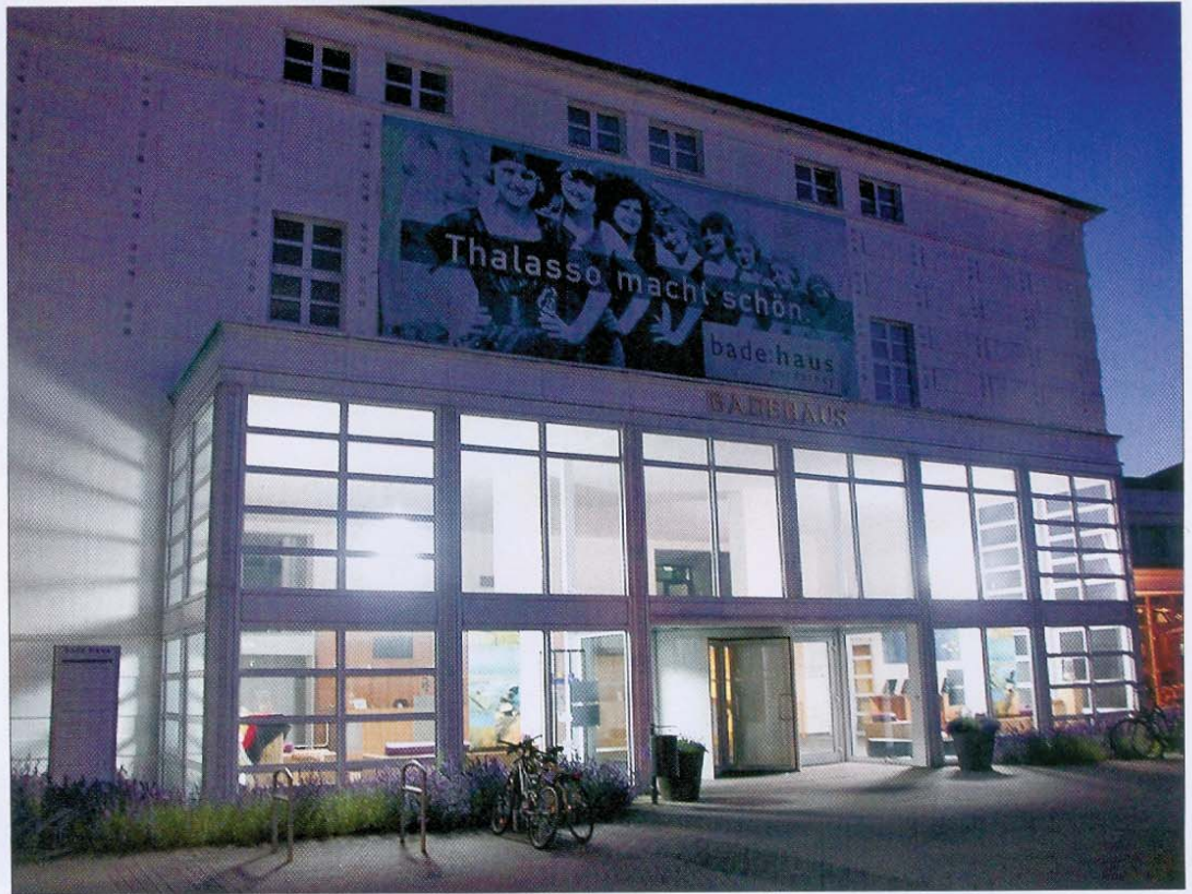
Das Thalasso-Badehaus am Kurplatz.

Diagnose, sondern vor allem auf alle einzelnen Befunde an“, machte Menger stets deutlich.