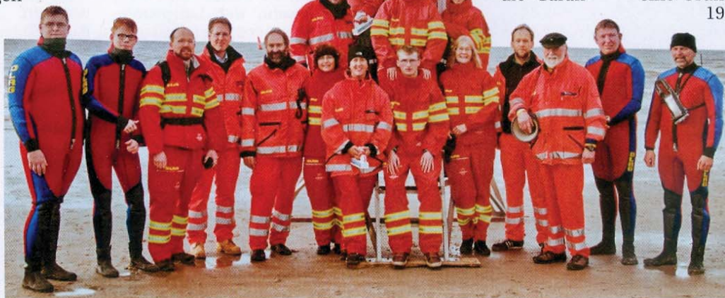
Mit guten Leistungen hoch hinaus: die Akteure der Deutschen Lebens-Rettungs-Gesellschaft (DLRG) Norderney.