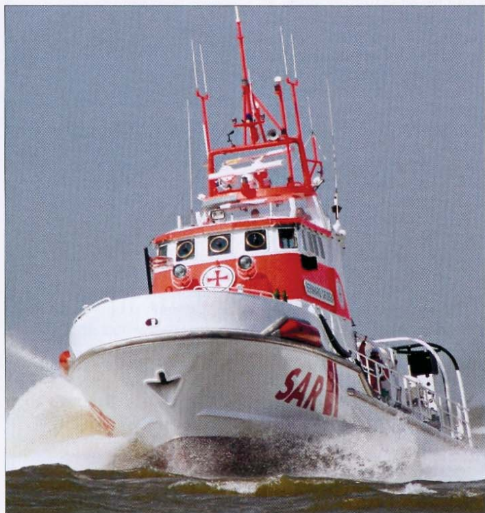
Volle Fahrt voraus: die „Bernhard Gruben“.

Um dieses alles leisten zu können, bedarf es ebenfalls viel ehrenamtliche Energie. Und so ist es schön, dass es auf Norderney um den harten Kern herum gut und gern 25 weitere ehrenamtliche Mitarbeiter für diese wichtige Sache gibt.