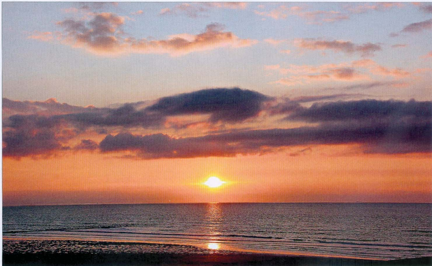
Sonnenuntergang auf den Ostfriesischen Inseln. Auch das ist ein Stück Heimat.

AUCH DIE SCHÖNSTEN TAGE MÜSSEN ZU ENDE GEHEN