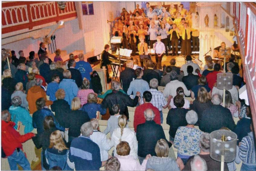
Viele Veranstaltungen finden in der Inselkirche statt.

Die Kirchengemeinde ist Trägerin des Inselfriedhofs. Der evangelisch-lutherische Kindergarten und die Diakonie-Sozialstation auf der Insel sind in Trägerschaft des Kirchenkreises Norden.