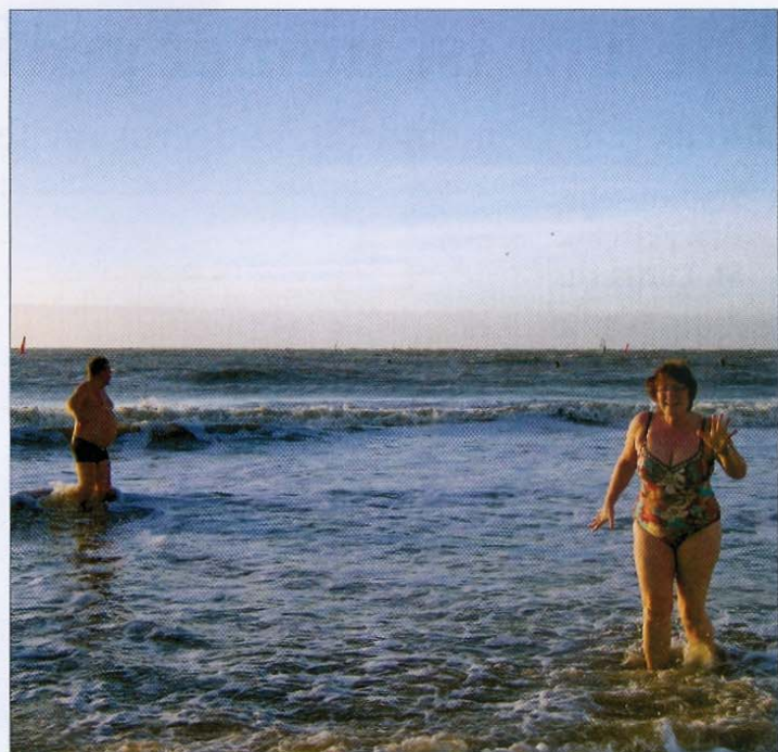
Thalasso: auch bei Minusgraden ein Genuss.