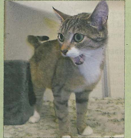
Die Katzendame Wenke

Wer sich für Wenke interessiert, kann sich beim bmt-Tierheim Hage unter Telefon 04938/425 melden. Das Telefon ist täglich von 14.30 bis 17 Uhr besetzt. Weitere Infos finden sich im Internet auf www.tierheim-hage.de .