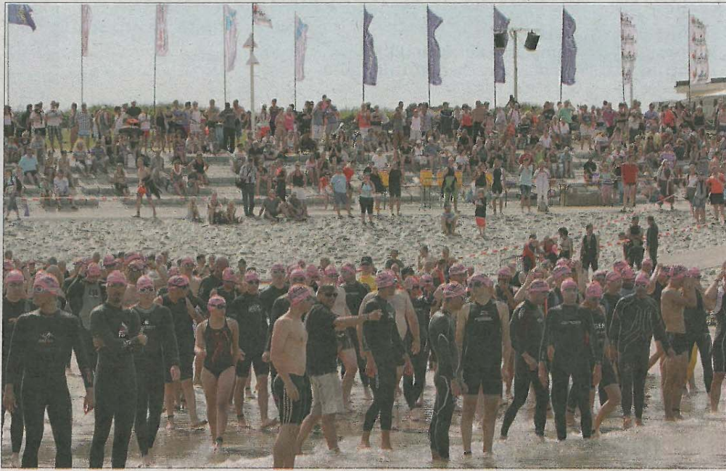
Start am Januskopf: Die Triathleten bei ihrer ersten Disziplin Schwimmen.

Start, Ziel und Wechselzone sowie zentraler Veranstaltungsort sind am Januskopf.