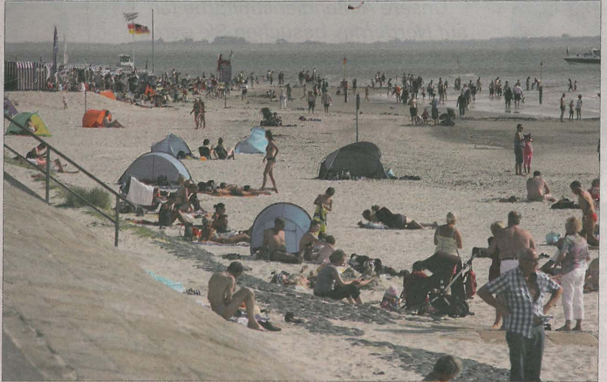
Ein wohlig warmes Sonnenbad im feinen Sand und zur Abkühlung zwischendurch einfach in die Nordsee hüpfen...