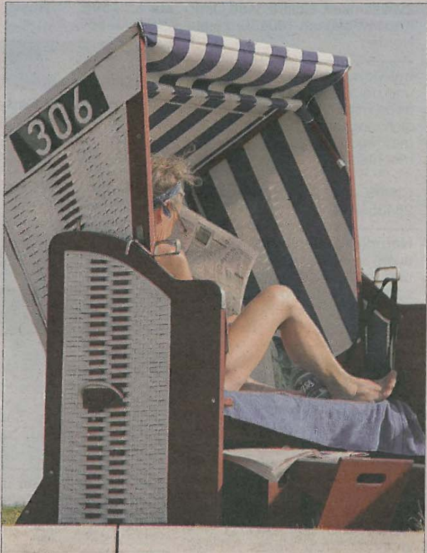
Zeitungslesen im Strandkorb – informativ und entspannend zugleich.