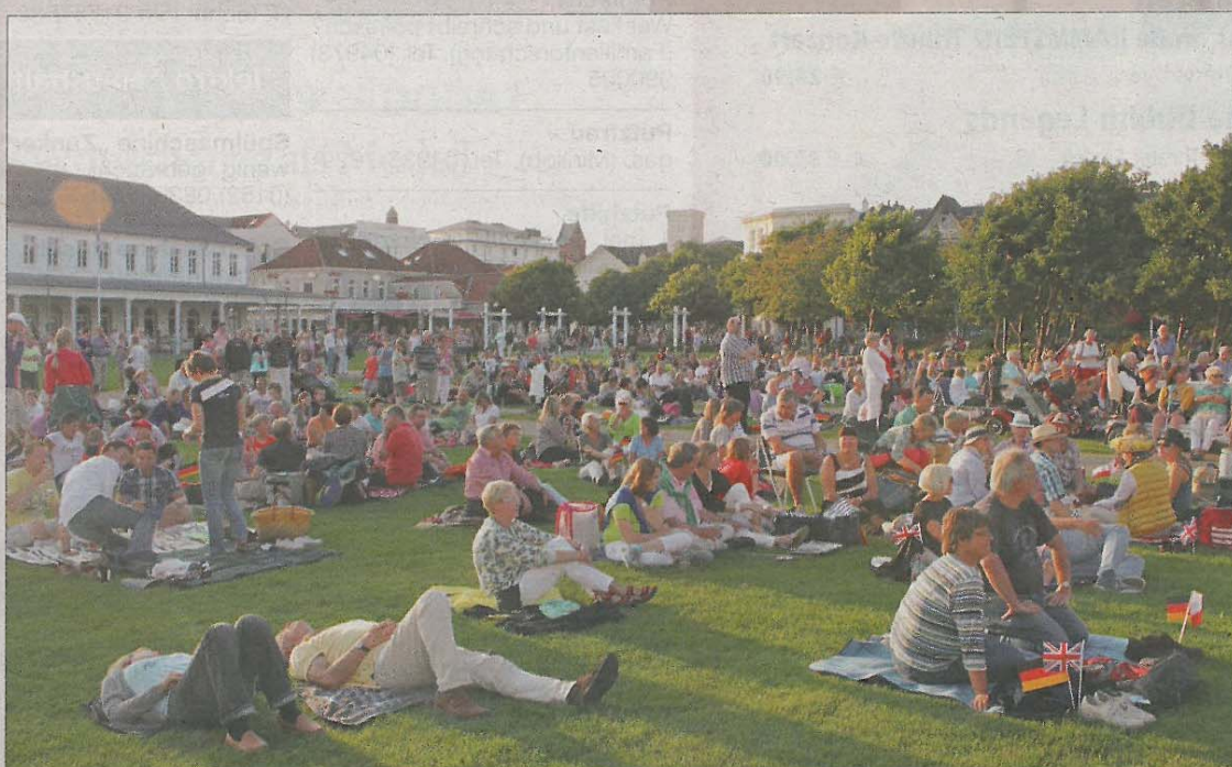
Picknick auf dem Kurplatz zur „Classic Night“. Auch hier konnte das sommerliche Wetter noch einmal in vollen Zügen genossen werden. Wer weiß, wie lange noch...