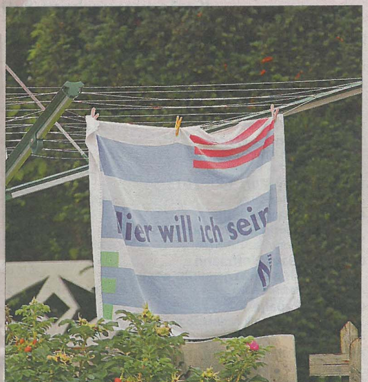
Wer keinen Fahnenmast im Garten hat, kann seine speziellen Vorlieben und Fan-Bekennnisse auch so zur Schau stellen.