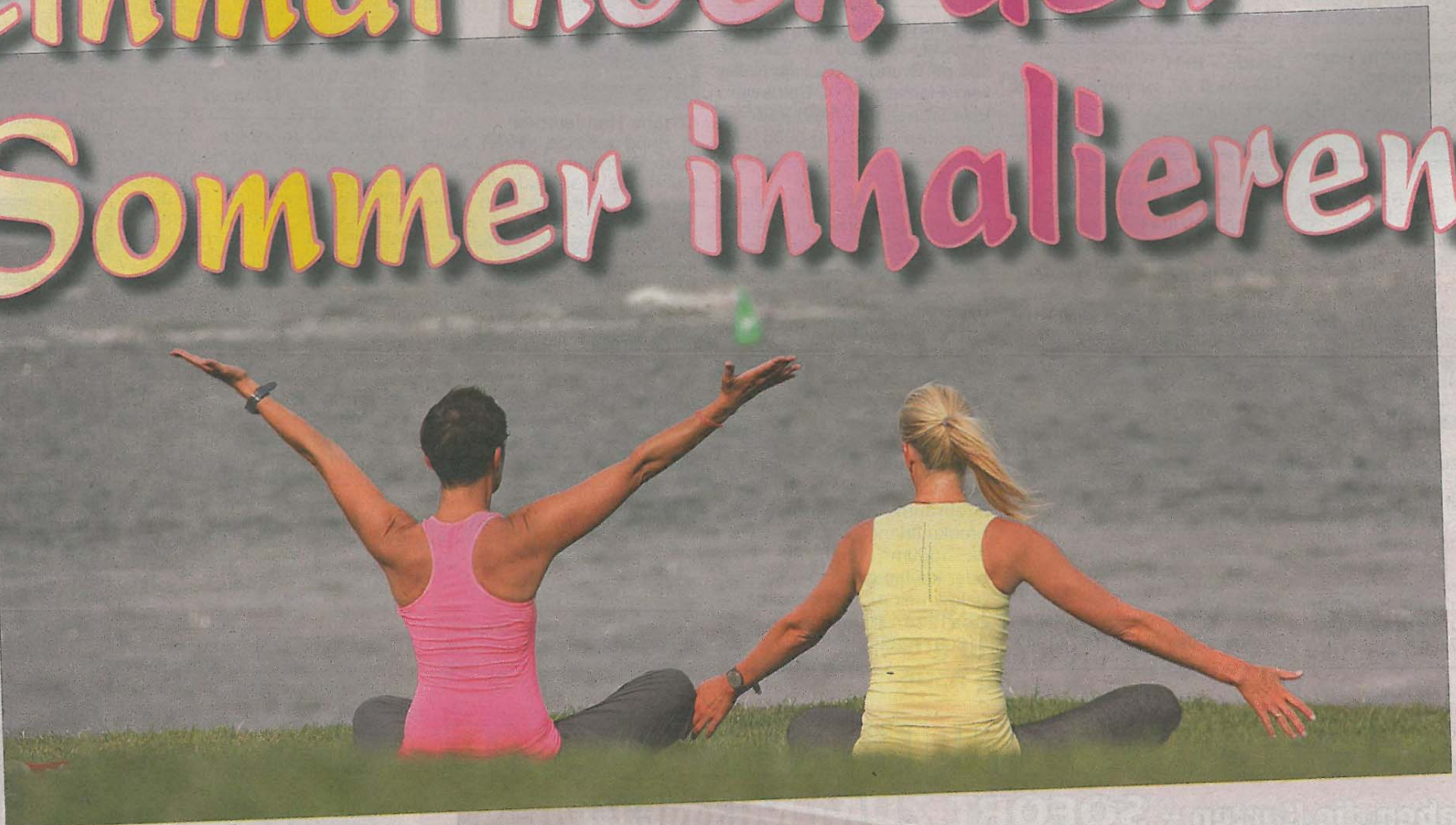
Einatmen, ausatmen und dabei guten Gedanken nachhängen...