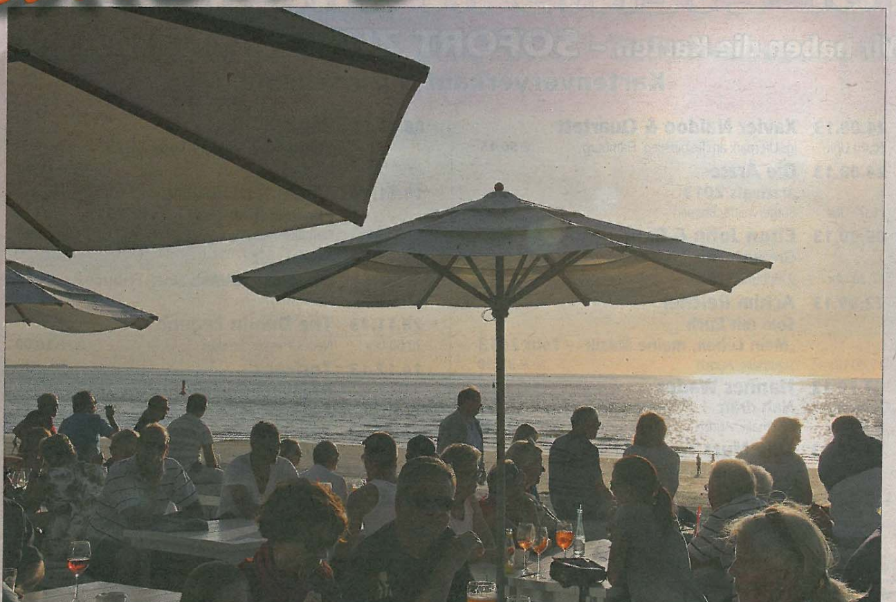
Ein lauer Abend, gute Gespräche mit Freunden oder neuen Bekannten und dazu der Sonnenuntergang als leises Schauspiel im Hintergrund. Wohl dem, der hier in der ersten Reihe sitzen kann.