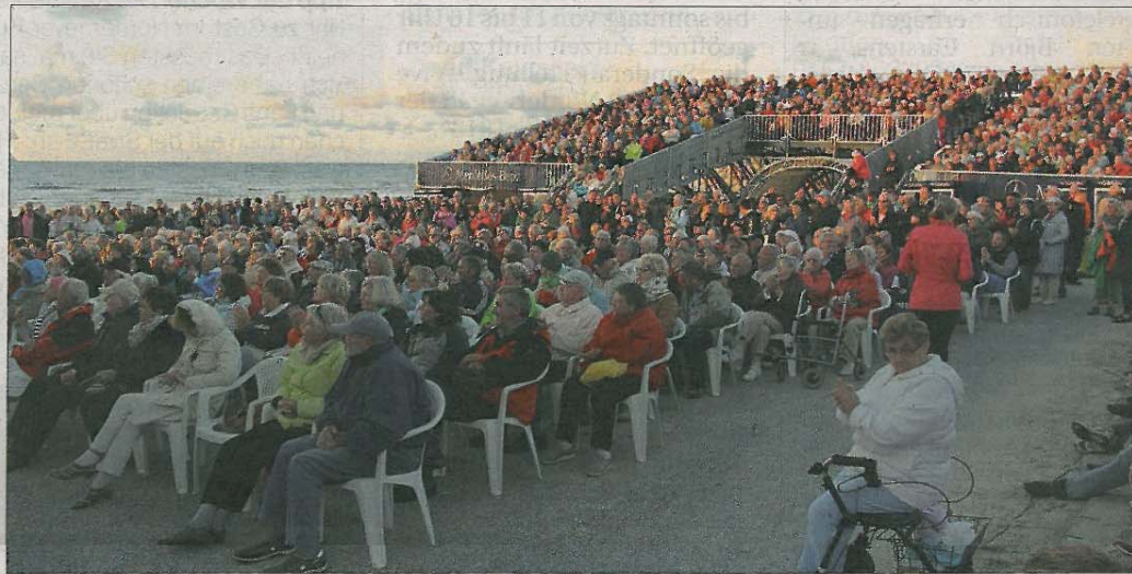
Direkt am Nordseestrand große Künstler erleben – zahlreiche Zuschauer nutzten diese einmalige Möglichkeit und besetzten jeden Platz in der Arena.

Der morgige Sonnabend lockt schließlich himmelwärts. Die diesjährige Drachenshow bietet viele Aktionen zum Anschauen und Mitmachen. Groß- und Lenkdrachen, Showdrachensflüge sowie eine Nachtflugshow mit Feuerwerk erwarten die Gäste. Ab 20 Uhr wird es dazu eine große Beach-Party geben. Für die perfekte Musikmischung in der Summertime-Arena