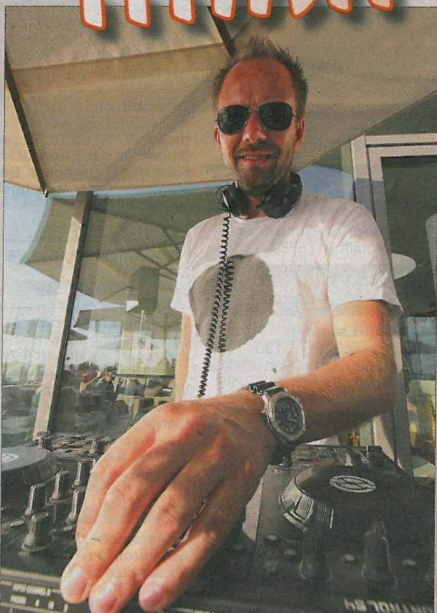
Und noch etwas für die Ohren: Frisch gemixter Sound vom Plattenteller, das gibt's auch nicht alle Tage am Strand.