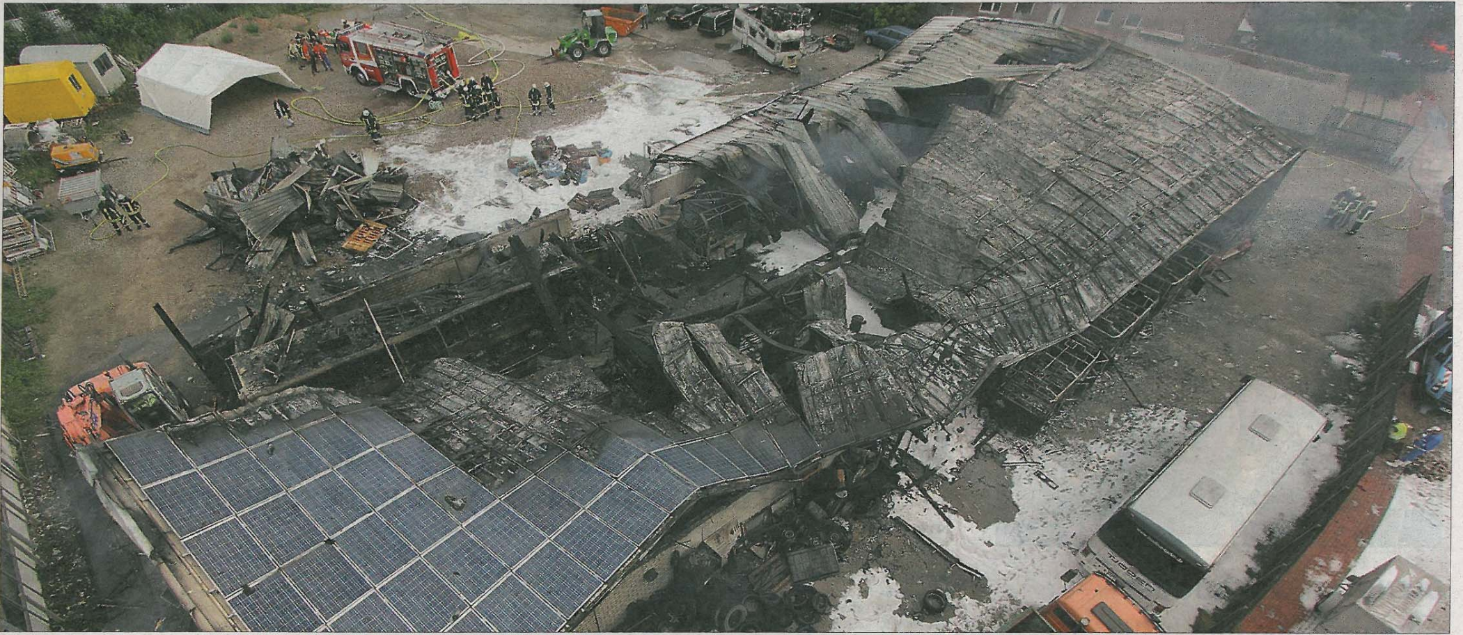
Von der großen Lagerhalle ist nur noch Schutt und Asche übrig. Vier Linienbusse, zwei Wohnwagen und ein Reifenlager sind ebenfalls völlig zerstört worden.