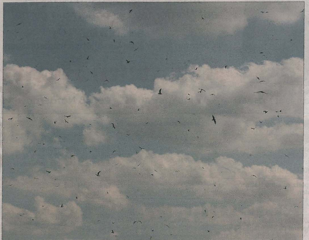
Etwas für Augen, Ohren und Nase: Wind und Meeresbrise als Backgroundchor, während die zwitschernden Vögel die Hauptstimme übernehmen. Wolkenzauber als Kulisse.