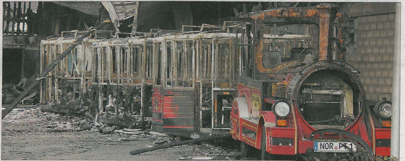
Opfer der Flammen wurde auch die vor allem bei den Inselgästen beliebte „Bimmelbahn“.

Durch die rasche Ausbreitung der alles vernichtenden Flammen kann eine Zerstörung der 600 Quadratmeter großen Halle jedoch nicht mehr verhindert werden. Die Dachkonstruktion stürzt