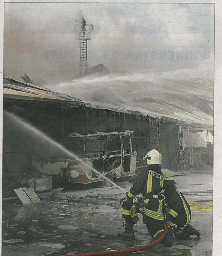
Die betroffene Lagerhalle brennt völlig aus. Ein Übergreifen der Flammen auf Nachbargebäude kann die Inselwehr verhindern.