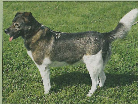
Tommys Herrchen ist verstorben. Nun sucht der freundliche Vierbeiner ein neues Zuhause.

Wer sich für Tommy interessiert, kann sich beim bmt-Tierheim Hage unter Telefon 04938/425 melden. Das Telefon ist täglich von 14.30 bis 17 Uhr besetzt. Weitere Infos finden sich im Internet auf www.tierheim-hage.de .