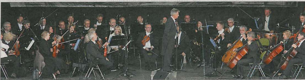
Das Warschauer Symphonie-Orchester eröffnete das Festival mit der „Classic Night“.

Während ein Großteil der Summertime-Veranstaltungen frei ist und jederzeit auch spontan besucht werden kann, sind die beiden Konzerte mit Nena und „Unheilig“ allerdings bereits ausverkauft.