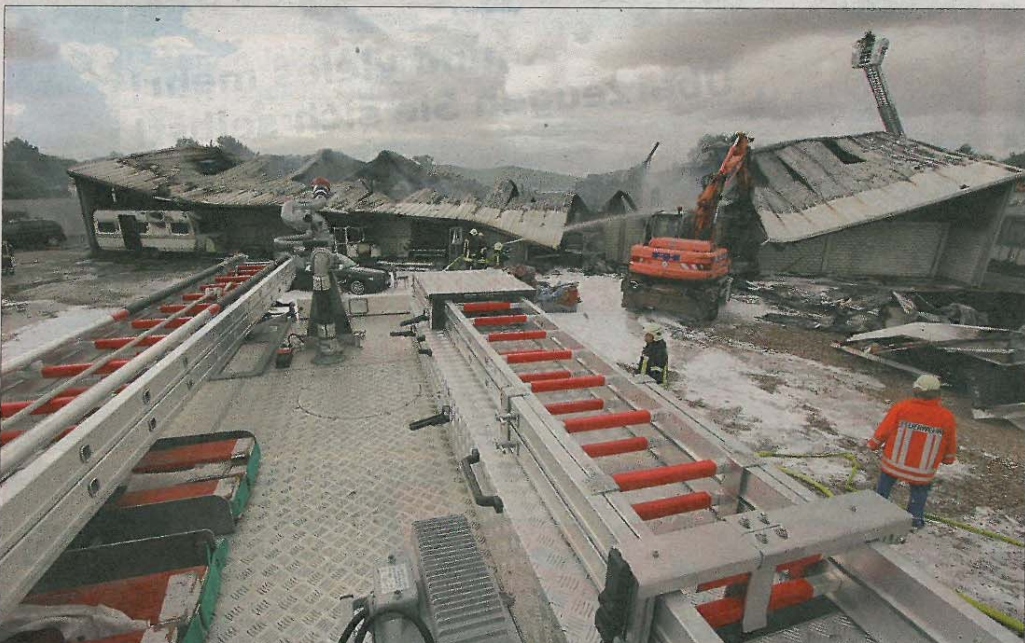
Nachdem die großen Flammen bekämpft waren, wurde die Halle mit einem Bagger geöffnet, um den Weg für die Nachlöscharbeiten frei zu machen.

Rolf Harms allen Einsatzkräften. „Die Feuerwehr hat durch ihren schnellen und professionellen Einsatz Schlimmeres verhindert“, betont auch er, wie wichtig die ehrenamtlichen Retter für die Insel sind.