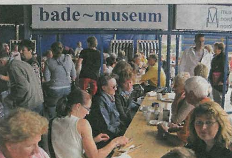
Das Museumsfest ist immer wieder ein beliebter Treffpunkt.

Selbst aktiv werden heißt es bei der Mitmachaktion, bei der die Besucher die Funktion von historischen Gegenständen aus dem Museum raten sollen. Neben dem Bücherflohmarkt gibt es auch in diesem Jahr wieder eine Tombola, zu der viele Norderneyer Unternehmen wertvolle Preise gestiftet haben.