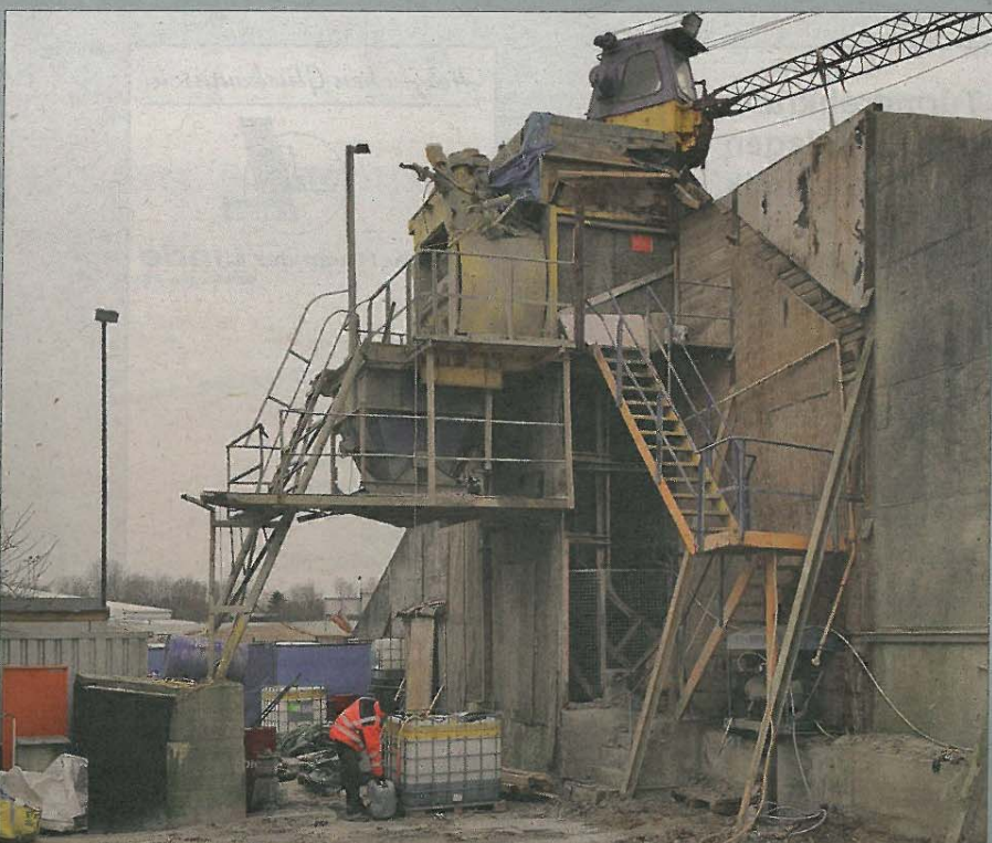
Die neue Beton-Mischanlage der Firma Elba ersetzt die beinahe schon museumsreife Anlage aus dem Jahr 1986.

INSULAR PROJEKTENTWICKLUNGSGESELLSCHAFT MBH & CO. KG EMSSTR. 8 | 26548 NORDERNEY