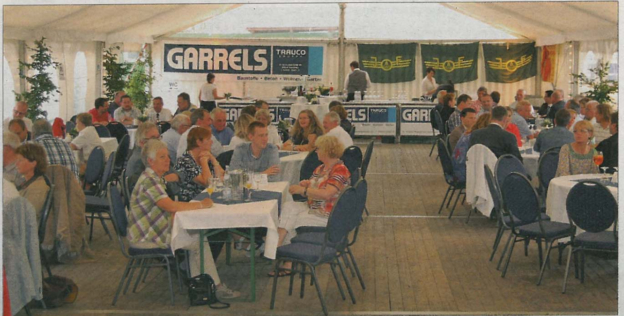
Die offizielle Inbetriebnahme der innovativen Beton-Mischanlage der Firma Norderney Beton feierten rund 100 Gäste diverser Bau- und Elektrofirmen, aus dem Kreis der Stadt und der Kirche sowie zahlreiche Mitglieder der Reederei Norden-Frisia.

Zum gelungenen Neubau der Beton-Mischanlage gratulieren wir unserem Nachbarn und wünschen einen guten Start und viel Erfolg!