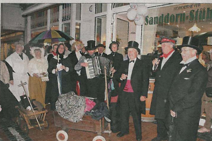
Die Spielschar des Norderneyer Heimatvereins zog in traditionellen Hochzeitskostümen durch die Straßen.

dass andere Geschäfte teils hohe Umsätze verbucht hätten, in dem sie ihre Läden zwar geöffnet haben, aber nicht bereit waren, die 80 Euro für die Teilnahme am Nachtbummel zu zahlen“, kritisierte der Einzelhandelsverbandsvorsitzende Harm und ergänzte, dass hier doch wohl die Solidarität entscheidend sei.