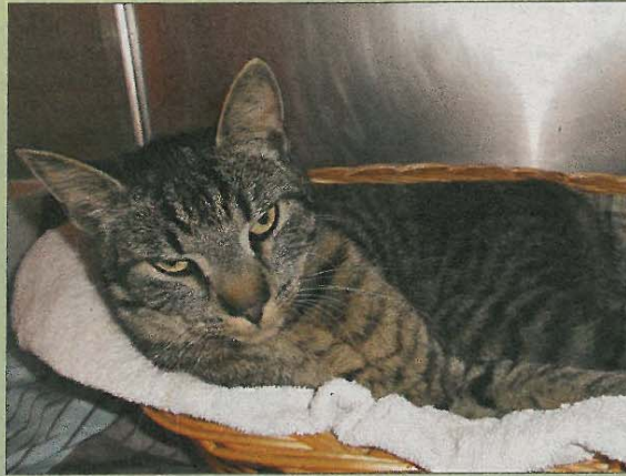
Der liebe Jakob sucht ein neues Zuhause.