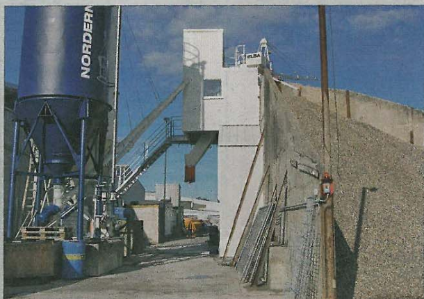
Der benötigte Zement wird aus den Silos mit einem Fassungsvermögen von je 60 Tonnen zugeführt.