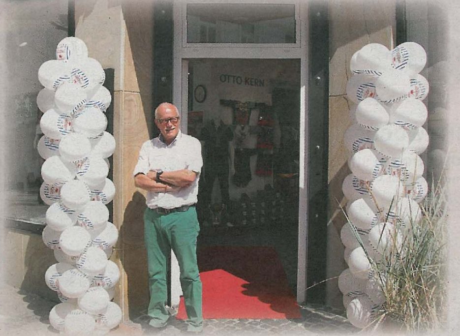
Zum nächsten Nachtbummel werden zur Vereinheitlichung der teilnehmenden Geschäfte die bei Norbert Harm bereits aufgestellten Luftballonsäulen angeboten, welche bei „Mr. Balloon“ erworben werden können.