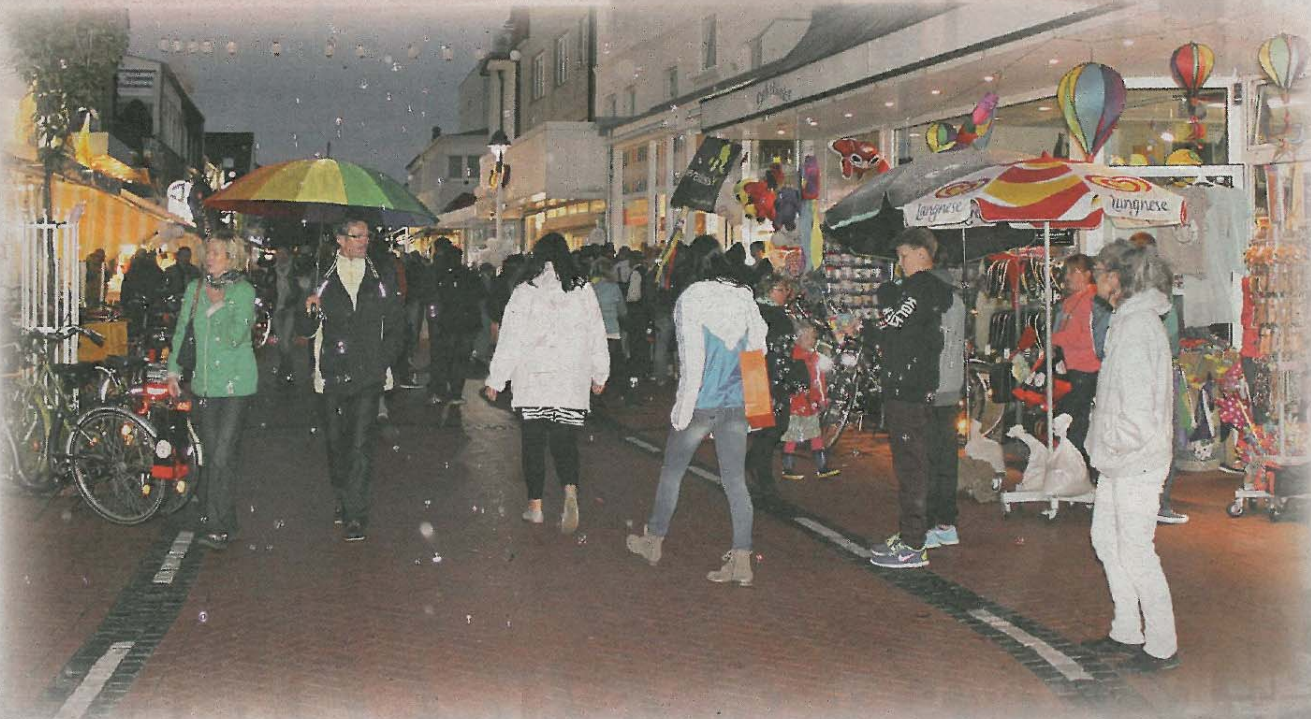
Trotz des Regens ließen sich die zahlreichen Besucher des Nachtbummels den bunten Abend in den Norderneyer Einkaufsstraßen nicht vermiesen.