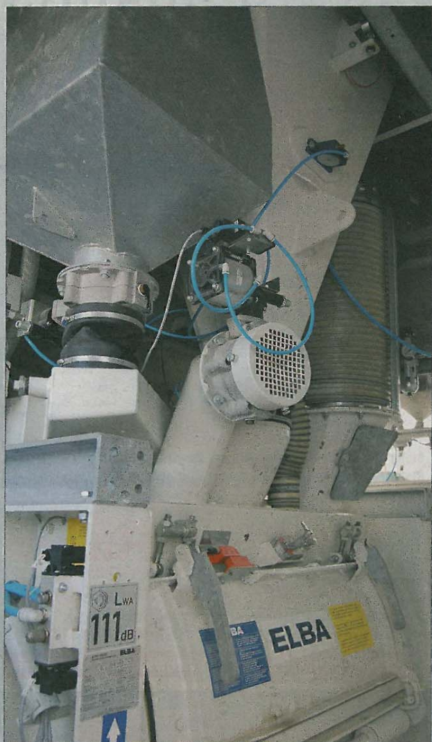
Der Halbkubikmeter-Mischer ist das Herz der Anlage. Hier entsteht der Beton auf höchstem Niveau.