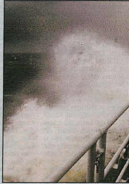
Ungezähmte Naturgewalten des Meeres