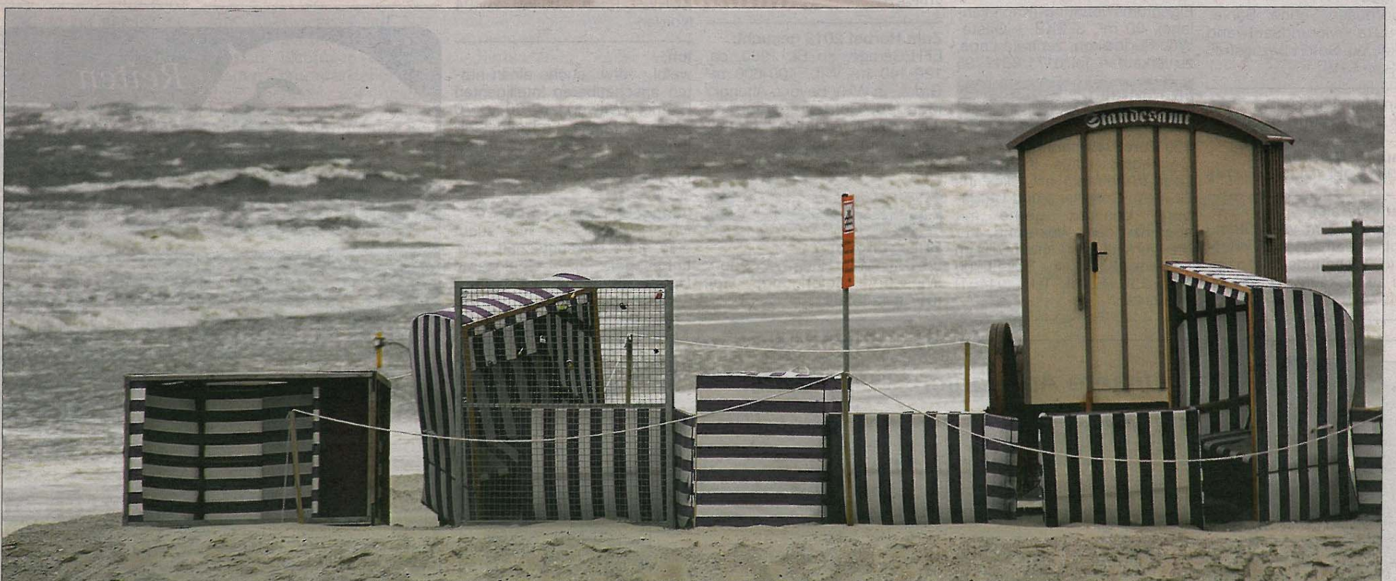
Kein Traumwetter für eine Traumhochzeit. Auch der Badekarren ist bei Regen und Sturm geschlossen. Doch es kommen sicher wieder bessere Zeiten.