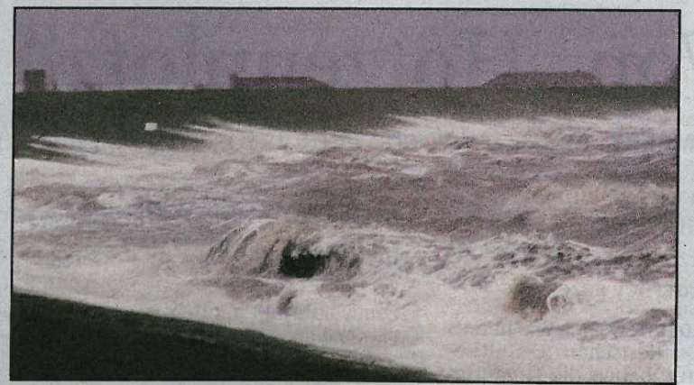
Sturmflut an der ostfriesischen Nordseeküste