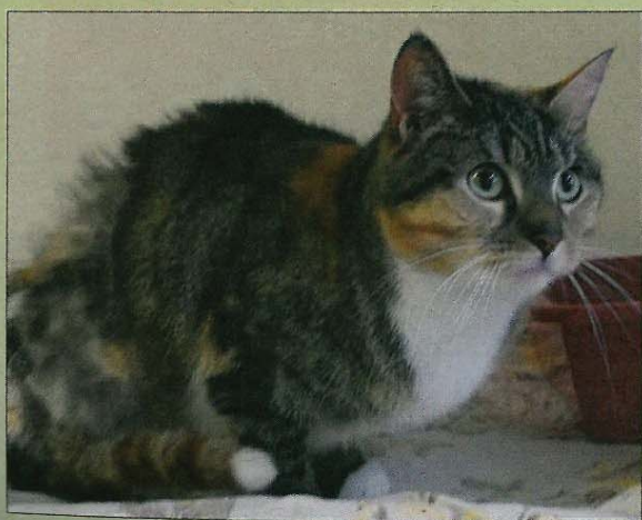
Casy freut sich auf ein ruhiges Zuhause.

Wer Casy ein Zuhause geben möchte, kann sich beim bmt-Tierheim Hage unter Telefon 04938/425 melden. Das Telefon ist täglich von 14.30 bis 17 Uhr besetzt. Weitere Infos finden sich im Internet auf www.tierheim-hage.de .