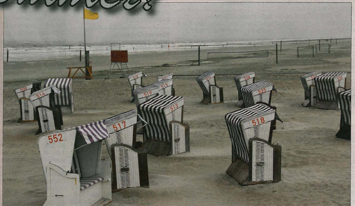
Während die Fluten schäumen und schlagen, herrscht am Strand eher Ebbe.