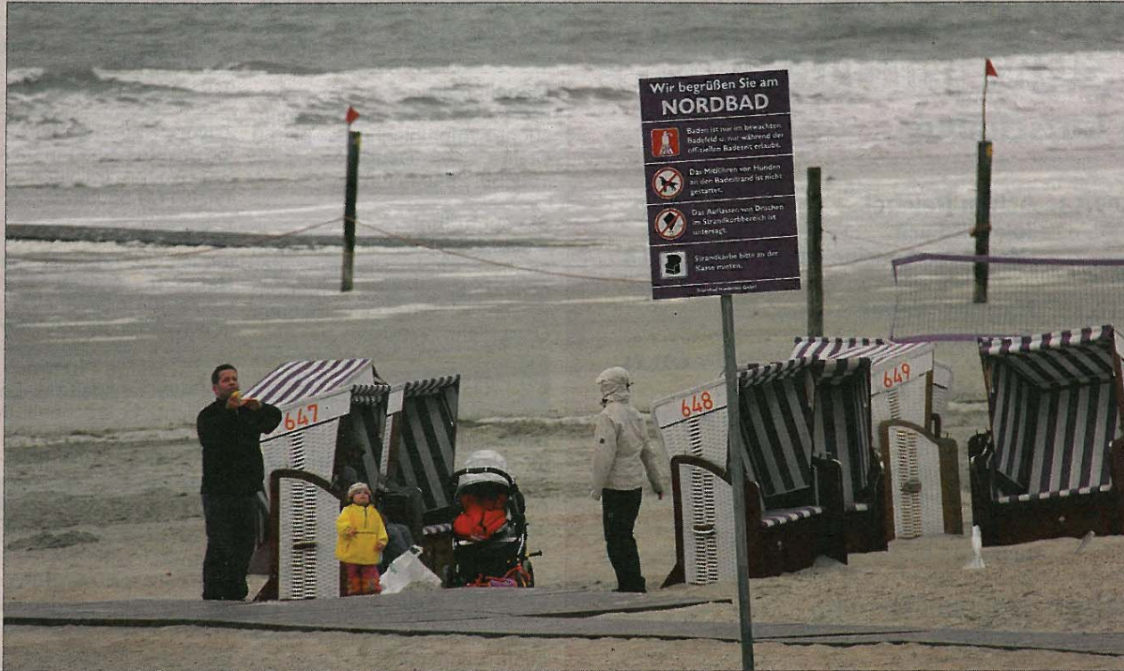
Die Familie hatte sich so auf Strandurlaub gefreut. Mit Regenjacken wurde das Wunschprogramm durchgezogen.