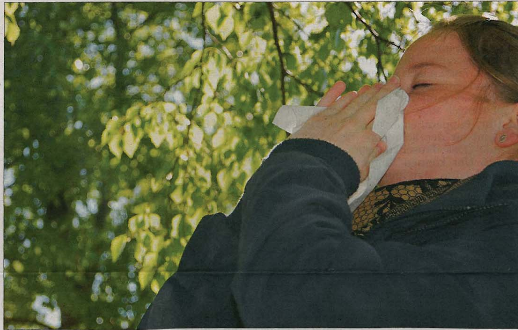
In diesen – oft regnerischen – Tagen ist der Pollenflug eher gering. Doch viele Blüten und Gräser haben ihre Hochzeit erst noch vor sich.

Die Symptome des Heuschnupfens sind recht weitläufig und können sich, werden sie nicht bekämpft, über Jahre hinweg verschlimmern. Ist dies der Fall, so geschieht es etappenweise, wie Wondratschek erläutert. Es fängt meist bei den Augen und