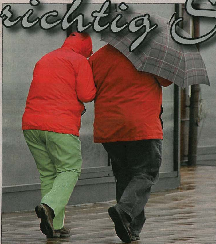
Typisch norddeutsches „Usselwetter“, aber die frische Luft tut trotzdem gut, man wird so richtig durchgelüftet...