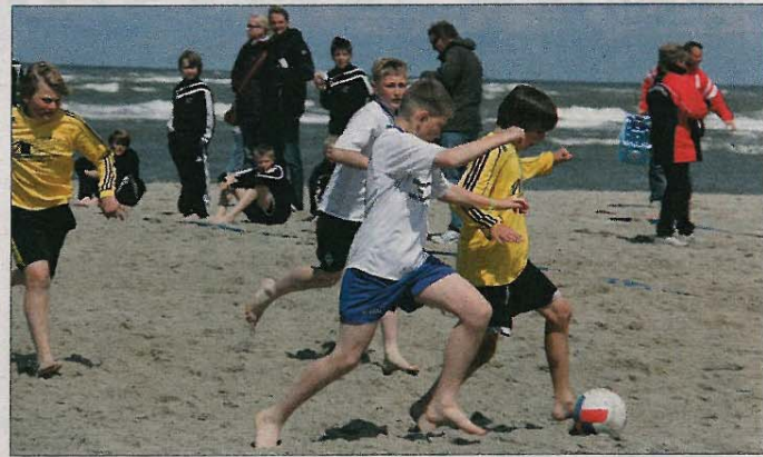
Der TuS Norderney richtet das Turnier diesmal nicht an der Weißen Düne, sondern am Nordstrandabschnitt „Detmold“ aus.

Bereits zum zweiten Mal in Folge ist der Deutsche Vizemeister und Champions-League-Finalist Borussia Dortmund offizieller Partner des Junior Fun-Cups. Der BVB wird wieder mit vielen Überraschungen am Sportplatz und am Strand aufwarten. Maskottchen „Emma“ und ein großer Funpark sind im