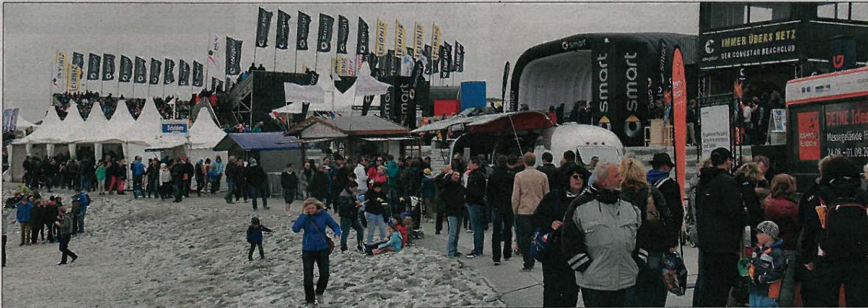
Zwischen Tribüne, Unterhaltungsbühne und Fressbuden konnten sich die Festivalbesucher tummeln.