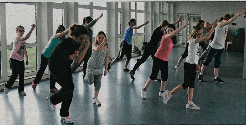
Hip-Hop-Kurs für Kinder und Jugendliche. Die Bewegungen helfen sowohl, unterdrückte Wut abzubauen als auch beim Entspannen.

Auf der Insel werden Kurse für Hip-Hop und Latin-Dance-Fitness unter Leitung der Tanzlehrerin Yasemin Konakci seit September von der Nordsee-Oase des Thalasso Hotels angeboten. Weitere Informationen gibt es unter Telefon 04932/881550.