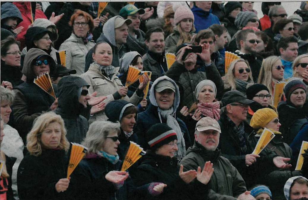
Dass das Anfeuern der Sportler in diesem Jahr mit Jacke, Mütze und Schal vonstatten gehen musste, schien die Stimmung der Zuschauer nicht nachhaltig zu trüben.