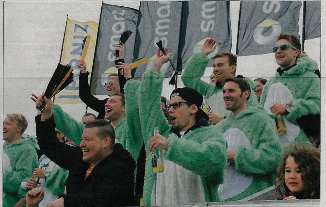
Ob diese flauschigen Ganzkörperanzüge vorsorglich als Mittel gegen die kühlen Temperaturen mitgebracht wurden? Wohl eher nicht...