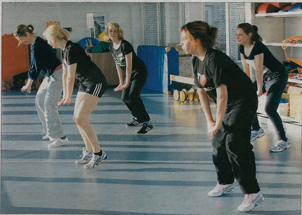
Diesmal ist die Gruppe beim Latin-Dance-Fitness nur sehr klein. Je mehr Rhythmusbegeisterte sich jedoch der Choreografie der Kursleiterin anschließen, desto mehr Spaß bringt es.

Manche Schrittfolge klappt am Anfang noch nicht so gut, der Hüftschwung geht vielleicht noch nicht ganz ungehemmt vonstatten und wer nicht vier Minuten am Stück hüpfen möchte, kann es zuerst auch etwas schonender angehen. Jeder Teilnehmer kann seinen körperlichen Einsatz selbst dosieren und langsam steigern. Das ist sicher einer der Gründe, warum dieses Fitnessprogramm – andernorts unter dem registrierten Warenzeichen „Zumba Fitness“ angeboten – mittlerweile in der gesamten Bundesrepublik von Jung und Alt immer stärker