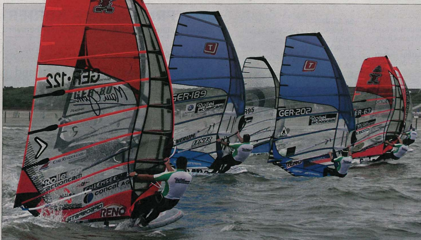
Mit verschärften Bedingungen mussten die Surfer beim 16. White Sands Festival klarkommen.