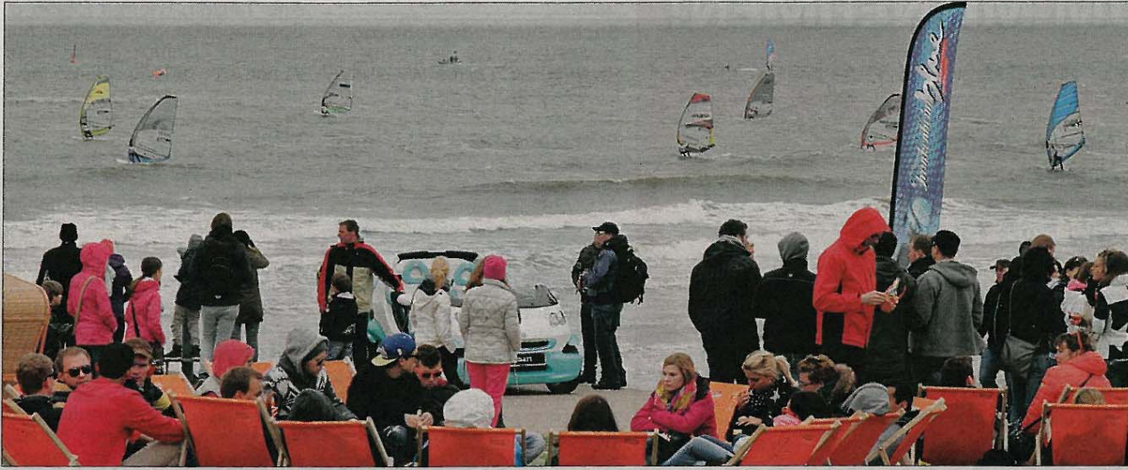
Beach-Feeling ohne Sonnenschein? Die Norderneyer Surffans lassen sich die Laune nicht vermiesen.