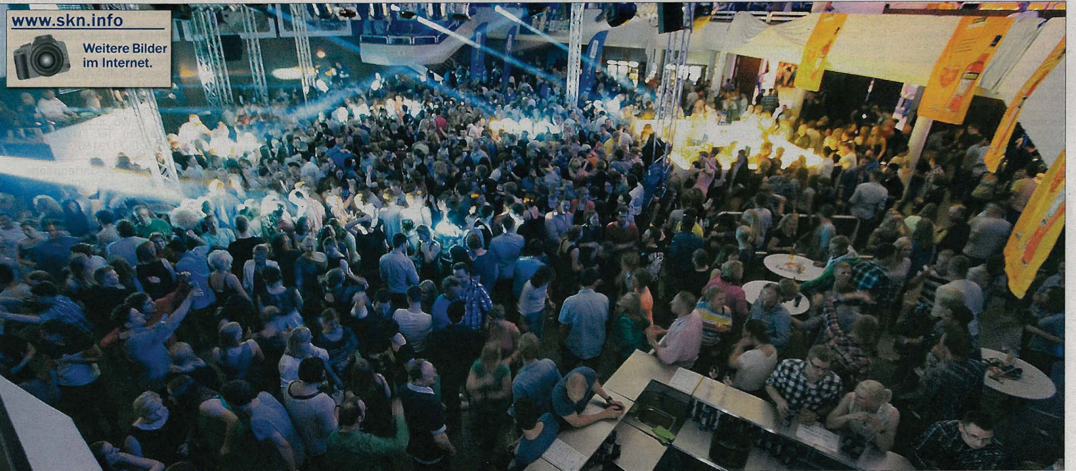
Party im Haus der Insel. Eingetaucht in buntes Scheinwerferlicht, rockten am Sonnabend und Sonntag jeweils 1600 Gäste den Dancefloor.