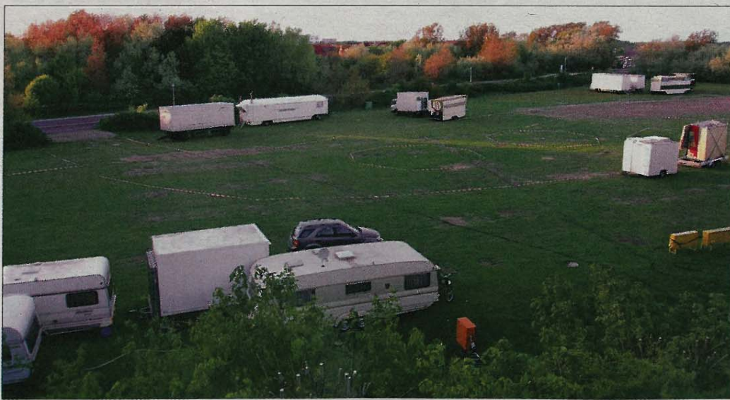
Die Inselkirmes auf der Bürgermeisterwiese findet in diesem Jahr schon Anfang Juni statt. Die ersten Schausteller sind bereits angereist, um die Gaudi aufzubauen.