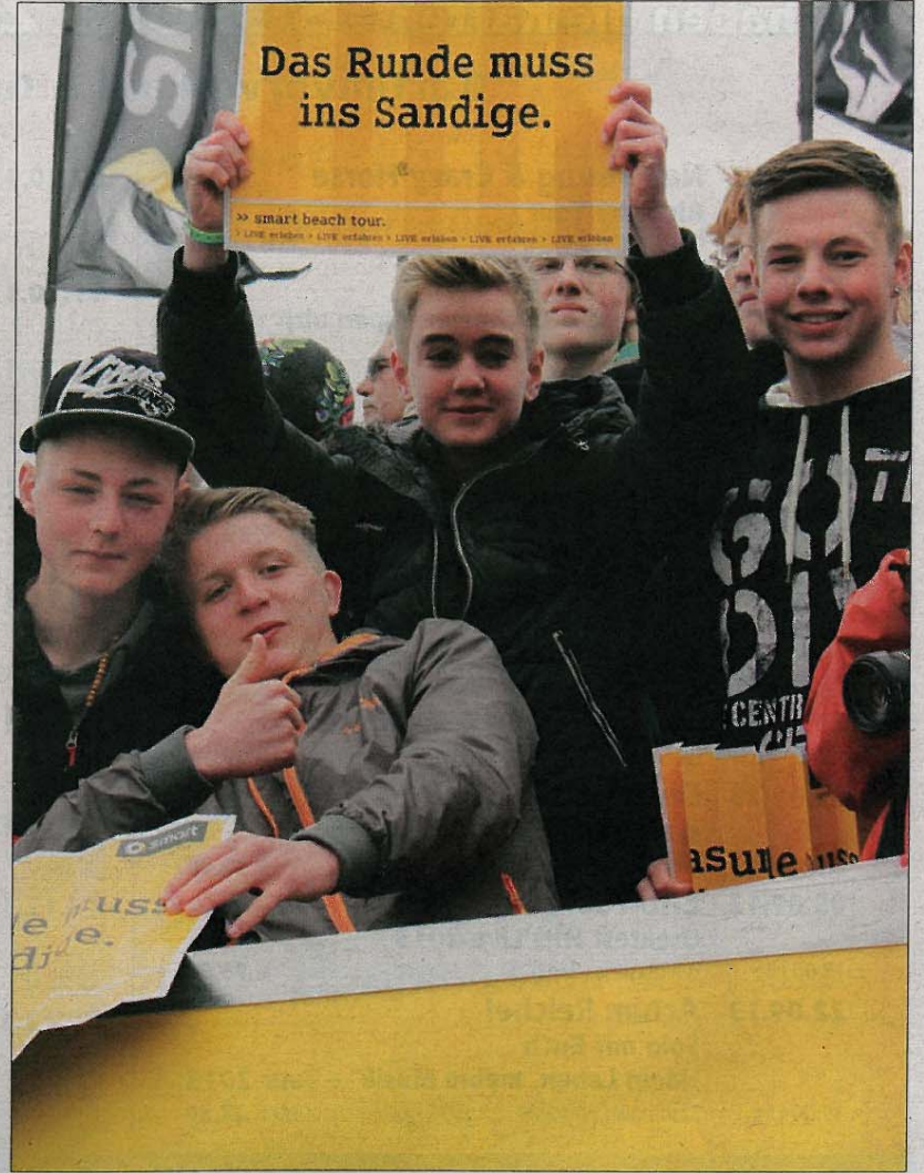
...und der Daumen in die Höhe!