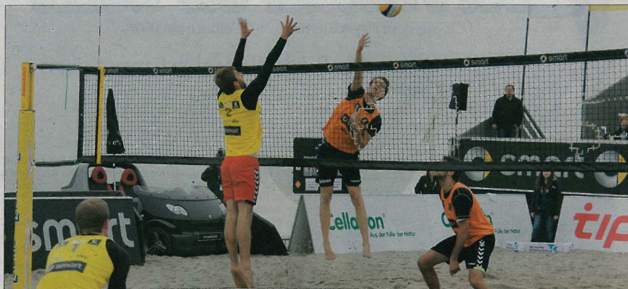
Die Volleyball-Herren lieferten sich ebenso spannende Wettkämpfe im Sand wie die Damen.