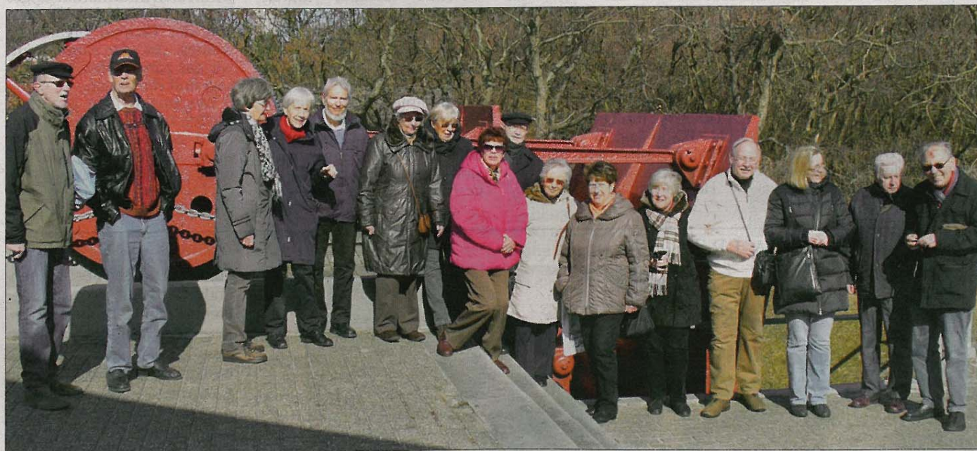
Die ehemaligen Schulkameraden mit Anhang vor der alten Wellenmaschine am Bademuseum.

Sonnabendvormittags folgte ein Besuch des Bademuseums. Mit