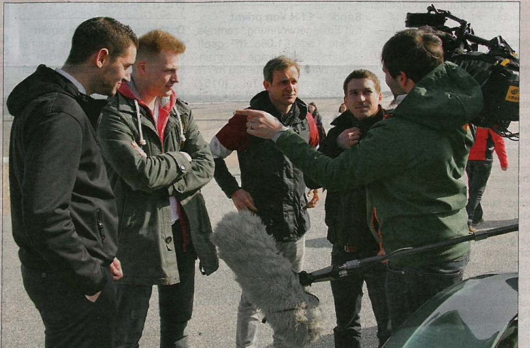
Auch bei der Versteigerung der Testwagen hat das „Grip“-Team natürlich seine Kameras immer geschultert. Manch ein Norderneyer Gesicht wird bald auf heimischen Bildschirmen auftauchen.