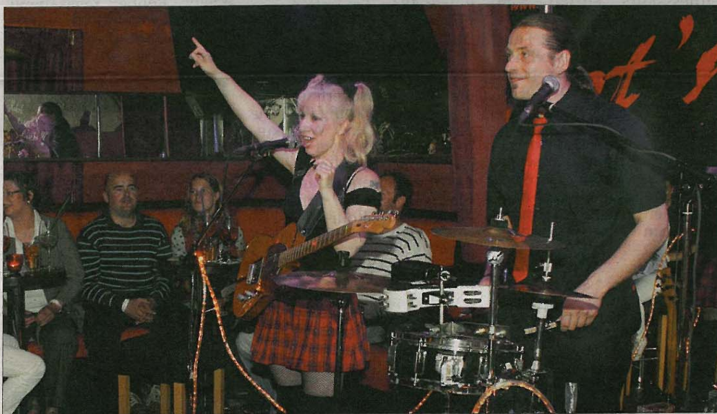
Handgemachte Livemusik und das gleich in neun Kneipen an einem Abend – das „König Pilsener Music Special“ lässt sich kaum ein Musikfan entgehen.

Das „König Pilsener Music Special“ lässt sich kaum ein Musikfan entgehen.