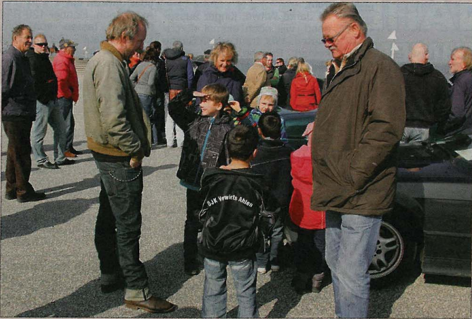
Auch die ganz kleinen Autofans lassen es sich nicht nehmen, mit Fahrzeugprofi und Moderator Helge Thomsen ins fachkundige Gespräch zu kommen...