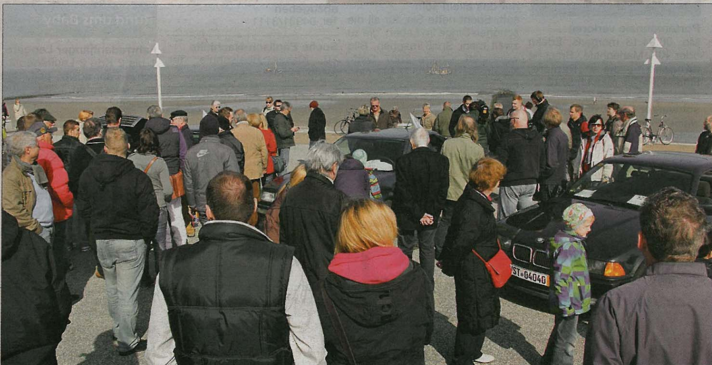
Volles Haus am Strand: Drei Testfahrzeuge des Fernsenteams von „Grip“ stehen zum Verkauf.