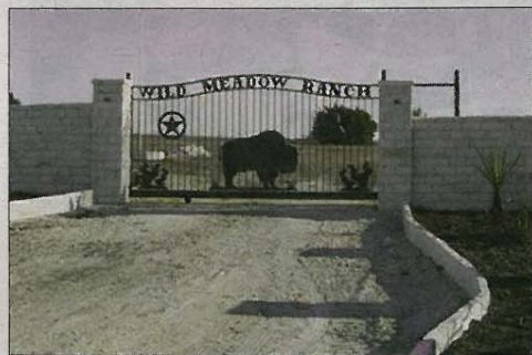
Impressionen des Butennorderneers: Einfahrtstor zu Müllers Ranch in Texas.

Alles in allem war das Klassentreffen eine gelungene Veranstaltung, die alle Teilnehmer etwas wehmütig, aber mit gestärkter Seele und erwärmtem Herzen ungern verließen.