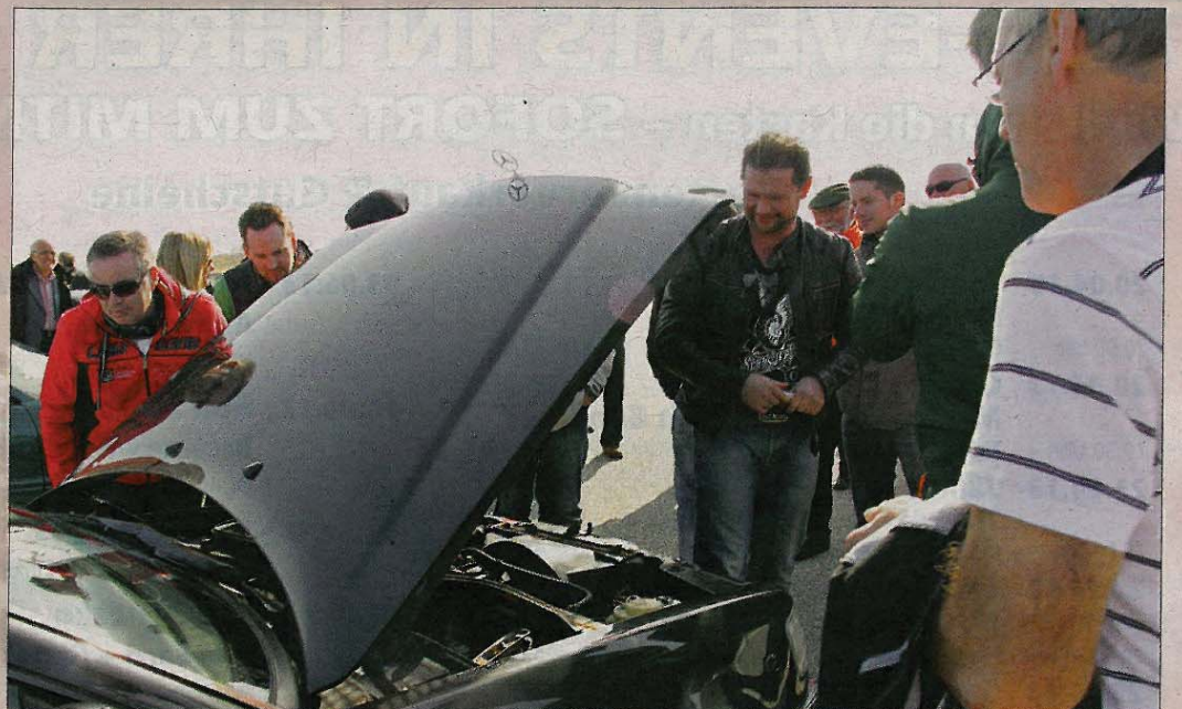
Ein Blick unter die Motorhaube des Mercedes 230 CE lohnt sich. Immerhin soll das gute Stück Anfang Mai im Fernsehen zu sehen sein.