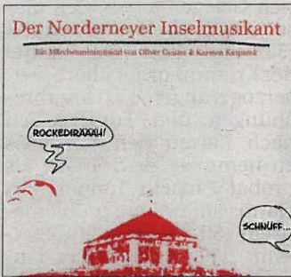
Die Marienhöhe ziert das Cover der Musical-CD.

Die Zuhörer begleiten das Goldkehlchen Goldie auf einem langen Irrflug von Münster über Bremen nach Norderney. Zwischendurch hat der Vogel einige Begegnungen: mit den Bremer Stadtmusikanten, einem Jazzfrosch oder einem Mozartkugelfisch. Auf Norderney angelangt, muss sich Goldie gegen diese Möwen behaupten.