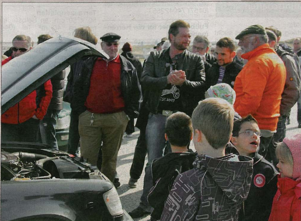
Dichtes Gedränge um den sportlichen Benz nach seiner Testfahrt auf dem Norderneyer Flughafen. Gibt es auch Fans für die anderen beiden Fernseh-Autos?