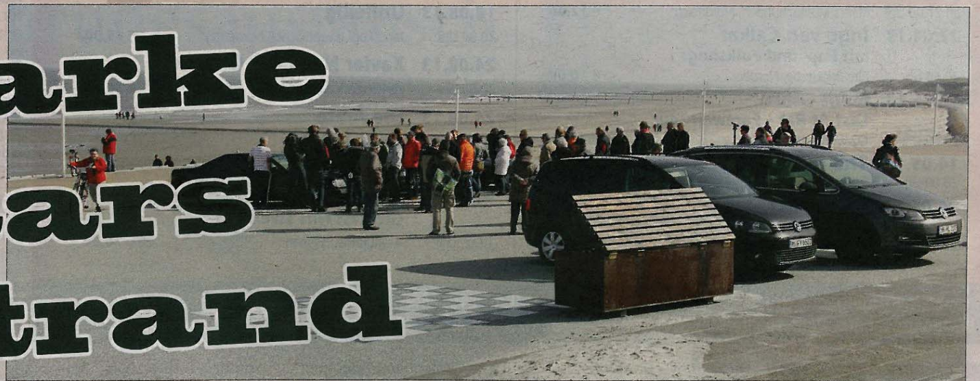
Schon von Weitem ließ sich am Mittwoch erkennen, dass am Surfcafé etwas Besonderes los sein musste.