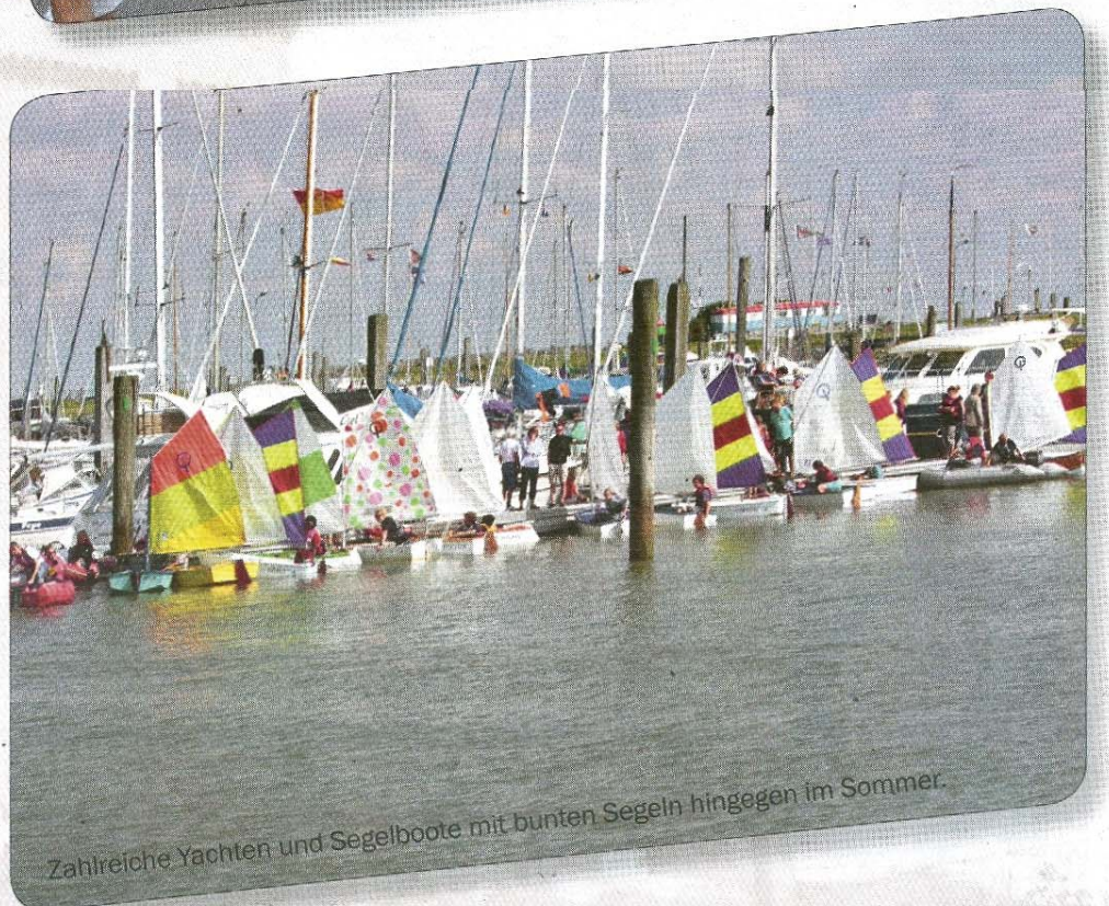
Zahlreiche Yachten und Segelboote mit bunten Segeln hingegen im Sommer.