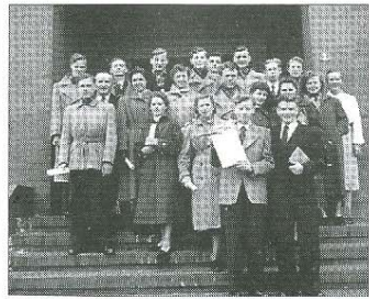
Die Abschlussklasse 10 b.