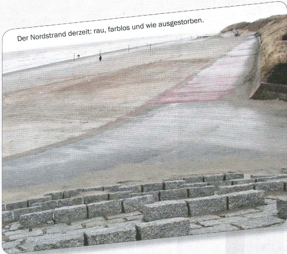
Der Nordstrand derzeit: rau, farblos und wie ausgestorben.