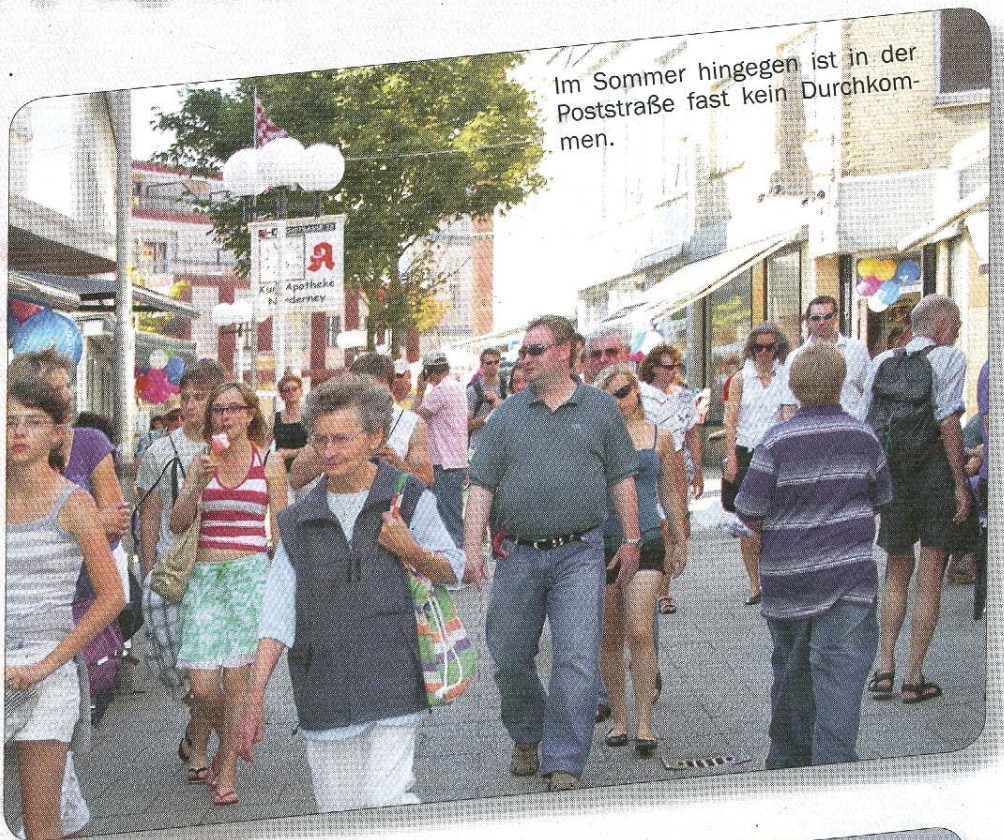
Im Sommer hingegen ist in der Poststraße fast kein Durchkommen.