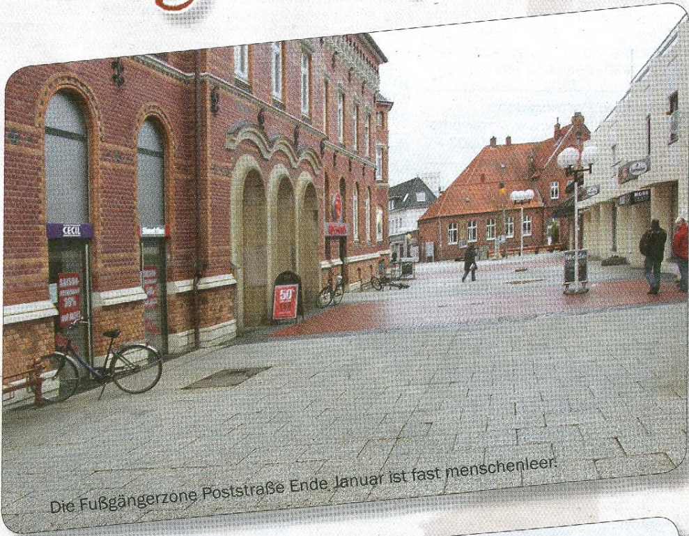
Die Fußgängerzone Poststraße Ende Januar ist fast menschenleer.