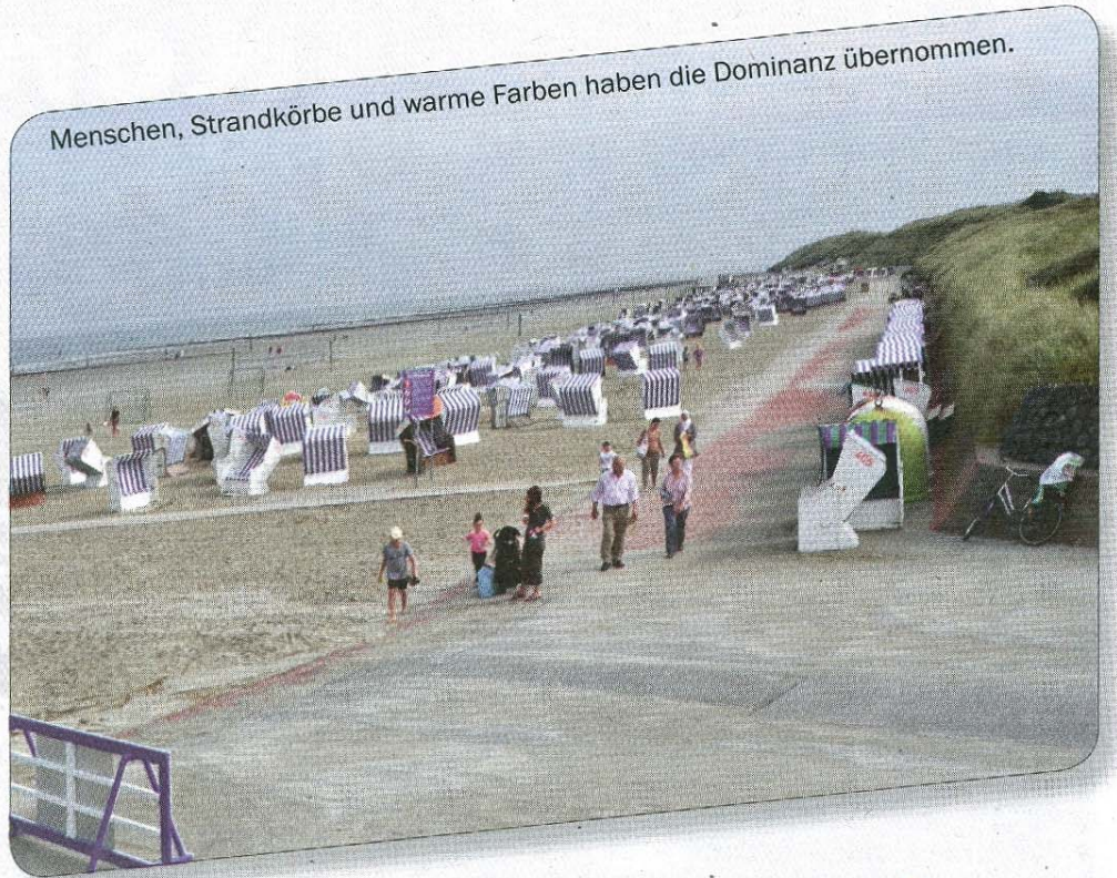
Menschen, Strandkörbe und warme Farben haben die Dominanz übernommen.