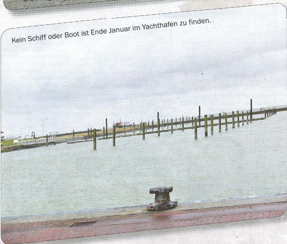
Kein Schiff oder Boot ist Ende Januar im Yachthafen zu finden.