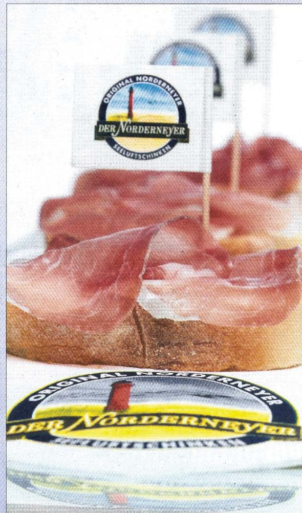
Lecker auf frischem Brot: der echte Norderneyer Schinken.

Das Unternehmen legt Wert darauf, auf der Insel zu produzieren – trotz des logistischen Mehraufwands, betonte Sauels. So wird der Schinken auch nicht unter anderem Namen verkauft und ist ein echter Insulaner.