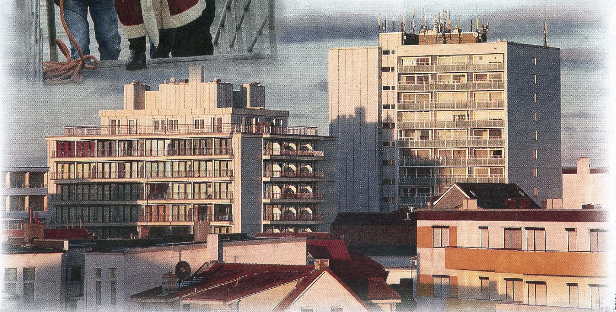
Spezielle Ansichten einer sonnigen Insel.