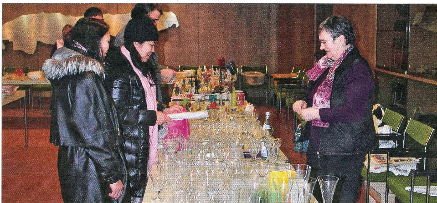
Die Awo bietet auch Haushaltsartikel jeglicher Art an.

Jedoch ist es nicht so, dass die Arbeiterwohlfahrt alle Hilfen und Aktionen für Jung und Alt mal „eben so“ schultern kann. Vielmehr sind es besonders die freiwilligen Helfer und Awo-Mitglieder, die mit ihren Tätigkeiten einen nicht geringen Teil der finanziellen Mittel selbst erwirtschaften. Mit viel Engagement werden vor den Oster- und Weihnachtsfeiertagen Basare ver-