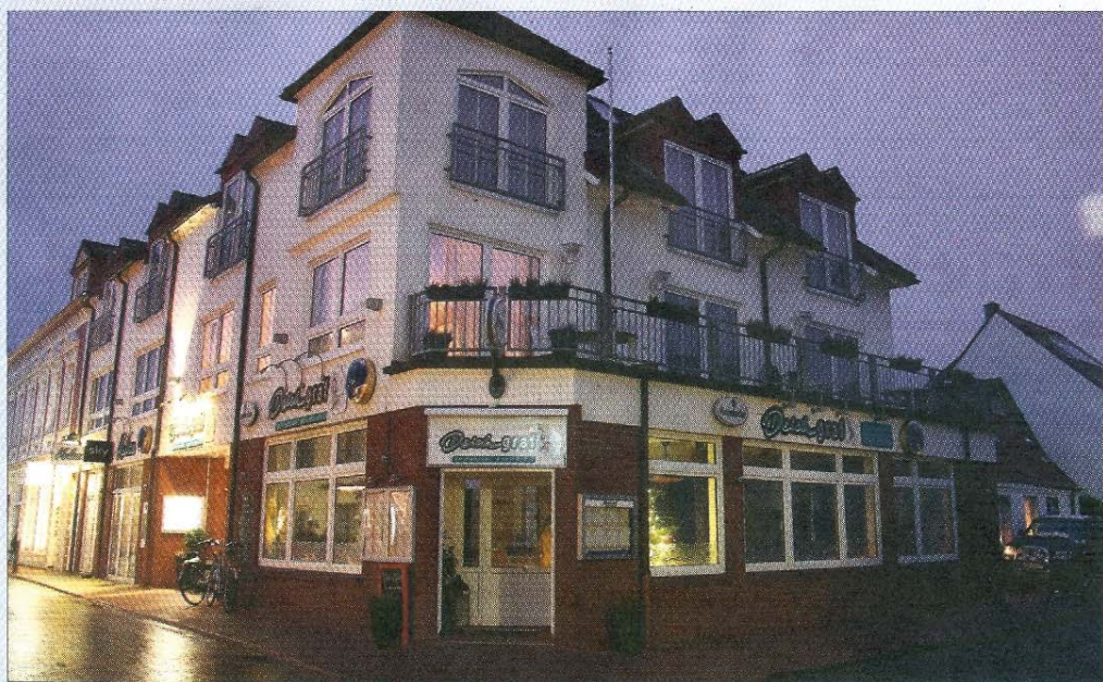
Seit Juni befindet sich das Aparthotel Zum Deichgraf in der Langestraße/Ecke Herrenpfad unter der Leitung von Diana und Kai Kron.