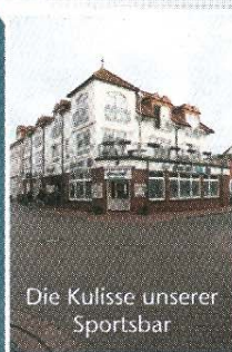
Die Kulisse unserer Sportsbar