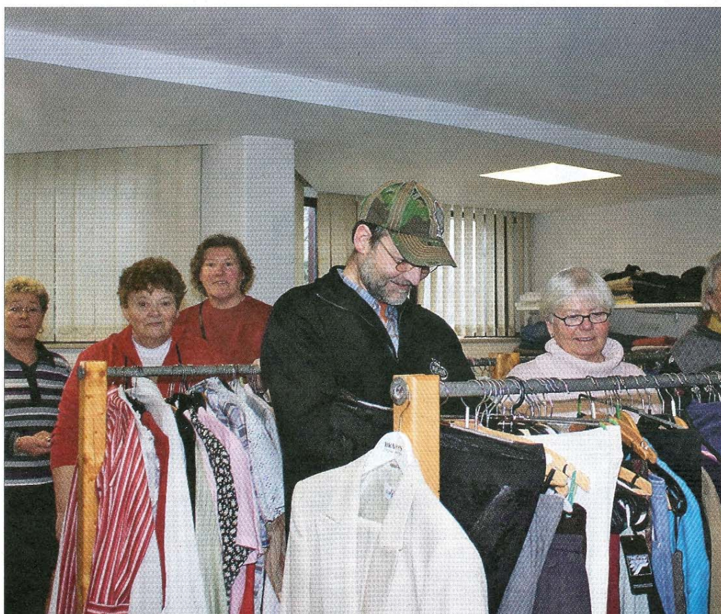
Starke Institution der Awo: die Kleiderkammer.