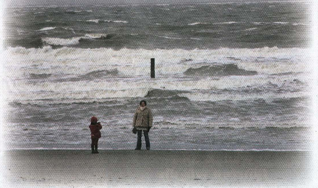
Rauschende See vor dem rauschenden Fest.