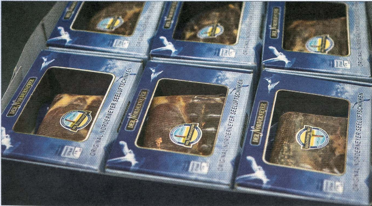
Der Norderneyer Schinken ist im kommenden Jahr in maritim-blauer Verpackung bei Aldi Süd erhältlich. Der Discounter hat 25 Tonnen der Insel-Spezialität geordert.

ARCHITEKTUR- + INGENIEURBÜRO HANS-GÜNTHER RABE • ARCHITEKT, DIPL.-ING., BDB BAUMSTRASSE 5, 26506 NORDEN, TELEFON 0 49 31 / 1 20 24