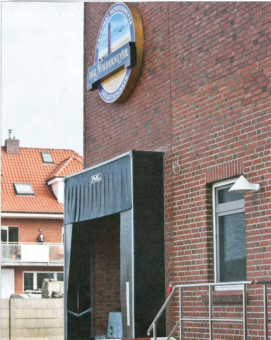
An der Wand der Produktionsstätte prangt weithin sichtbar das Logo mit dem roten Norderneyer Leuchtturm.

Norderneyer Schinken GmbH & Co. KG Im Gewerbegebiet 47 - 26548 Norderney - Telefon (0 49 32) 99 10 80 Internet: www.derNorderneyer.de