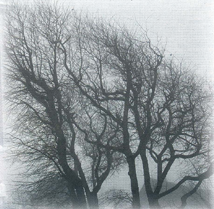
Herbstliches Nebel-Geäst wie ein Gestrüpp aus Adern und feinsten Kapillaren.