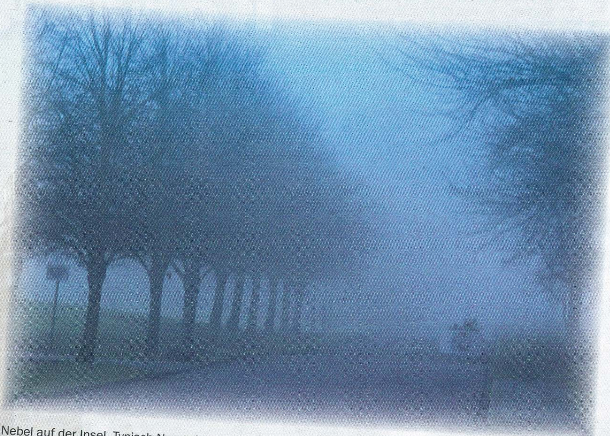
Nebel auf der Insel. Typisch November.