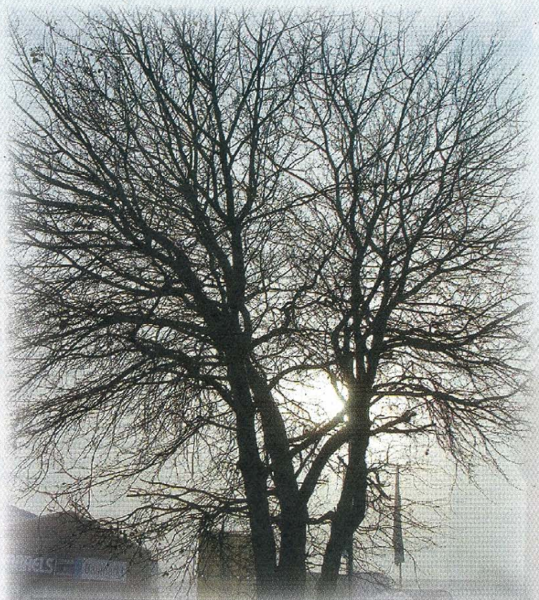
Kommt sie durch – oder kommt sie nicht durch?