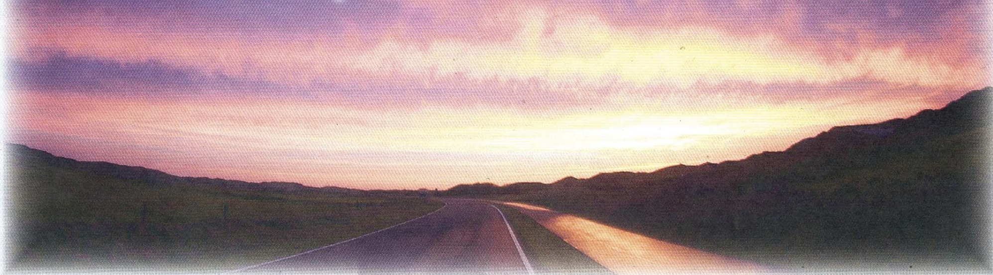
Die Straße in den Osten. Lichtspiele eines Herbstmorgens.