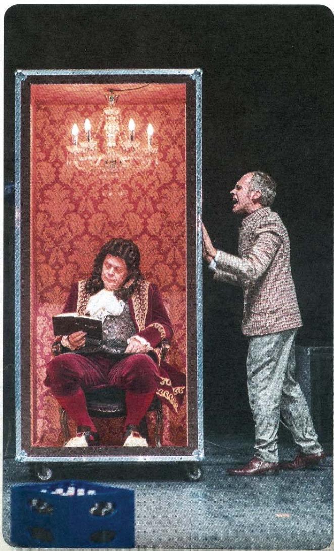
Tipp der Woche: Die Landesbühne Niedersachsen Nord präsentiert am Donnerstag, 5. Dezember, um 19.30 Uhr das Theaterstück „Die Räuber“, in der zwei ungleiche Brüder um die Gunst des Vaters kämpfen. Der Eintrittspreis liegt zwischen 18 und 22 Euro.

Gesamtherstellung: Ostfriesischer KURIER GmbH & Co. KG Stellmacherstraße 14, 26506 Norden. Geschäftsführer: Christian Basse Redaktion: Manfred Messen Manfred Reuter Thomas Fastenau Anzeigen: Dorothea Christians Ludwig Freeseemann Vertrieb: Benjamin Oldewurtel Horst Kaprolat Druck: Industriedruck Norden, GmbH & Co. KG Für unverlangt eingesandte Manuskripte und Fotos wird keine Gewähr übernommen. Telefon: siehe Seite 1 Erscheinungsweise: einmal wöchentlich. Verteilung: kostenlos an alle Haushalte und an mehr als 40 Auslegestellen Auflage: 5000 Exemplare