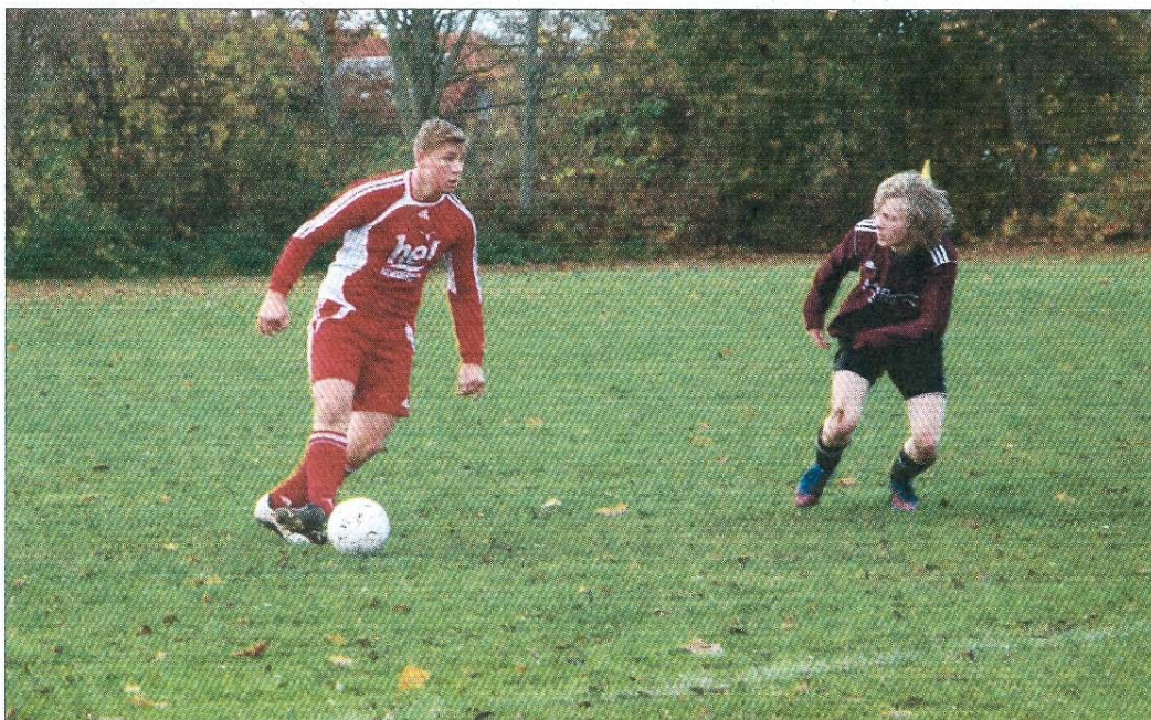
In der zweiten Halbzeit machten die Norderneyer mehr Druck.

In der Halbzeitpause wurden dann einige grundsätzliche Selbstverständlichkeiten noch einmal den Spielern nahegebracht und mit einer Mannschaftsumstellung für den nötigen Druck im