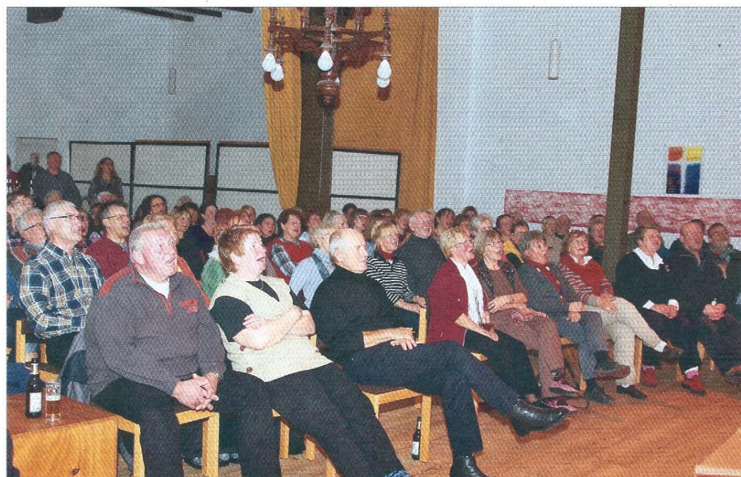
Nicht nur die Musik von Paul O'Brien begeisterte die rund 130 Konzertgäste, sondern auch der Humor des Künstlers.

tet. Obwohl sicher nicht jeder Gast im Saal einwandfrei die englische Sprache beherrschte, schaffte es der sympathische Sänger mit Händen und Füßen und dem ein oder anderen eingeflochtenen deutschen Wort, dass schließlich alle die Geschichten und ihre Pointen verstanden und so wurde an diesem Abend im Publikum nicht nur kräftig mitgesungen, sondern auch herzlich gelacht.