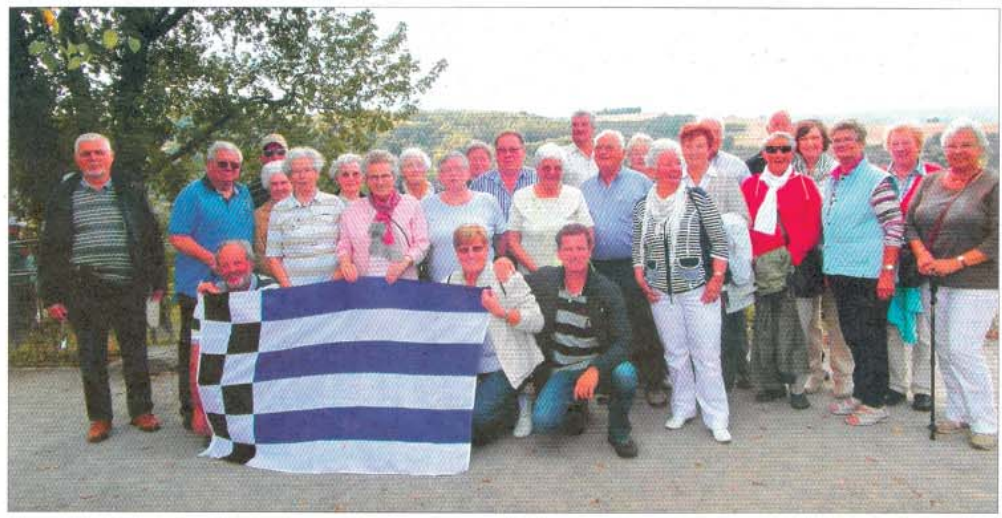
Die Reisegruppe aus Norderney auf der Loreley.

NORDERNEY - Es ist eine angenehme Art zu reisen, wenn man nicht jeden Tag die Koffer packen muss, um verschiedene Orte zu besuchen. Das Hotel, Restaurant und die Bar reisen sozusagen mit. Die Anreise erfolgte zunächst mit dem Bus bis nach Köln. Nach einer Stadtrundfahrt checkten wir auf dem Flusskreuzfahrtschiff „TC Bellevue“ ein. Dies ist ein sogenannter Twin-Cruiser, wo die Antriebseinheit vom Fahrgastschiff getrennt ist, sodass kaum Fahrgeräusche und Vibration entstehen. Bei Koblenz verließen wir den Rhein und setzten unsere Reise auf der Mosel fort. In Cochem, mit der über der Stadt thronenden restaurierten Reichsburg, hatten wir genügend Zeit, um uns die historische Stadt mit dem barocken Rathaus und blumengeschmückten Fachwerkhäusern näher anzuschauen. Einige der Gruppe sind mit der Sesselbahn zum Aussichtspunkt „Pinner Kreuz“ hochgefahren, um noch einen besseren Blick auf die Stadt und das Umland zu werfen. Nachmittags unternahm wir einen Ausflug ins Hinter-