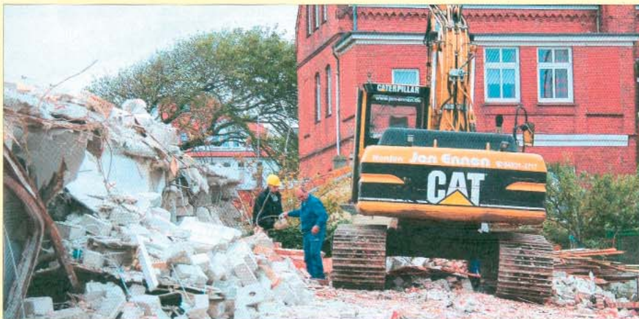
Im Winter rollen auf Norderney die Bagger.