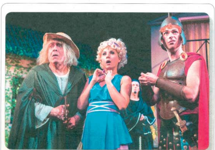
Tipps der Woche: Die Landesbühne Niedersachsen Nord präsentiert am Donnerstag, 25. Oktober, um 19.30 Uhr im Kurtheater das Stück „Toll trieben es die alten Römer“. Der Eintrittspreis liegt zwischen 18 und 25 Euro. Die Eintrittskarten sind an der Tourist-Information im Conversationshaus erhältlich.

10 Uhr, Badehaus: Tai Chi Wudang Style. Kosten: acht Euro. 11 Uhr, Teehaus: Führung durch das Fischerhaus-Museum mit Erklärung über die Lebensweise und Wohnkultur der Norderneyer Vorfahren. Der Eintritt beträgt drei Euro. 11.30 Uhr, Badehaus, Eingang Praxis Rass: Thalasso-Therapie. Täglicher Einstieg ist möglich. Anmeldung: Telefon 04932/891356. Kosten: fünf Euro. 15 Uhr, Haus der Insel: Büchcherbasar.