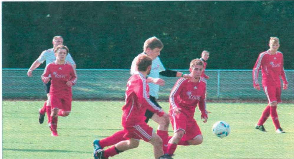
Im Spiel gegen Greetsiel wurde es in der Schlussphase hektisch.

FUßBALL TuS Norderney siegt 2:1 und bleibt ungefährdet Tabellenführer