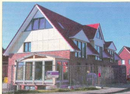
Eine moderne Bauweise prägt seit vielen Jahren bereits den Stil der Insel.