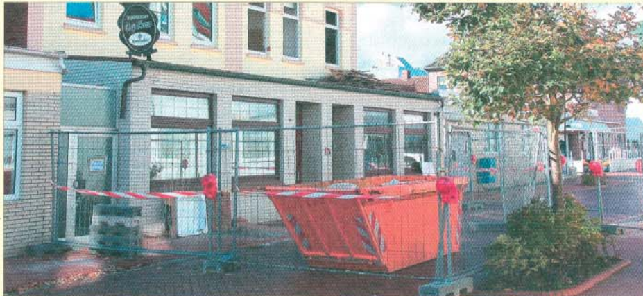
Bauzäune und Container sind zurzeit keine Seltenheit auf Norderney.