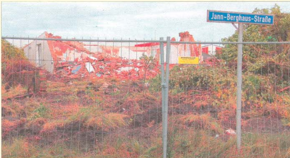
Das Eckhaus zur Bürgermeister-Willi-Lührs-Straße ist abgerissen. Dort entsteht ein Netto-Markt.