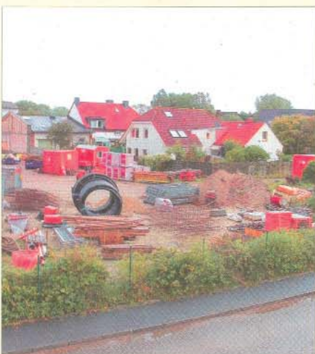
Eindeutig: Die Bausaison hat begonnen.