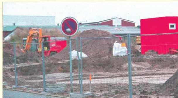
Jetzt heißt es nur noch, auf gutes Bauwetter zu hoffen.