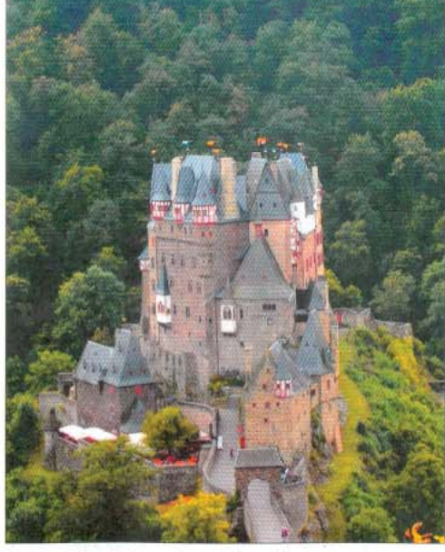
Die Burg Eitz: ein besonderes Reiseerlebnis.

Vom 132 Meter hohen Aussichtspunkt hatten wir einen sagenhaften Ausblick auf die Umgebung. Während eines Busausfluges fuhren wir parallel mit unserem Schiff den Rhein entlang bis zur Marksburg, die wir besichtigten. Bevor wir in Koblenz wieder an Bord gingen, haben wir noch kurz beim Deutschen Eck vorbeigeschaut, wo die Mosel in den Rhein mündet. Das letzte Teilstück brachte uns dann wieder zurück nach Köln, wo es Abschiednehmen hieß mit vielen Erlebnissen und Eindrücken, die sicher noch lange in Erinnerung bleiben werden. Nun können sich die Gruppenteilnehmer auf den Abschlussabend am Freitag, 26. Oktober, freuen, wo alle nochmals zusammenkommen, um über die Reiseerlebnisse zu plaudern und den Reise-Videofilm gemeinsam anzuschauen.