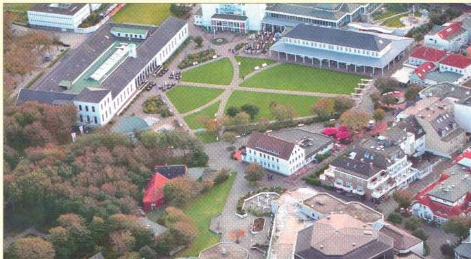
Das Luftbild hat bereits historischen Wert: In der unteren Mitte links vor den Bäumen ist das Carls-Haus zu sehen, das jetzt abgerissen wurde.