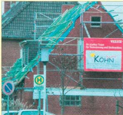
Wärmedämmung und Dachisolierung.