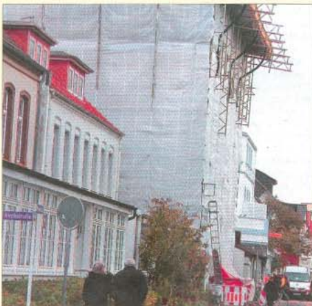
Eine der spektakulärsten Baustellen zurzeit auf Norderney: der Luisenhof.