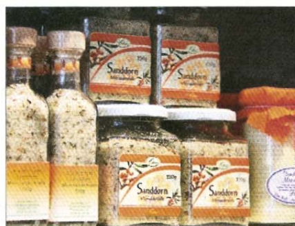
...besitzt die Farbe...