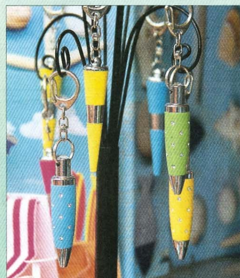
...sowie besondere und wertvolle...