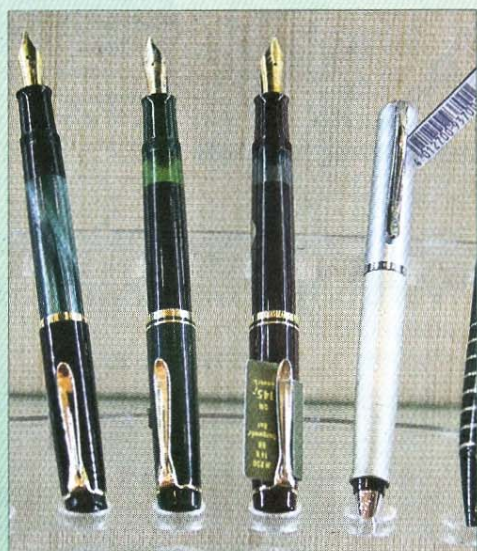
...Schreibgeräte gibt es bei Luttmann.