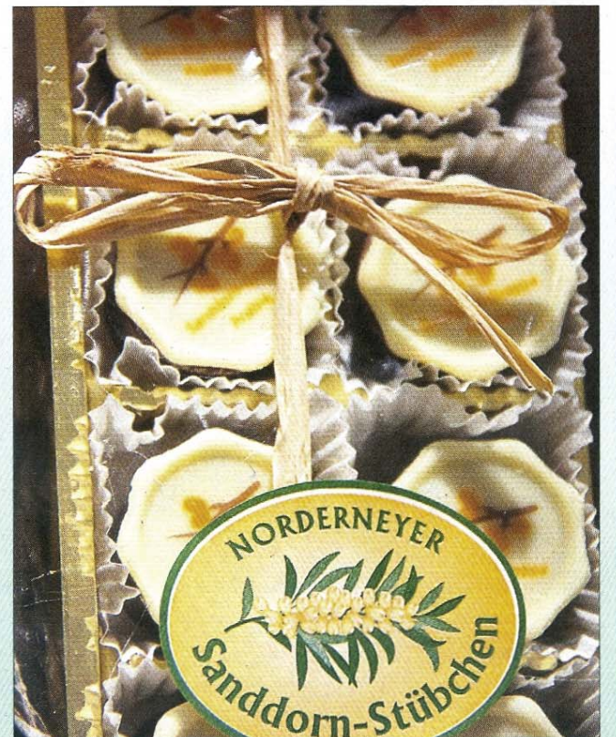
Mit viel Liebe zum Detail sind die Waren im Norderneyer Sanddorn-Stübchen ausgestellt.