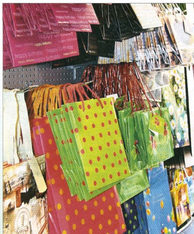
...und farbefrohe Ware...