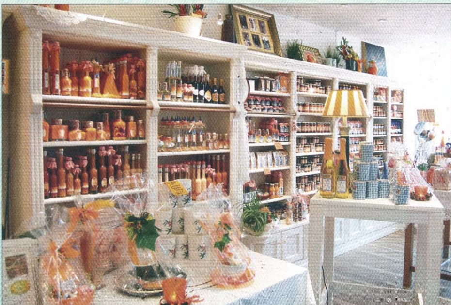
Im Sanddorn-Stübchen lässt sich prächtig einkaufen.

Zum gelungenen Neubau gratuliert das Götting-Team!