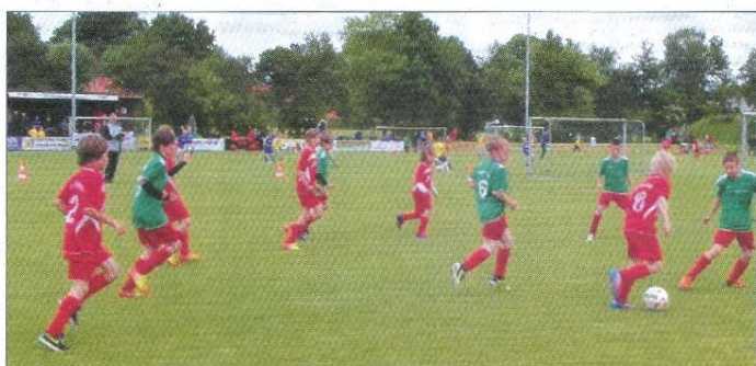
Am Sonnabend kann die E-I-Jugend den Sack zumachen. Um 11 Uhr kommen die Moordorfer zum Rückspiel auf die Insel.

Die E-Jugendlichen des TuS Norderney haben aber noch die Möglichkeit, im Heimspiel, wiederum gegen Moordorf, am kommenden Sonnabend um 11 Uhr mit einem Sieg die Meisterschaft zu holen. Die hoffentlich zahlreichen Zuschauer dürfen sich auf eine attraktive Partie freuen.