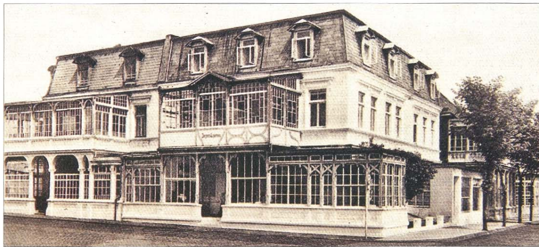
Jürgens Logierhaus an der Ostseite des Platzes.

Trotz der Verbesserung des Wohnumfeldes wurden die Anlieger nicht zur Finanzierung herangezogen. Die einzige verkehrstechnische Auflage, die seinerzeit erfüllt werden musste, war die Anordnung von Parkplätzen für die Polizei. Das alte Polizeigebäude verfügte über keine eigenen Parkplätze. Zur Sichtabschottung dieser Flächen und gleichzeitig als Windschutz für die Sitzbänke entstand die Waschbetonwand. Nach dem Neubau der Polizeistation und die Schaffung eigener Parkplätze