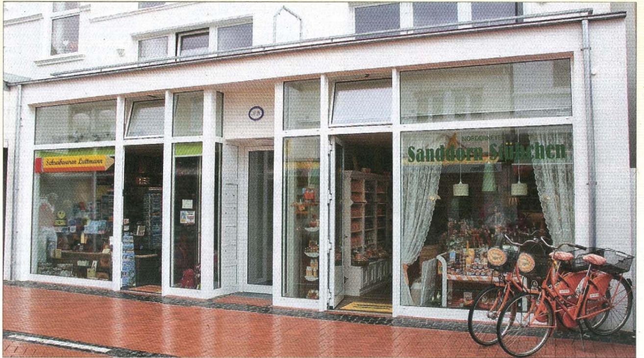
Auch wenn es mal regnet: Ein Besuch beim Schreibwaren Luttmann (links) und im Sanddornstübchen auf Norderney lohnt sich immer.