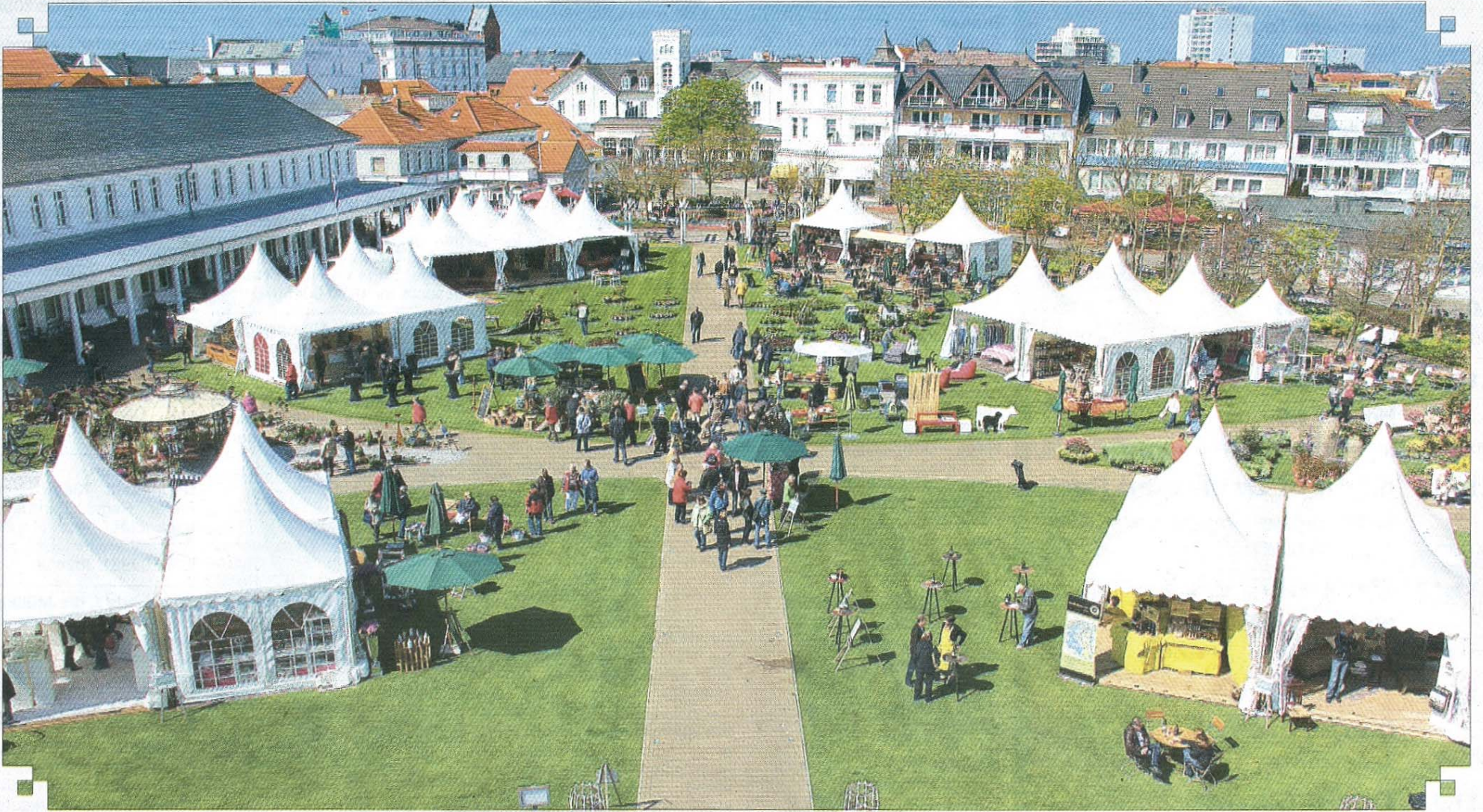
Pagodenstadt auf dem Kurplatz.