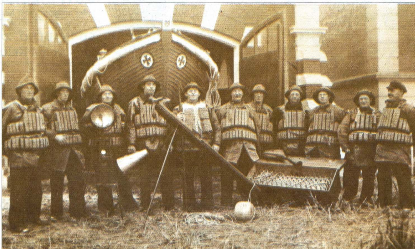
Die Mannschaft des Ruderrettungsboots „Fürst Bismarck“ im Jahr 1926.

Es begann alles mit einem heftigen Nordweststurm – so um Windstärke zehn –, der in der Nacht vom 28. auf 29. März 1925 vor der ostfriesischen Küste aufgezogen war. Ein kleines Dampfschiff namens „Lavinia“ mit 1224