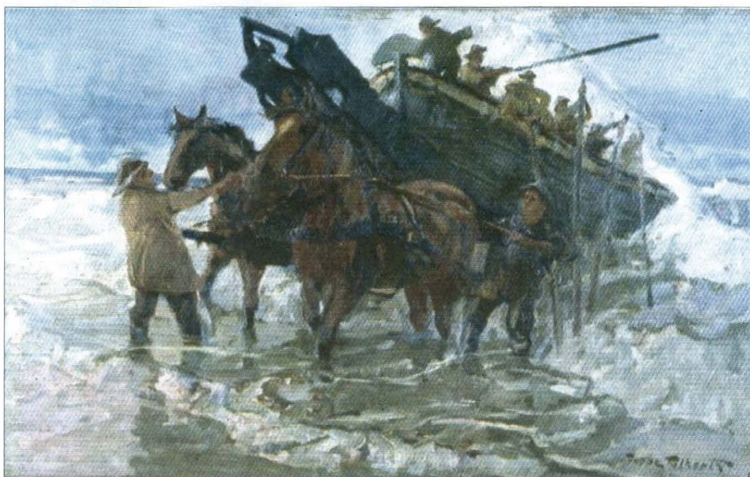
Ausfahrt des Rettungsboots mit Pferden.

Fortsetzung im nächsten Norderney KURIER