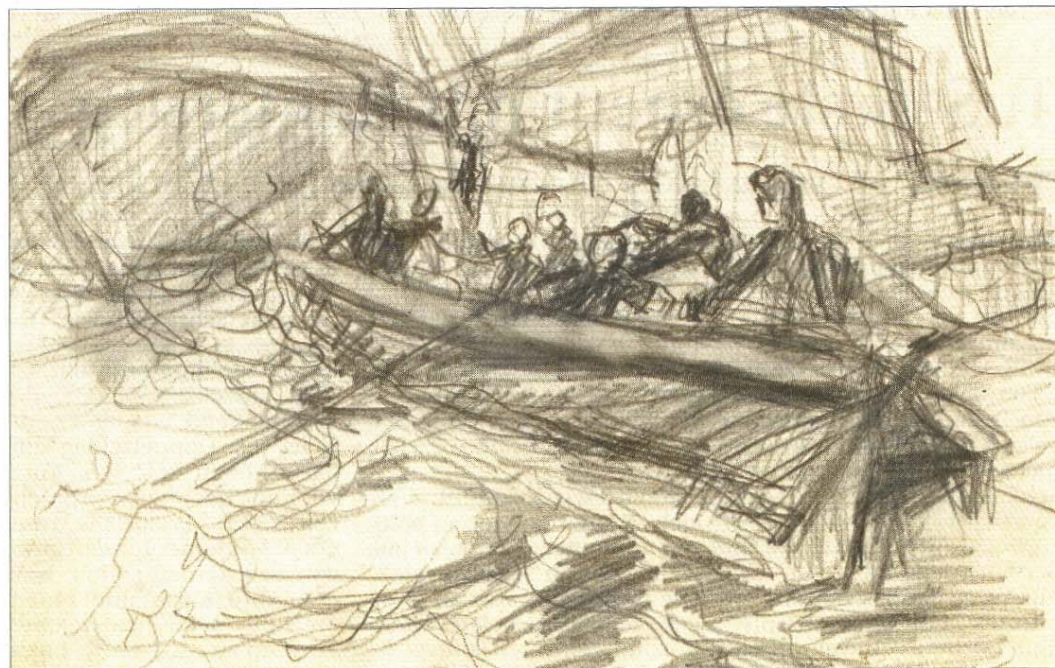
Ausfahrt des Rettungsboots, Studie von 1925.