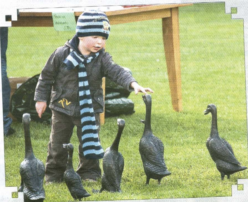
Kein Sorge. Die beißen nicht.