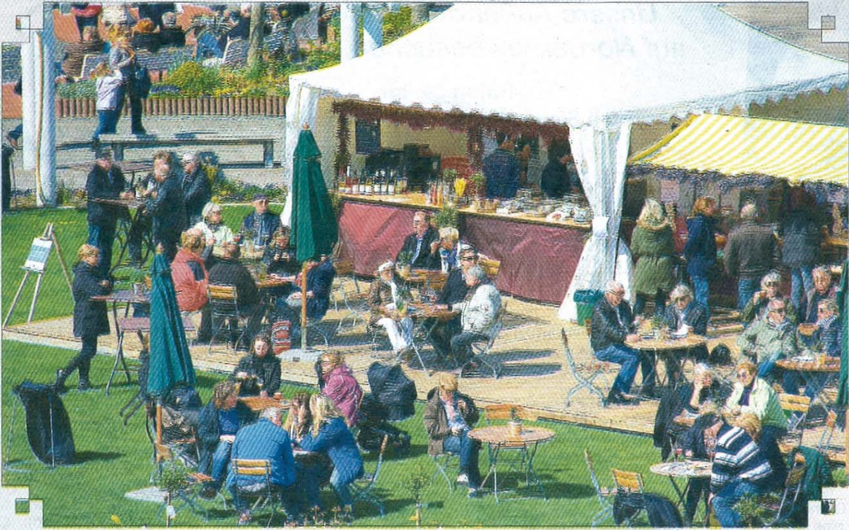
Kleine Pause auf dem Kurplatz.