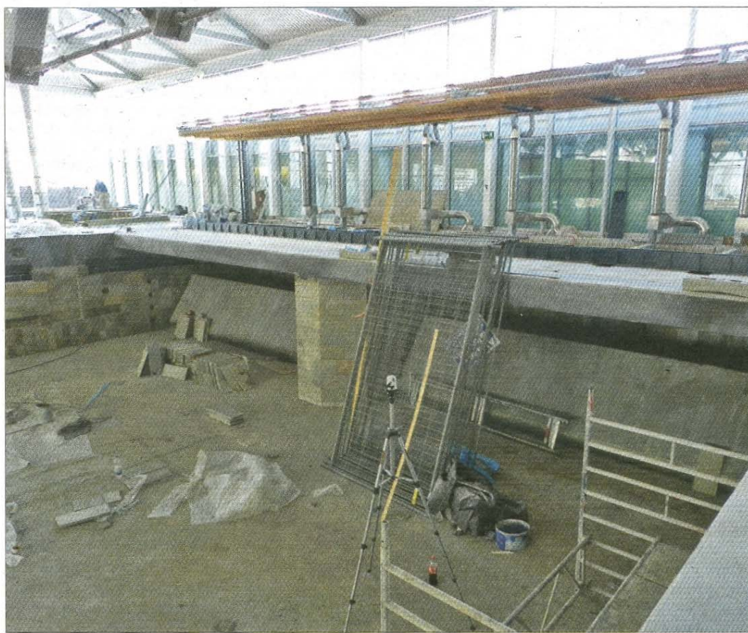
Noch ist das Familienbad eine Baustelle. Am 8. Juni aber ist Wiedereröffnung.