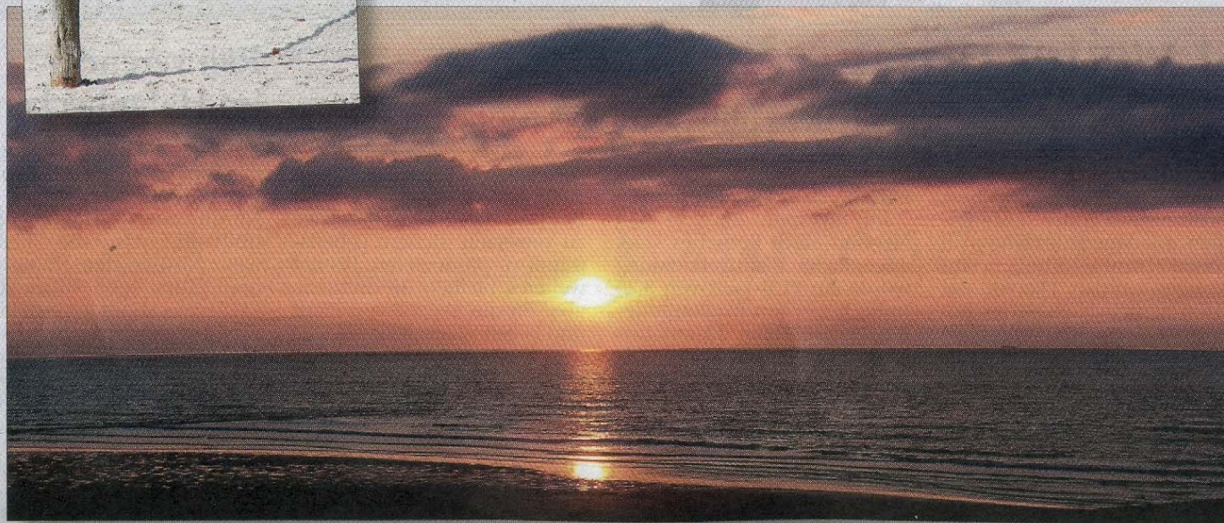
Auch wenn es noch viel regnet und die Temperaturen wenig sommerlich sind: Die Sonnenuntergänge sind auch jetzt schon wieder traumhaft.