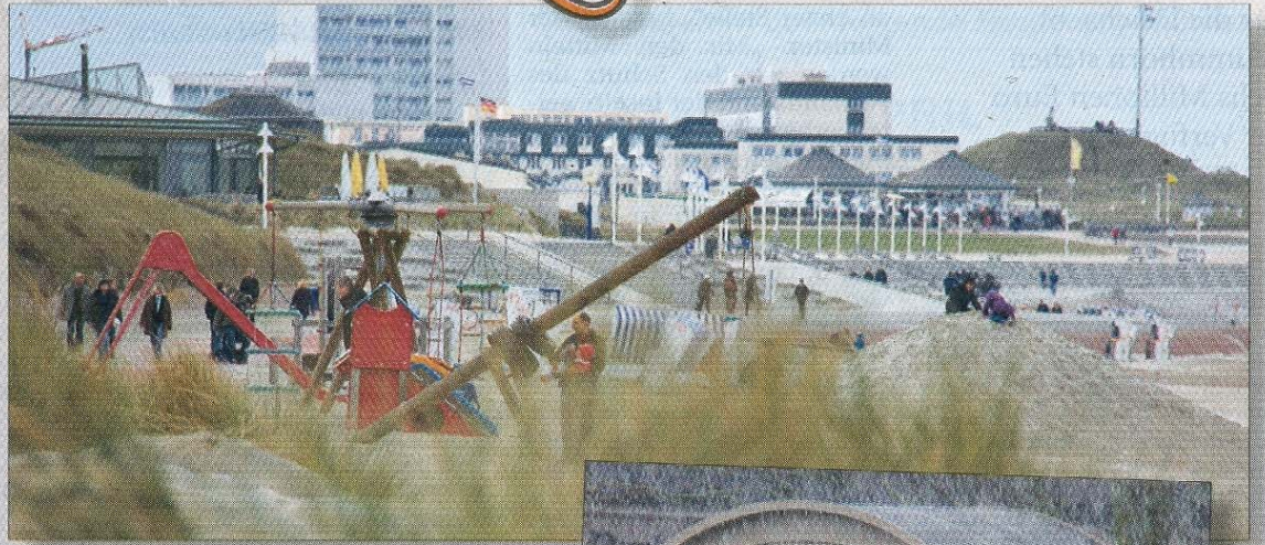
Noch igeln sich die Strände ein.