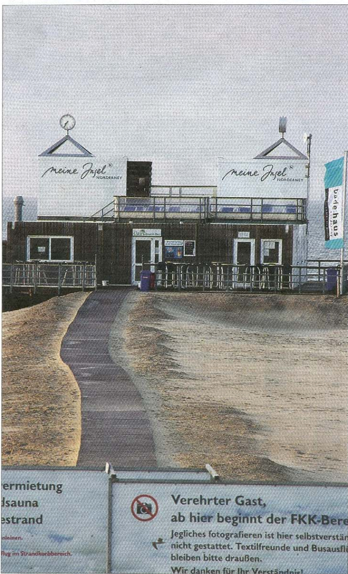
Noch zu kalt für Nackedeis.