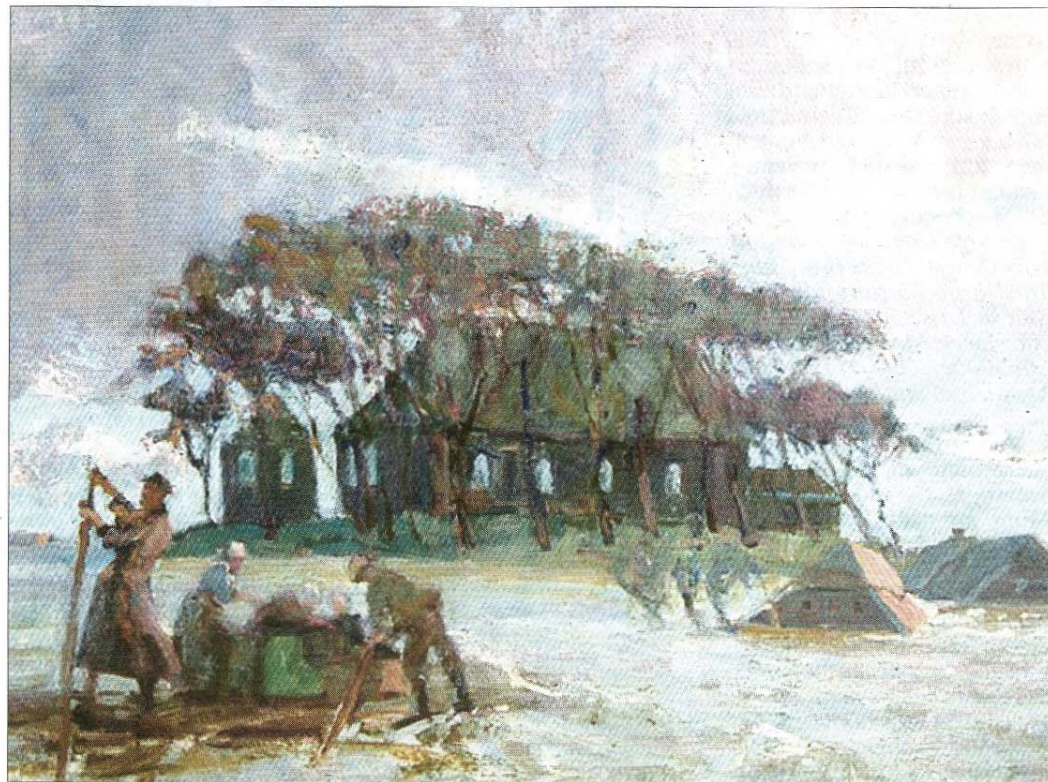
Land unter nach der Sturmflut, 1946.