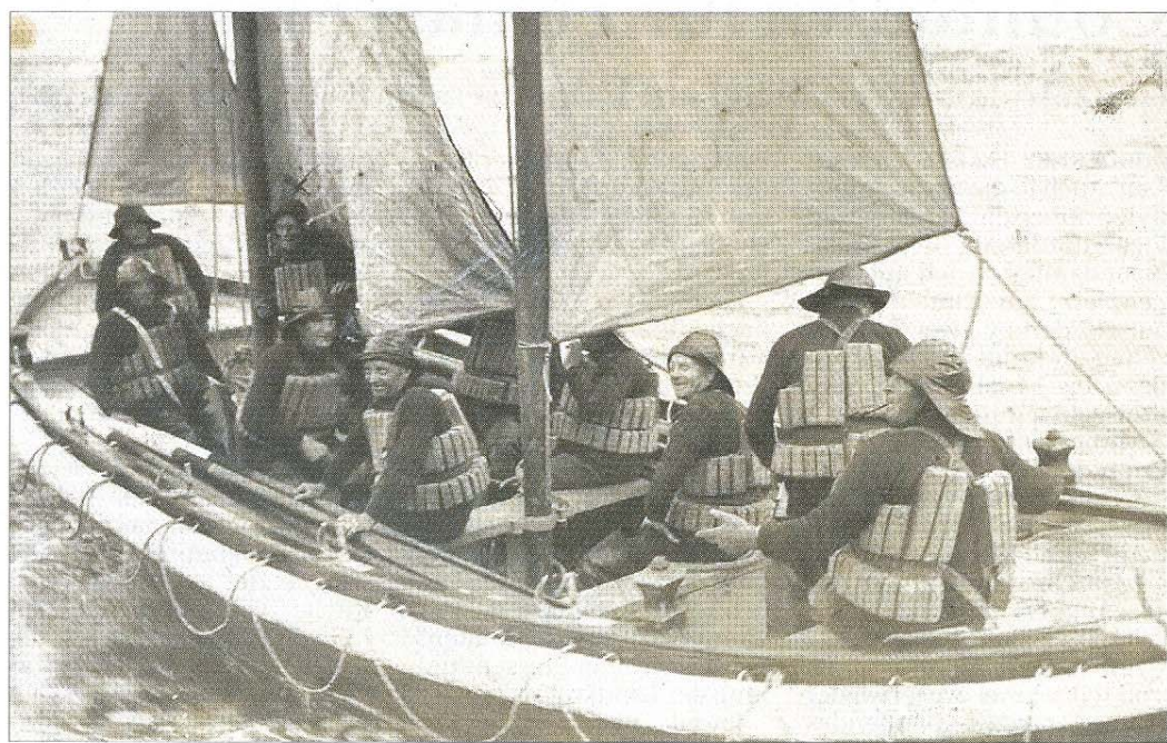
Rettungsboot mit Mannschaft.

Fortsetzung im nächsten Norderney KURIER