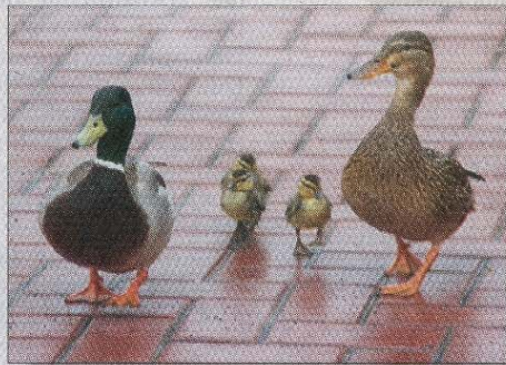
Die Entenfamilie vertreibt sich die Zeit mit einem Ausflug.