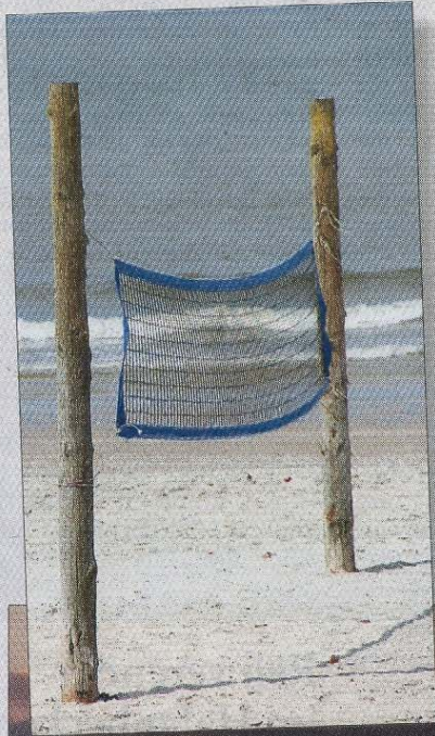
Für Volleyball ist's den meisten Gästen noch zu kalt.