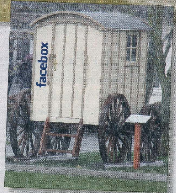
Die Facebox steht im Regen, doch nur für den Moment. In den Medien ist sie derweil bundesweit zu einem Begriff und gleichzeitig zu einem äußerst sympathischen Werbeträger für Norderney geworden.