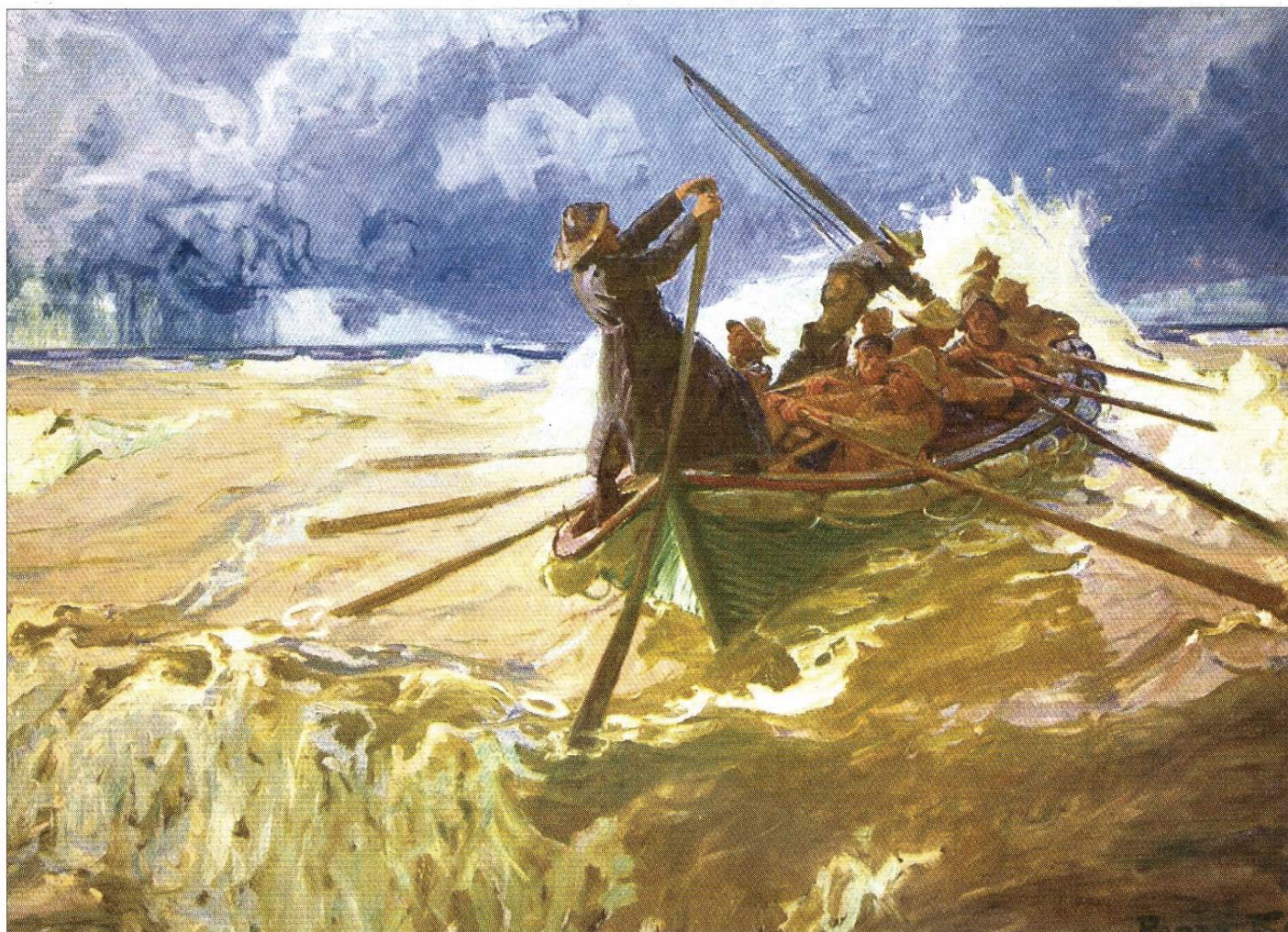
Das Norderneyer Rettungsboot „Fürst Bismarck“ bei der Ausfahrt, 1925.