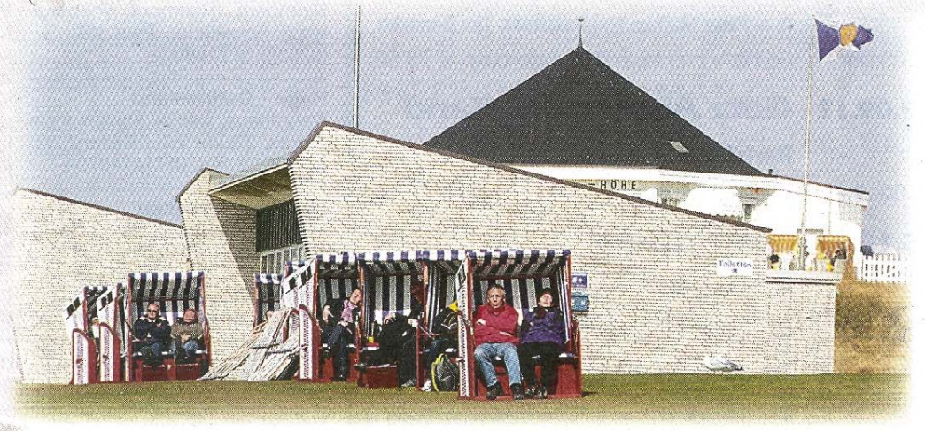
An der Liegehalle unterhalb der Marienhöhe findet man ebenfalls die ersten Gäste, die sich in den Strandkörben windgeschützt sonnen und entspannen.