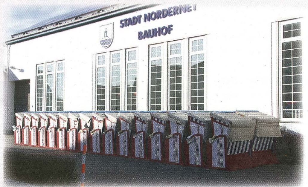
Noch mit Schutzverpackung versehen steht der Strandkorbnachschub am Bauhof für die kommende Saison bereit.