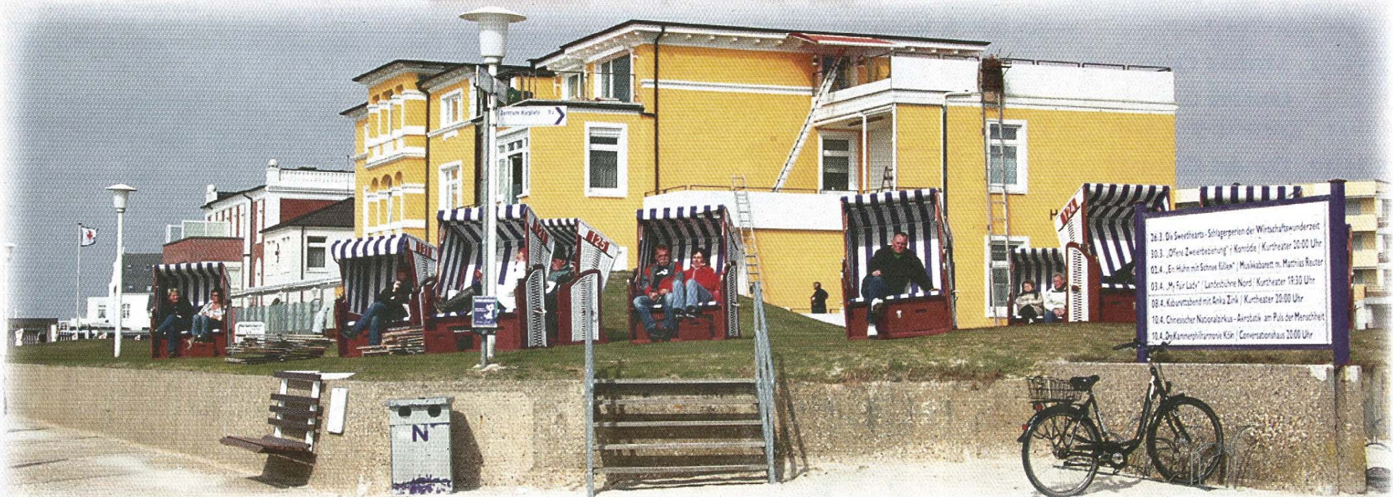
Und auch oberhalb des Westbadestrandes genießen Sonnenhungrige die wärmenden Sonnenstrahlen.