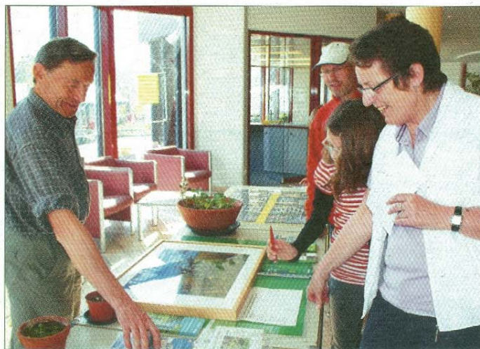
Die letztjährige Briefmarkenausstellung war gut besucht.

Der Seehund lebt an den Küsten und auf den Inseln des nördlichen Atlantiks und nördlichen Pazifiks. In der Nordsee und selten in der westlichen Ostsee ist er auf Sand- und Schlickbänken anzutreffen. Dort werden im Juni die Jungtiere geboren. Das Muttertier lässt das Junge etwa drei bis fünf Wochen säugen. Während dieser Zeit ruft das Junge mit einem