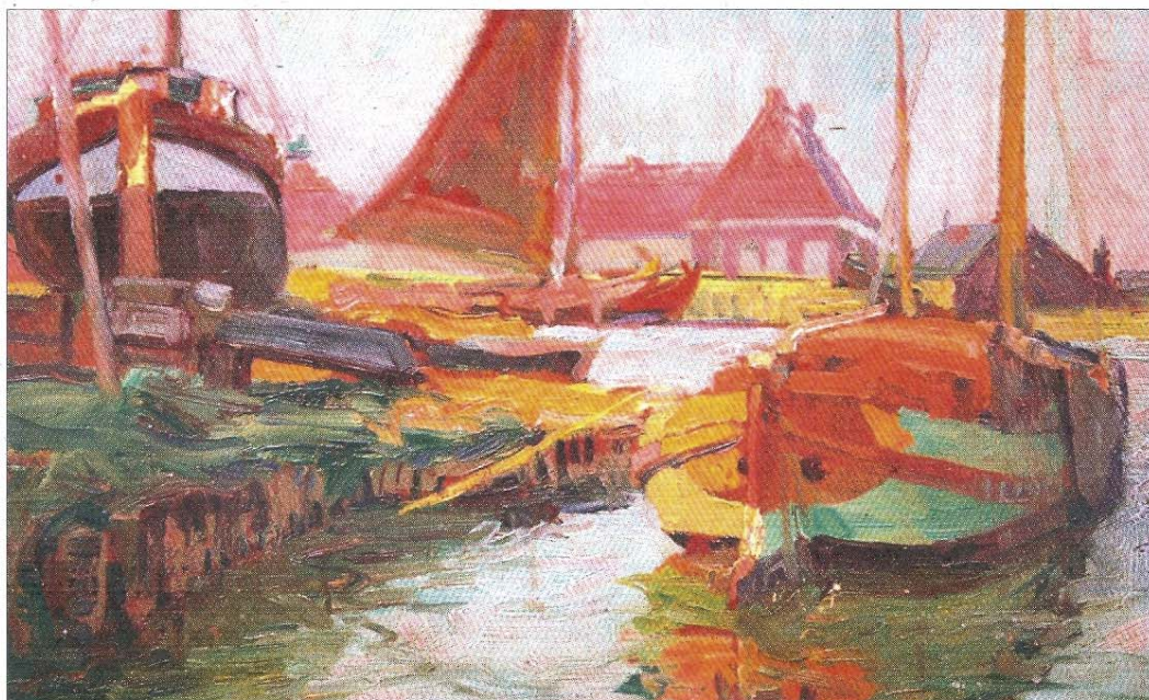
Stavoren – Abend an der Helling, 1930, Öl auf Sperrholz, 37,3 x 45,3 Zentimeter.