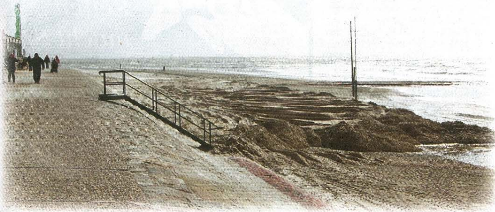
Am Westbadestrand wurde zusätzlicher Sand aufgebracht.