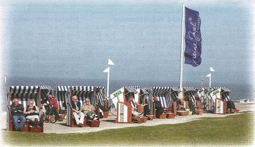
Auf der Kaiserwiese genießen die ersten Gäste die Sonnenstrahlen in den frisch aufgestellten Strandkörben.