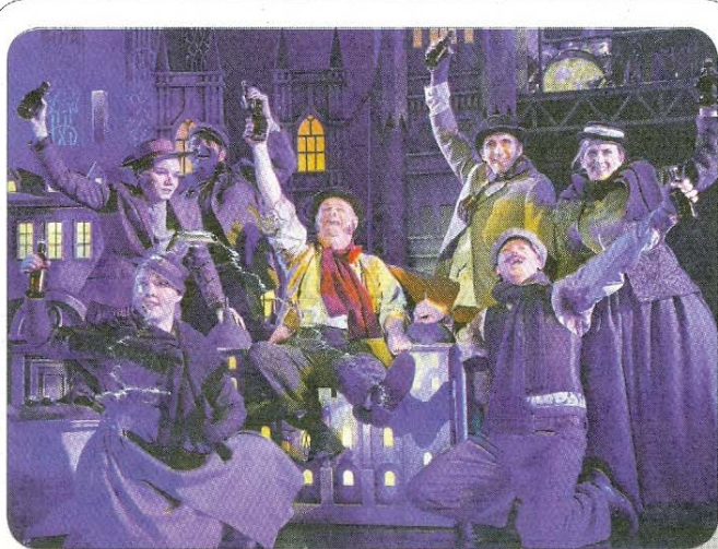
Tipp der Woche: Die niedersächsische Landesbühne präsentiert am Dienstag, 3. April, um 19.30 Uhr im Kurtheater das Musical „My Fair Lady“. Der Eintritt liegt zwischen 18 und 22 Euro.

8.15 Uhr, Inselkirche: Zehn-Minuten-Andacht. 10 Uhr, Nationalpark-Haus am Hafen: Interaktiver Vortrag „Wattwurm, Krabben und Kollegen“. Anmeldung im Nationalpark-Haus, Telefon 04932/2001, erforderlich. 11 Uhr, Inselkirche: Kirchenführung. 11 Uhr, Teehaus: Führung durchs Fischerhaus-Museum. Eintritt: drei Euro. 11.30 Uhr, Badehaus: Thalasso-Therapie. Anmeldung: Telefon 04932/891356. 14 Uhr, Reisebüro am Kurplatz: geführte Fahrradtour, Dauer ungefähr zwei Stunden, Fahrstrecke ungefähr zehn Kilometer, Fahrrad bitte mitbringen. Voranmeldung erforderlich. Kosten: fünf Euro. 15 Uhr, Haus der Insel: Teenachmittag für Senioren. 18 Uhr, Badehaus: Rheuma-Liga. 18.30 Uhr, Tatkraft-Praxis, Strandstraße 7: interaktiver Vortrag „Atempause“. Anmeldung: 0163/6406811. Kosten: acht Euro. 19.30 Uhr, Kurtheater: Musical „My Fair Lady“.