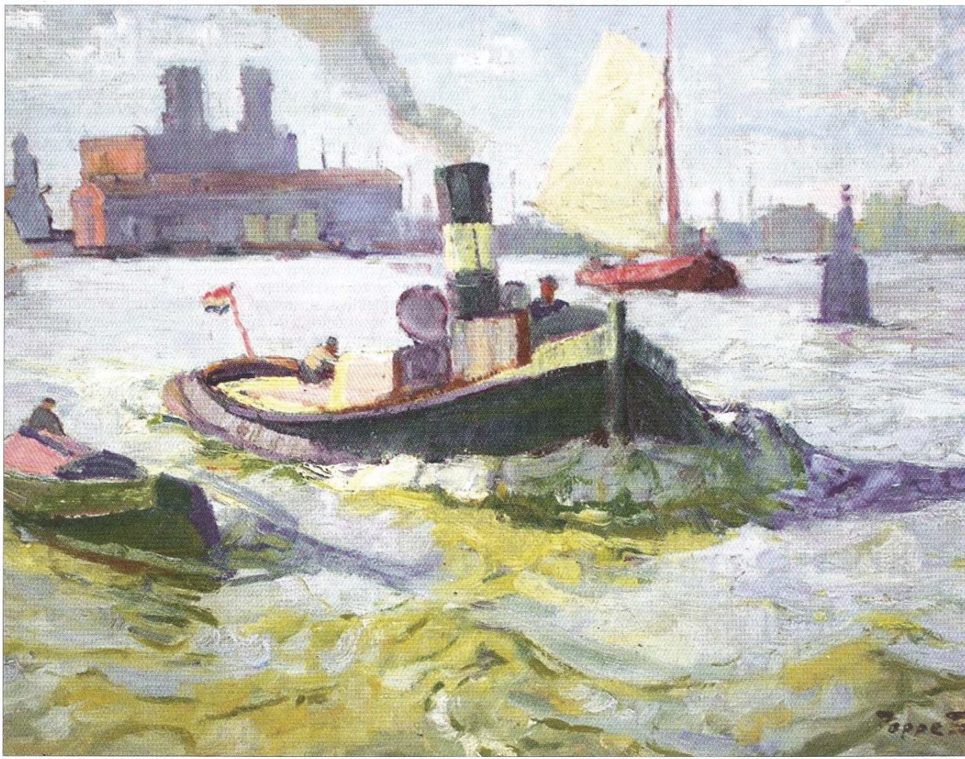
Im Hafen von Amsterdam – 1927, Öl auf Sperrholz, 51 x 62 Zentimeter.

Wir wurden wahrhaftig nicht enttäuscht! ... Diese alten Buchenbäume, in deren duftigem Grün sich niedliche Häuschen versteckten. Sie reizen jeden Vorübergehenden zur Bewunderung. Man sieht ihnen an, mit welcher Liebe und Sorgfalt sie aufs Schönste herausgeputzt wurden. ‚Ah, riefen wir plötzlich wie aus einem Munde, als wir auf einer Anhöhe die alte Kirche gewahrten. Einfach, breit, wichtig stand sie da. Ein würdiger Zeuge einer vielleicht bewegten Vergangenheit... Durch die vielen kleinen Gassen waren wir an den Hafen gekommen. Saubere Dampfer bringen Fremde, die über Monikendam nach Marken fahren. Auf der kleinen Insel kleidet sich noch die ganze Fischerbevölkerung in alte Holländer Trachten. Nachdem wir noch für den Nachmittagsste eingekauft hatten, gingen wir am Wall entlang zur ‚Senta‘, wo Vater ein Mühlenmotiv in Arbeit hatte. Da es in den nächsten Tagen recht stürmisch war, blieb die ‚Senta‘ an ihrem geschützten Kanalplatz liegen. Während dieser willkommenen Ruhetage machten ‚wir Matrosen‘ – Wanderungen am Deich entlang nach Volendam und Edam. In Volendam sahen sie