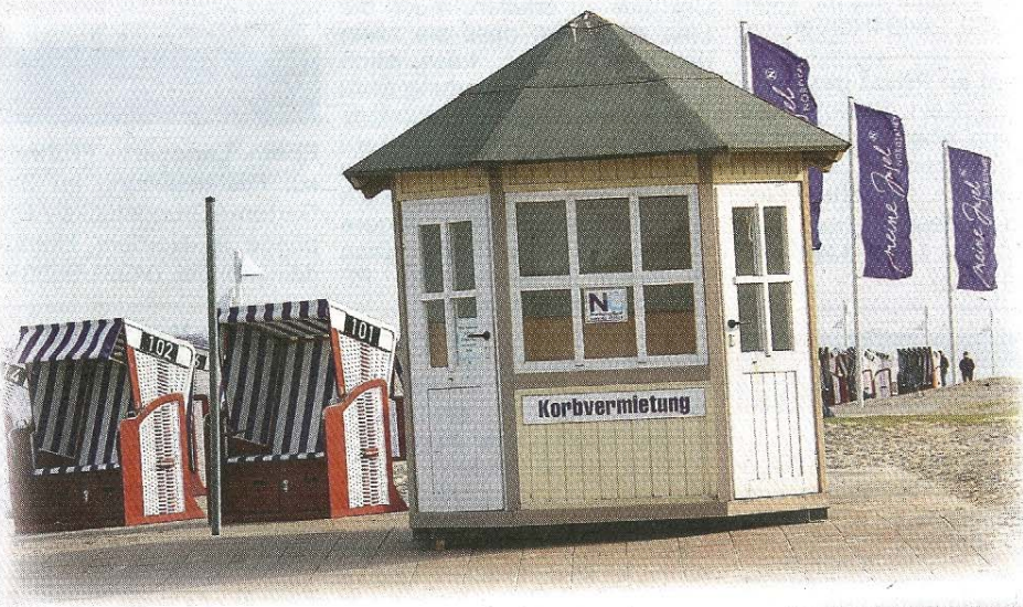
Die Fahnen sind gehisst, die ersten Strandkörbe und das dazugehörige Vermieethäuschen sind aufgestellt. Die Saison kann kommen.