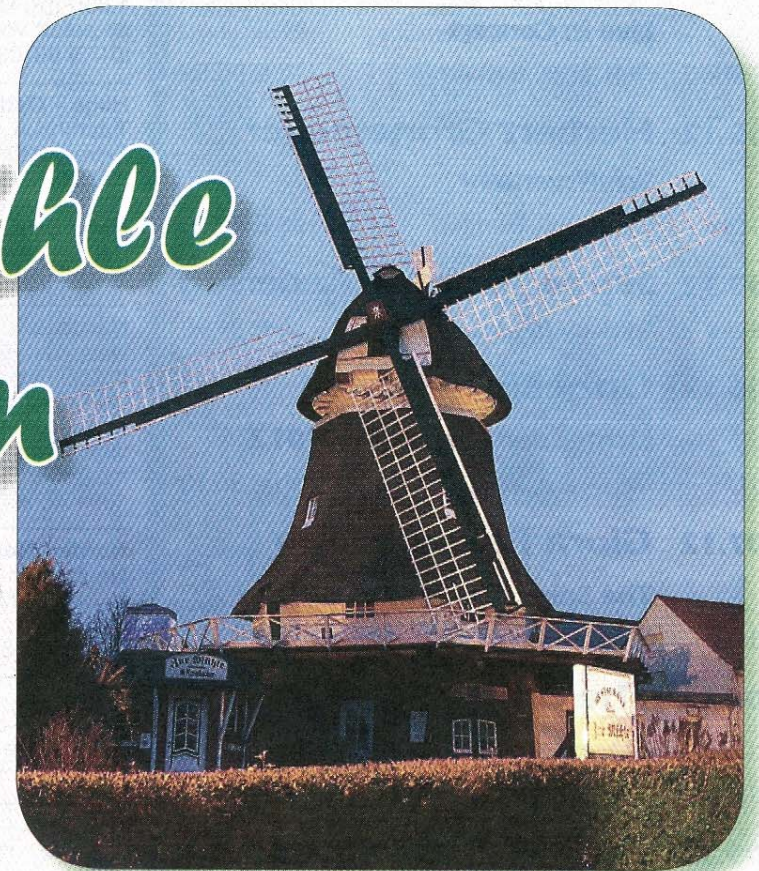
Für das ungeübte Auge nicht zu erkennen: Die Norderneyer Mühle hatte im Januar die Flügel in Trauerstellung, da ein Mitglied der Mühlenfamilie verstorben war.