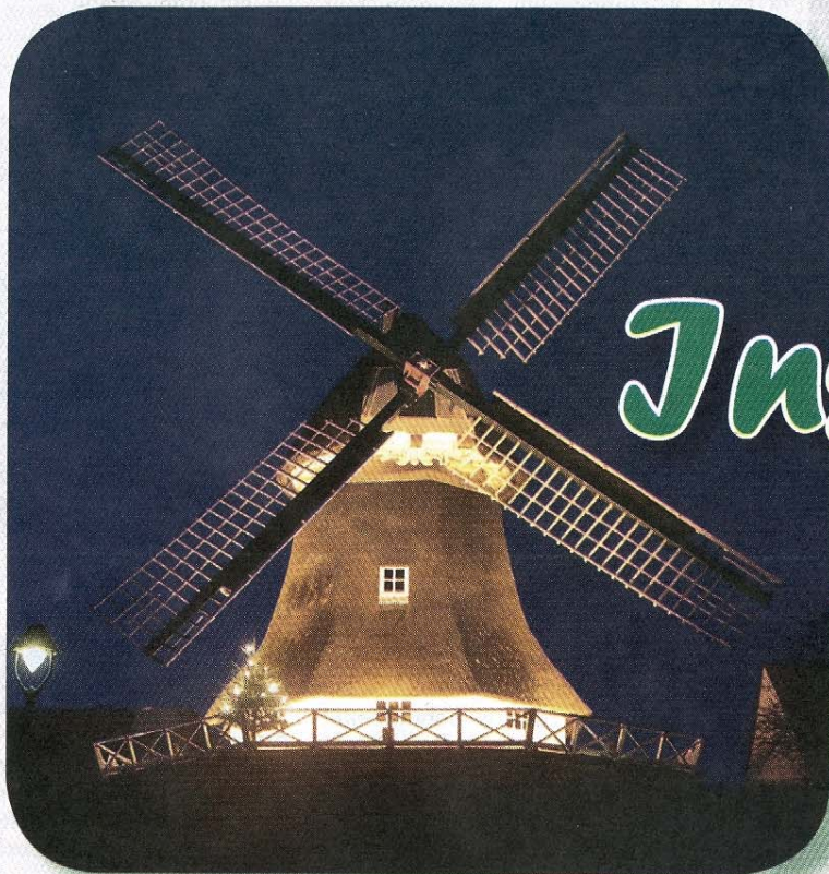
Ein Hingucker: „Selden Rüst“ (Selten Rast) bei Nacht.