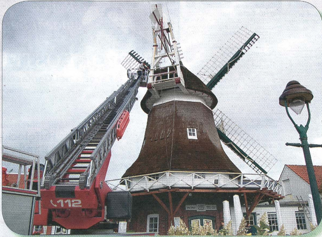
Im September 2011 wurde der marode Fugbalken provisorisch mit einem Stahlgerüst stabilisiert, da er von einem Pilz befallen ist. In diesen Tagen wird er ausgetauscht (siehe unten).