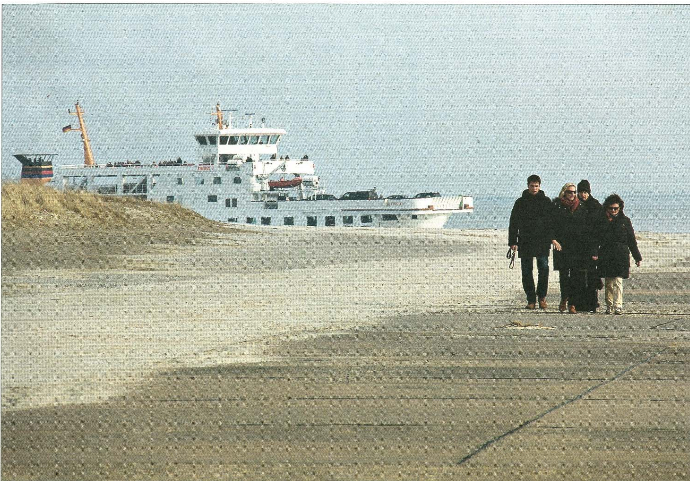
Eine wunderschöne Perspektive fing hier unser Fotograf ein. Es scheint, als führe die Frisia-Fähre auf dem Land und als käme sie gerade „um die Ecke“. Das Foto entstand am Westdeich von Norderney.