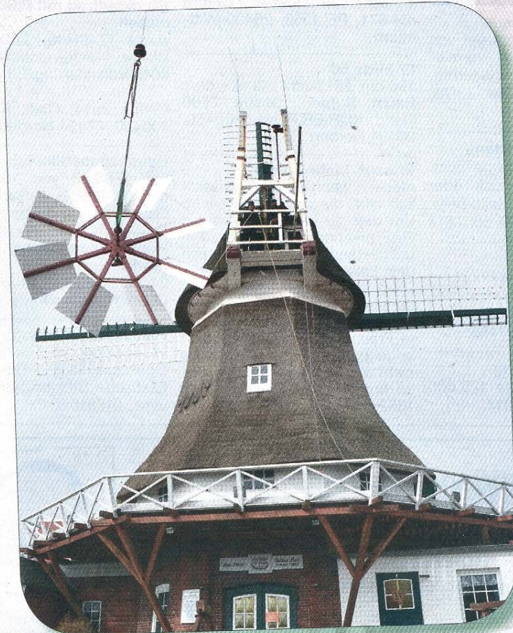
Die Windrose wurde am Dienstag mit einem Kran heruntergehoben. Sie muss vorübergehend weichen, damit der Tragbalken ersetzt werden kann.