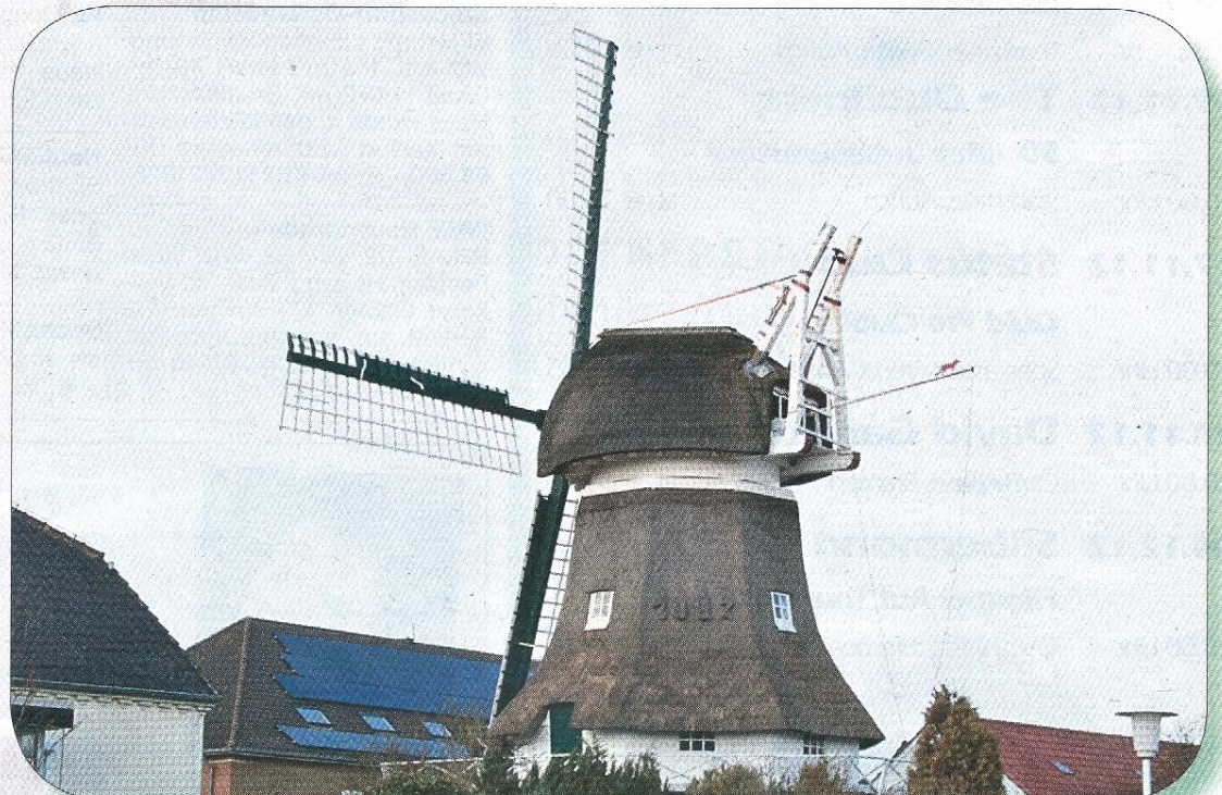
Ein seltener Anblick: Gallerieholländer „Selden Rüst“ derzeit ohne Windrose.