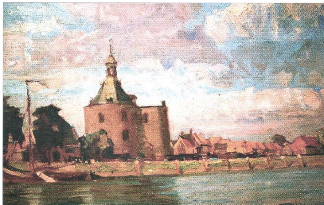
Turm von Enkhuizen – 1930, Öl auf Sperrholz, 61 x 69 Zentimeter.