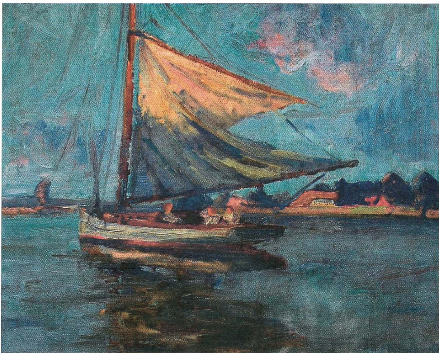
„Senta“ auf der Ems – 1925, Öl auf Holz, 50 x 50 Zentimeter.