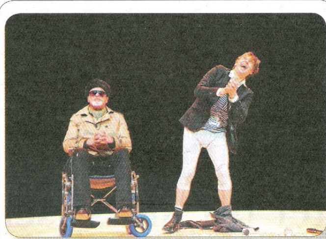
Tipp der Woche: Die niedersächsische Landesbühne führt am Mittwoch, 14. März, um 19.30 Uhr im Kurtheater das Stück „Endspiel“ von Samuel Beckett auf. Der Eintritt beträgt zwischen 18 und 22 Euro. Dieses Kammerstück ist eine heitere Clownerie, durchsetzt von klassischen Running Gags und kindlich unschuldigem Humor.

8.30 Uhr, Haus der Insel: Wochenmarkt. 11.30 Uhr, Badehaus: Thalasso-Therapie. Kosten: fünf Euro. 15 Uhr, Restaurant de Leckerbeck an der Schmiedestraße: Strickcafé. Kosten: fünf Euro. 16 Uhr, Martin-Luther-Haus: Lesetreff. 17 Uhr, Badehaus: Aqua-Fitness-Kurs. 19.30 Uhr, Kurtheater: Auf-führung der Landesbühne mit dem Stück „Endspiel“. Eintritt: 18 bis 22 Euro. 19.45 Uhr, Gemeindehaus an