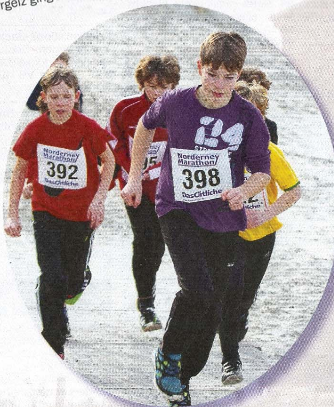
Mit Ehrgeiz ging es auf die Strecke.