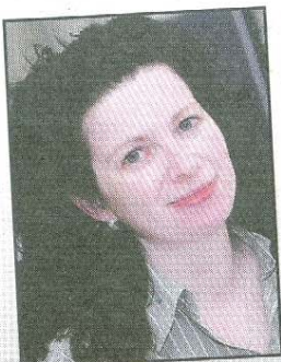
Ilka Rah ☎ 0 49 31 / 925-161

Verlagsgeschäftsstelle Norderney · Wilhelmstr. 2 Mo.-Fr. 9.00-16.30 Uhr, Sa. 9.30-12.00 Uhr