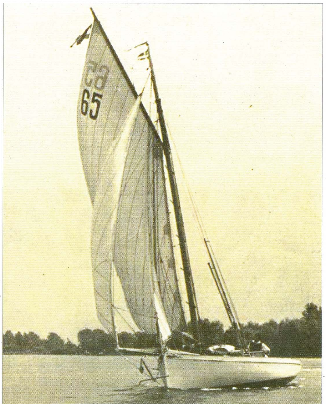
Fotografie der Segelyacht „Senta“.

Am 31. Dezember 1949 stirbt Poppe Folkerts im 75. Lebensjahr am frühen Silvestermorgen und tritt am 4. Januar 1950 seine letzte Fahrt in See an. In Begleitung der Norderneyer Fischerflotte wird er vom Seenotrettungsboot „Norderney“ feierlich dem Meer übergeben.