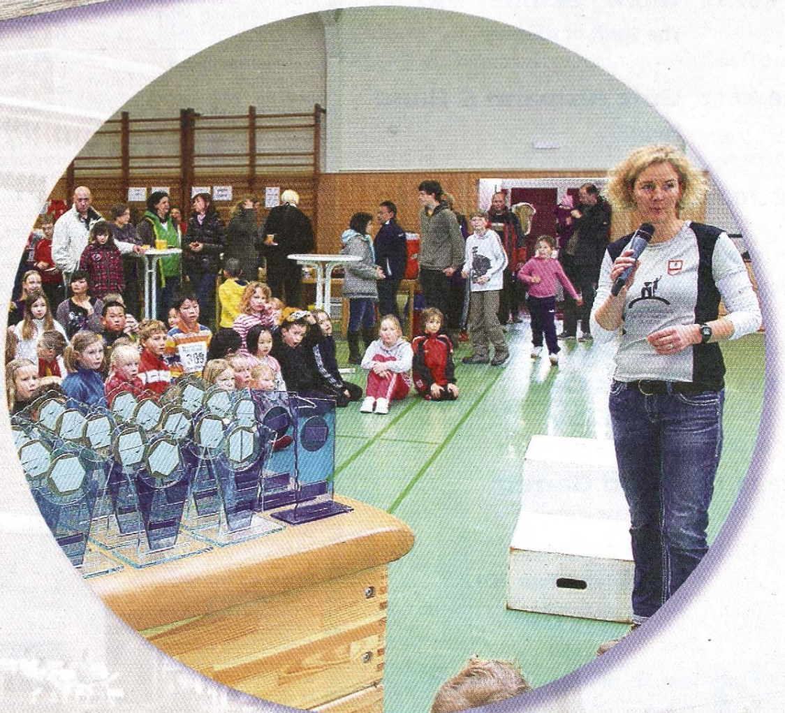
Perfekte Wetterbedingungen beim A. und E.-Korus-Lauf auf Norderney.