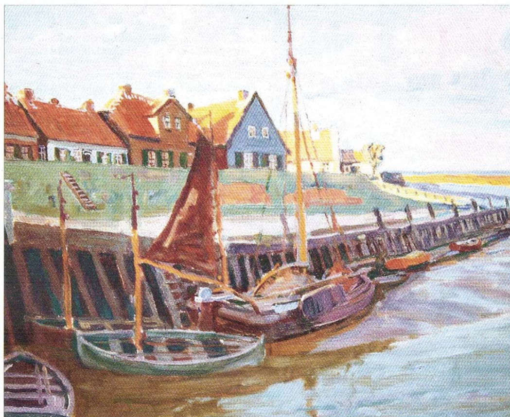
Westeraccumersiel – Abendstimmung von 1938, Öl auf Leinwand, 50,5 x 70,6 Zentimeter.

für Öffentlichkeitsarbeit und Pressewesen. 1976-1994 Stadtdirektor des Nordseeheilbades Norderney. 1995-1997 Studium Universität Oldenburg, Geschichte, Politikwissenschaft, Niederlandistik 1995 – heute Mitarbeit in sozialen Einrichtungen, unter anderem Verwaltungsrat Behindertenhilfe Norden seit 2010 Vorsitzender der Fördergemeinschaft Poppe-Folkerts-Museum Norderney e.V. Homepage: www.poppe-folkerts-museum.de