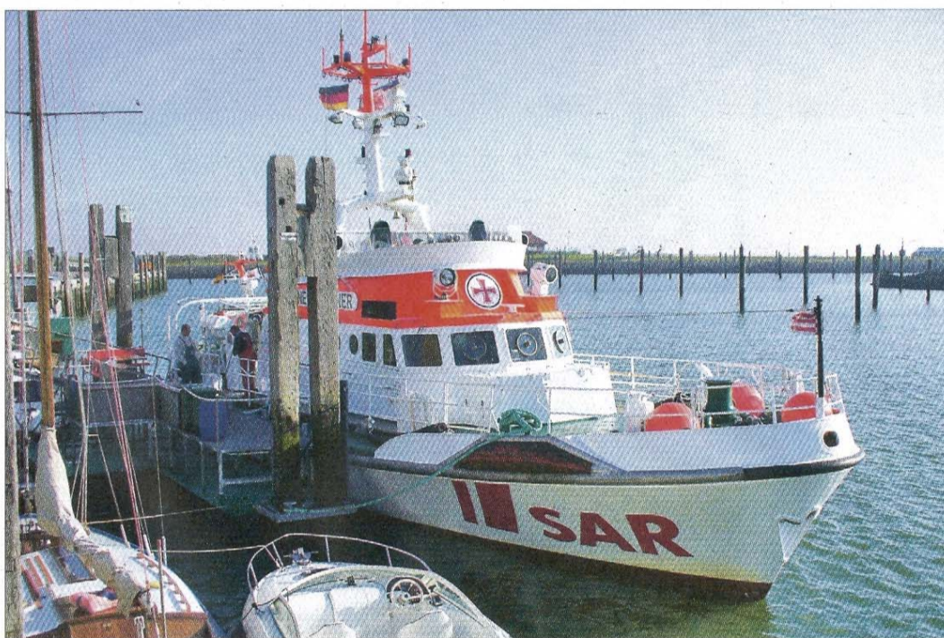
Die „Hannes Glogner“ im Norderneyer Hafen.

„Ballettmusik mit Feuerwerk“ heißt das Konzert am Silvesterabend um 18 Uhr in der Inselkirche. Es spielt das