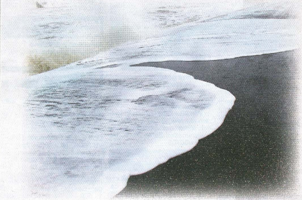
Wellen klatschen an die Promadenkante.