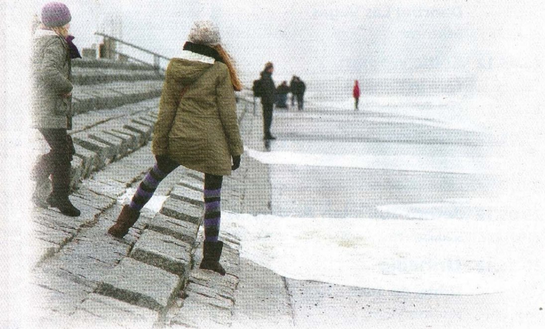
Vorsicht war geboten.