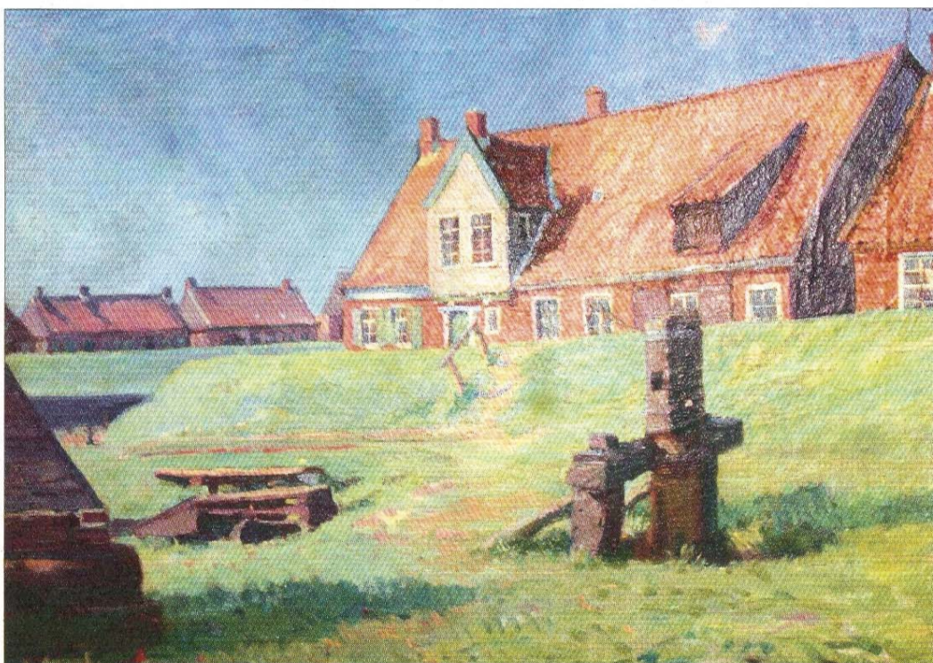
Westeraccumersiel 1911. Öl auf Leinwand, 47 x 61 Zentimeter.

Fortsetzung im nächsten Norderney KURIER