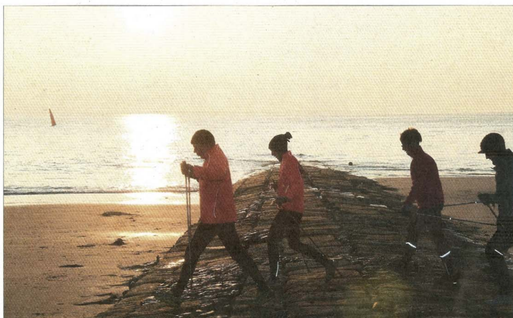
Nordic Walking am Weststrand.

Weitere Informationen über die Veranstaltung erhält man auf der Internetseite www.koenig-events.de . Eine Anmeldung ist noch bis zum 6. Januar möglich.