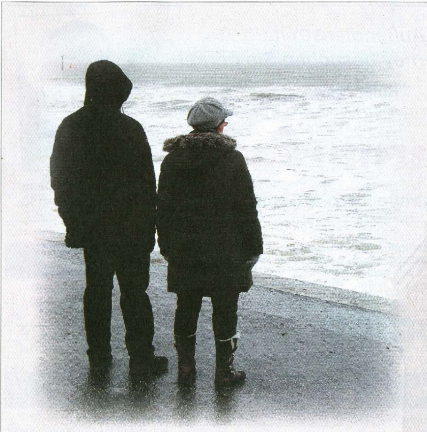
Besucher genießen das herbe Wetter.