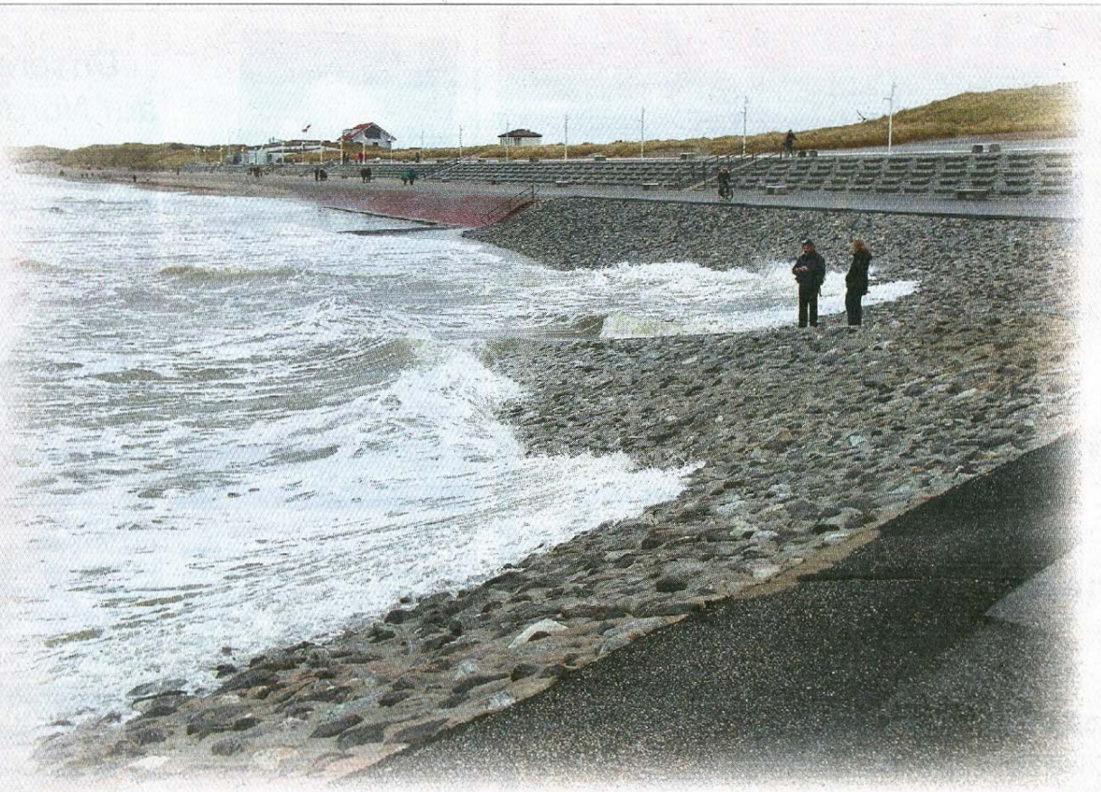
Auch an den östlichen Januskopf wagte sich die Brandung heran.