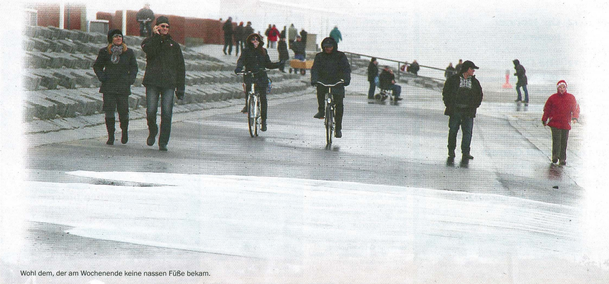
Wohl dem, der am Wochenende keine nassen Füße bekam.