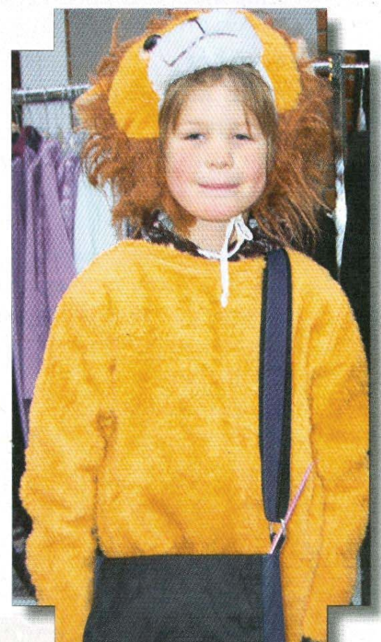
Vor diesem Löwen hatte keiner so richtig Angst.