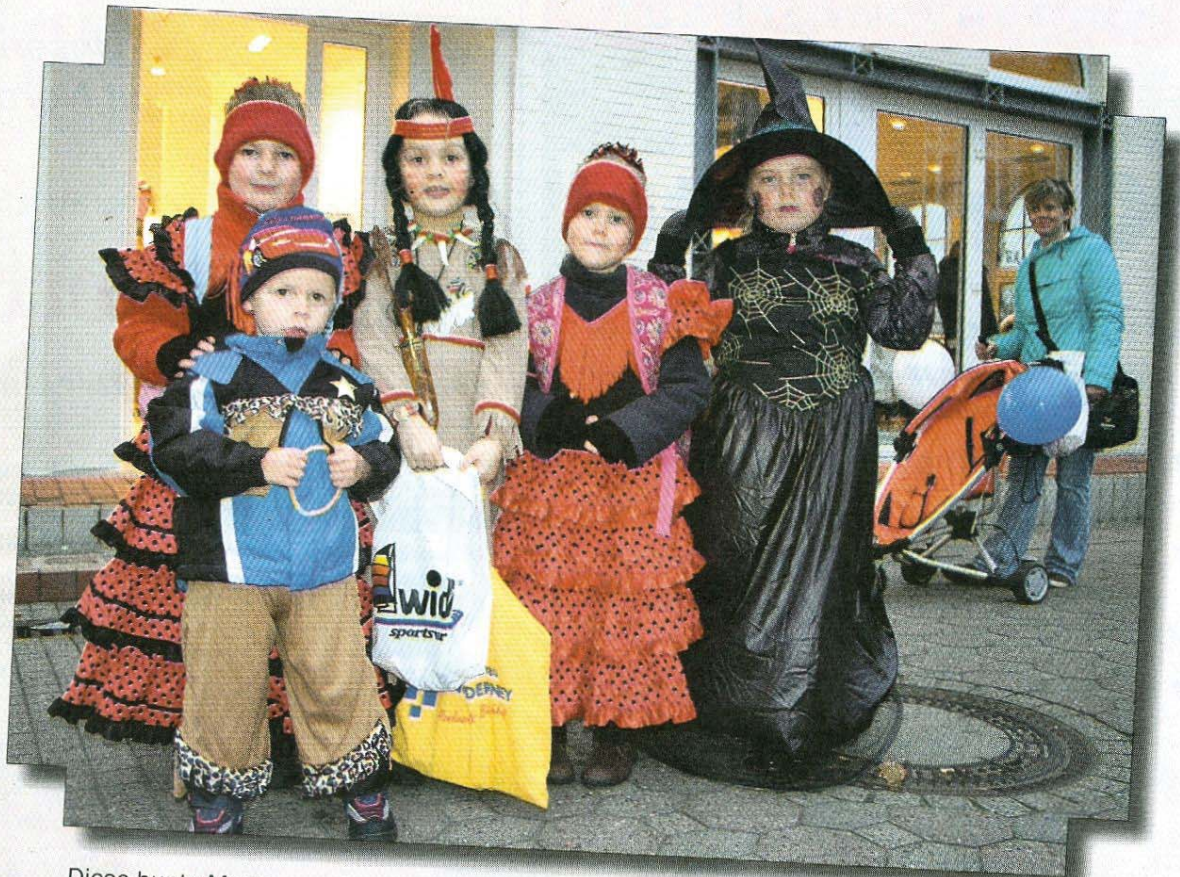
Diese bunte Meute war ebenfalls unterwegs und füllte ihre Taschen mit Naschwerk.