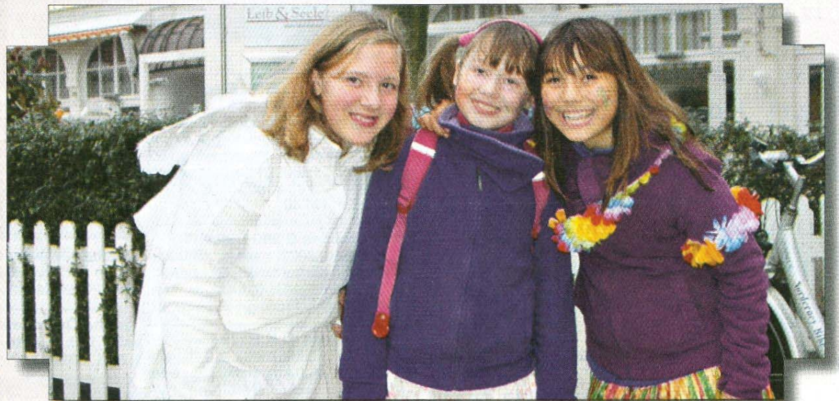
Gut gelaunt ersangen sich diese drei jungen Damen ihre süßen Belohnungen.