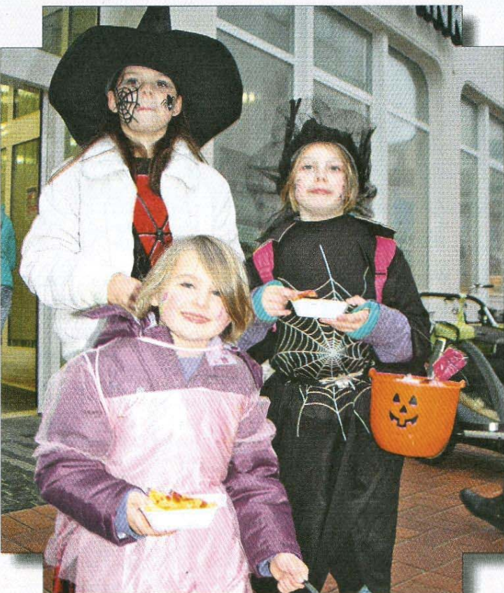
Und diese drei Martini-Läuferinnen bekamen sogar Pommes frites für ihre Gesangsdarbietungen.