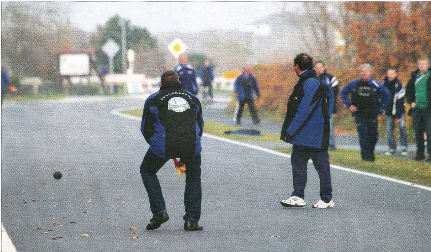
Und wieder heißt es: „He löpt noch!“