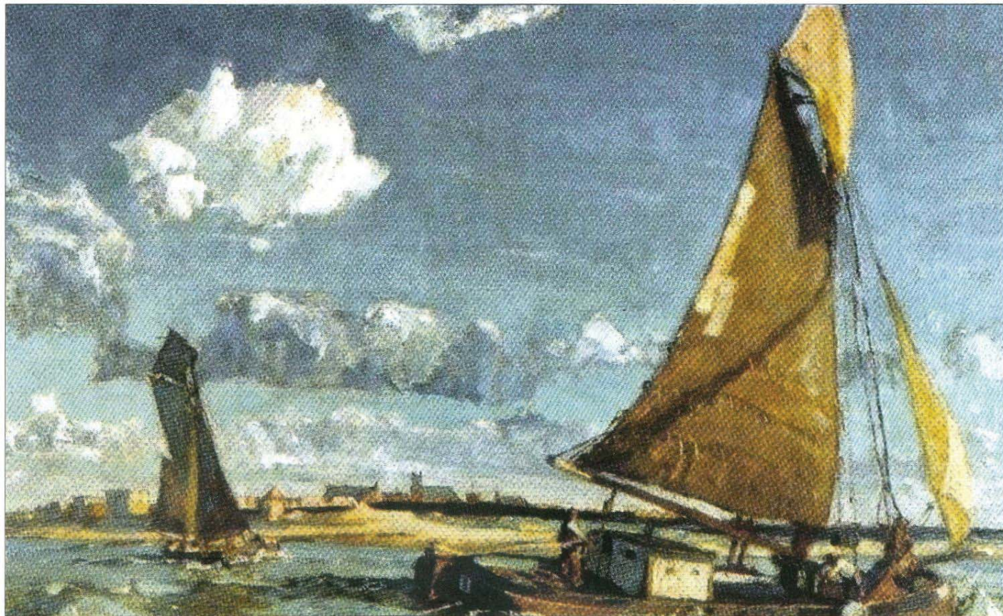
Süd-Westansicht der Insel Norderney mit Segelboot. Im Hintergrund ist der Malerturm erkennbar.

Auf Norderney 1875 geboren und die Schule besucht. Vier Jahre bei einem Anstreicher gelernt, was ich bis zum 22.sten Lebensjahre blieb, als ich nebenbei Zeichenunterricht nahm, woraufhin ich in der Königl. Kunstakademie Berlin aufgenommen