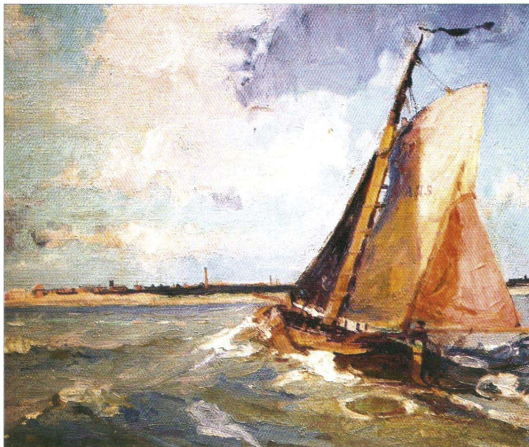
Poppe Folkerts' Bild mit Blick auf Norderney und seinen Malerturm.

Am 31. Dezember 1949 stirbt Poppe Folkerts im 75. Lebensjahr am frühen Silvestermorgen und tritt am 4. Januar 1950 seine letzte Fahrt in See an. In Begleitung der Norderneyer Fischerflotte wird er vom Seenotrettungsboot „Norderney“ feierlich dem Meer übergeben.