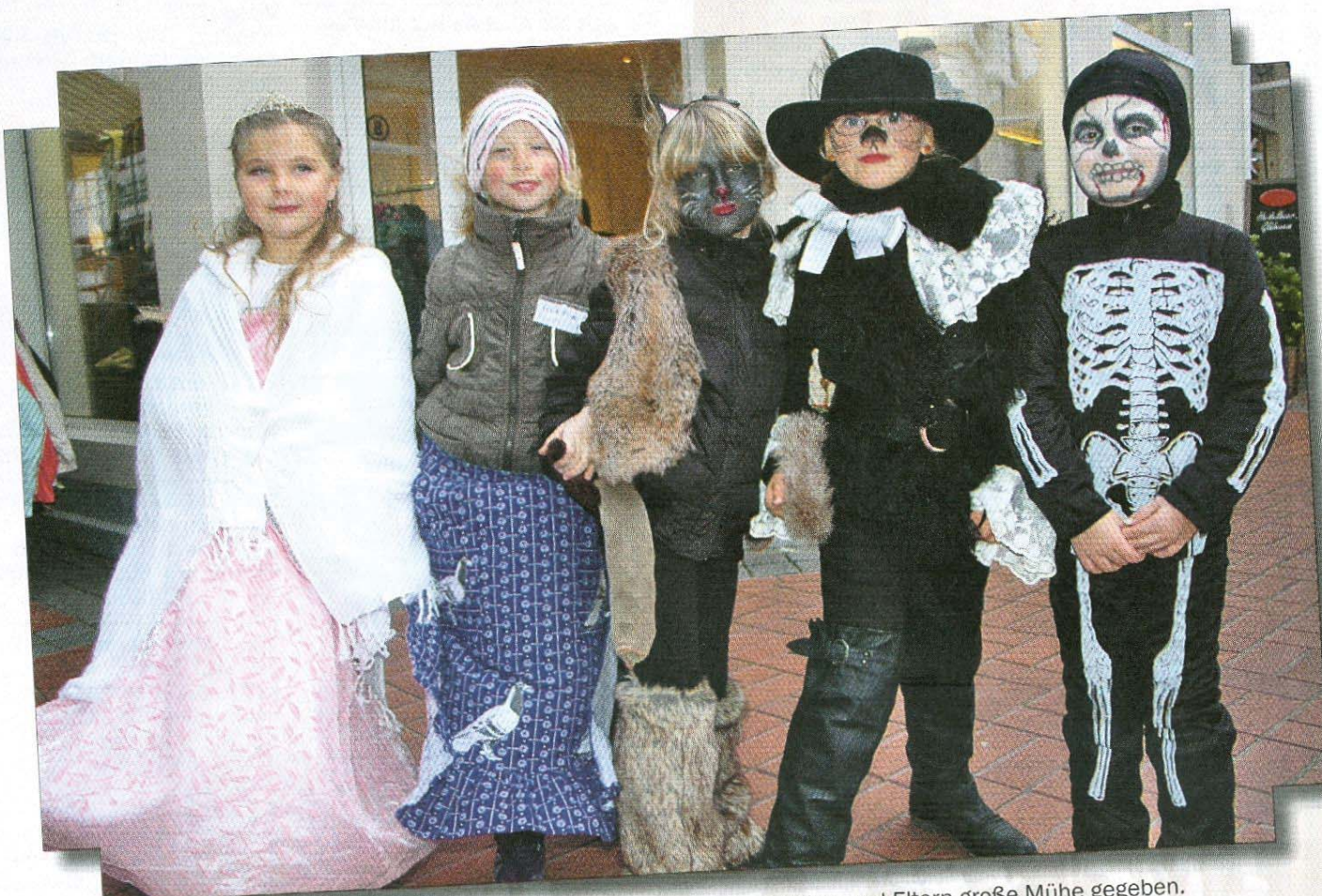
Von märchenhaft bis gruselig: Mit der Kostümierung haben sich viele Kinder und Eltern große Mühe gegeben.