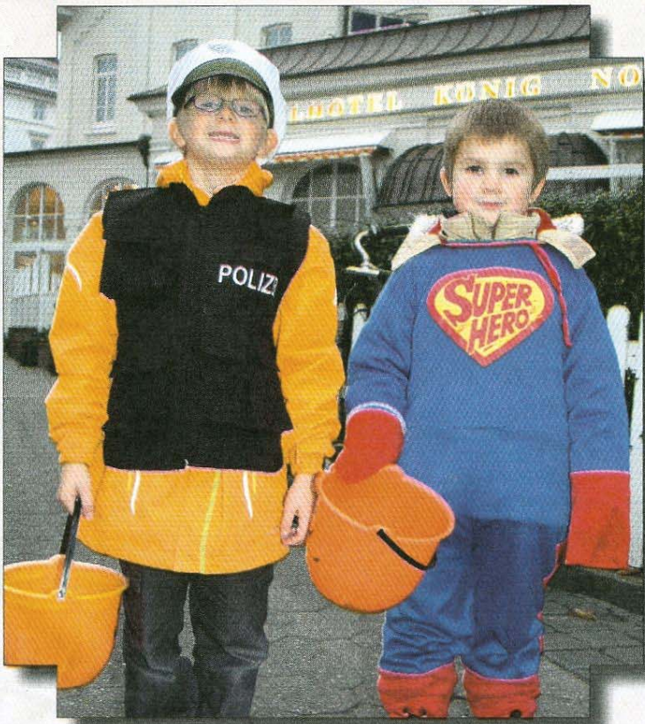
Schutzpolizist und Super-Hero auf der Jagd nach Süßem.