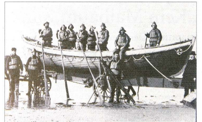
Rettungsboot mit Besatzung um 1900.