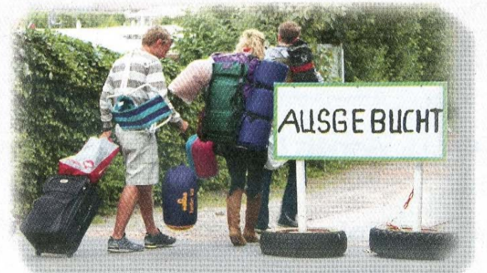
Viele Campingplätze, wie hier am Waldweg, waren zu Pfingsten ausgebucht.