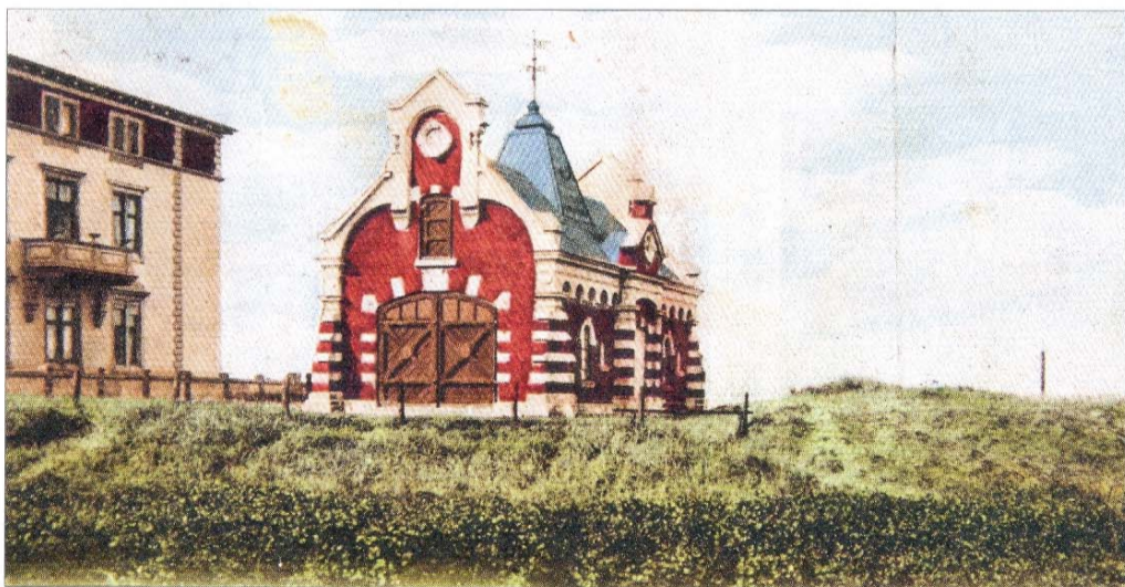
Rettungsstation Norderney West der DGzRS im alten Glanz.

Ein besonderes Merkmal der DGzRS ist, dass sich die Organisation ausschließlich aus Spenden finanziert. Sollten Sie in einem Lokal einkehren und das kleine Spendenschiffchen der DGzRS entdecken, spenden Sie einen kleinen Obolus, es ist für einen guten Zweck.