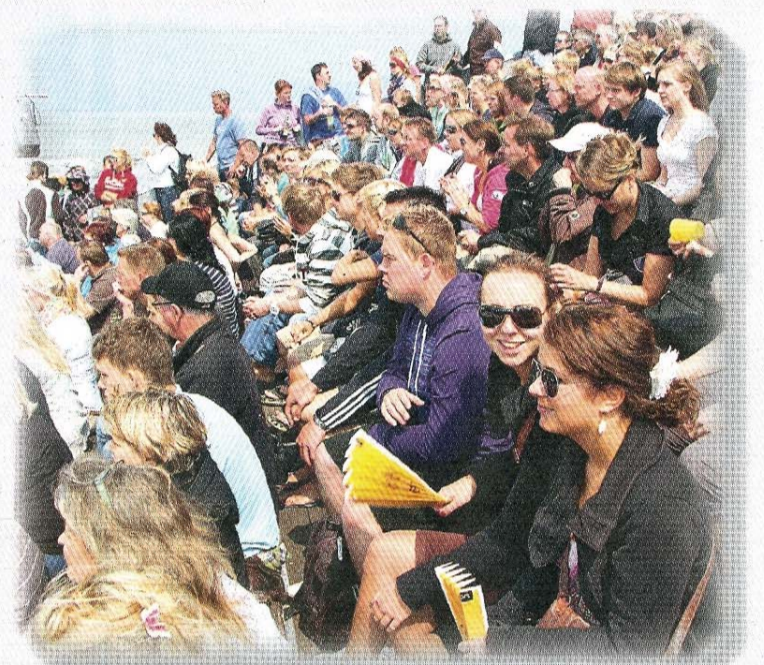
Volle Besucherränge während der vielen Beachvolleyballspiele.