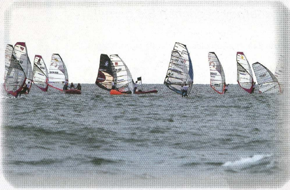
Auf dem Wasser kämpften die Windsurfer um wertvolle Punkte.