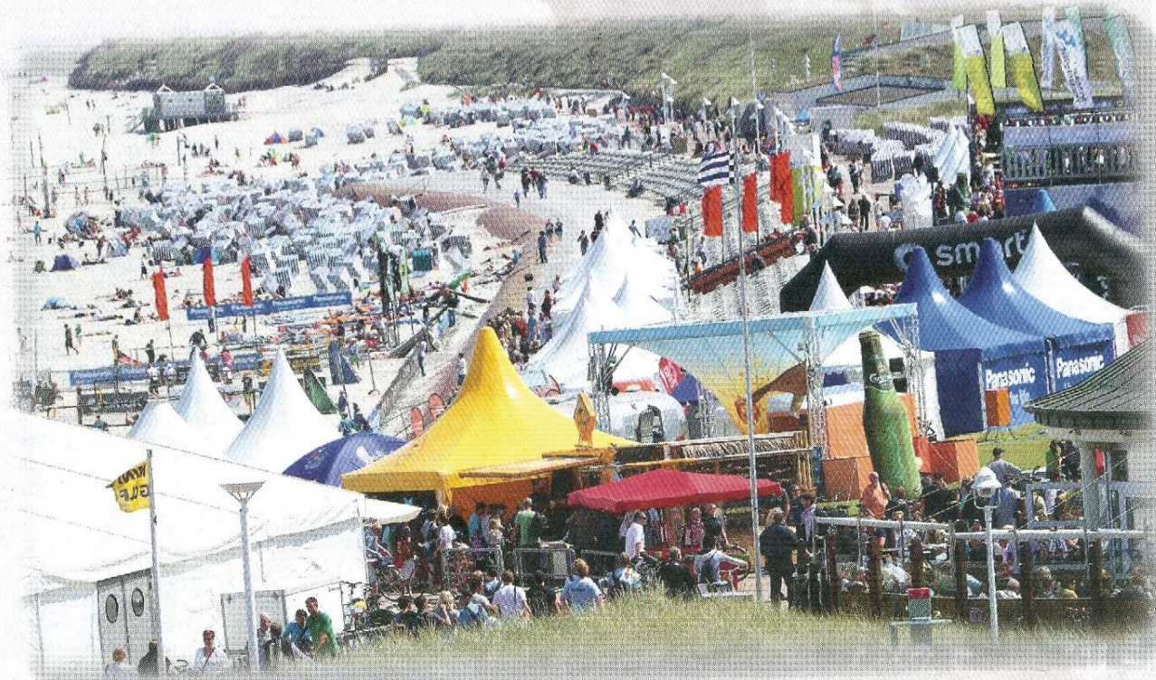
Das Gelände des White Sands Festivals am Nordstrand am Januskopf.