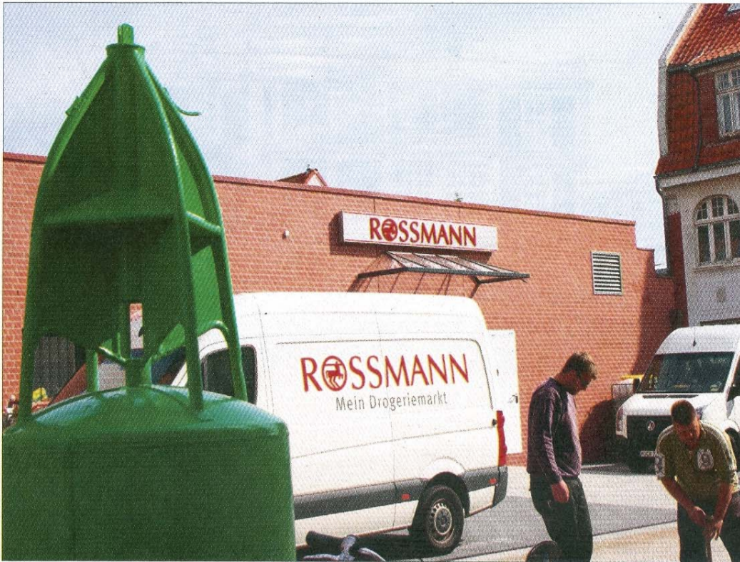
Wo früher auf dem ehemaligen Posthof die gelben Autos der Deutschen Bundespost und später Post AG standen, ist heute ein großer Drogeriemarkt zu finden.

Insgesamt sind 15 Mitarbeiter in der neuen Verkaufsstelle beschäftigt, davon neun Neueinstellungen. Sie stehen