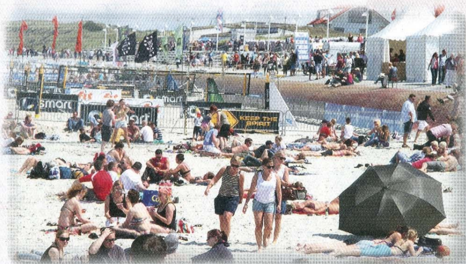
Unzählige Besucher des Festivals genossen die Sonnenstrahlen am Strand.