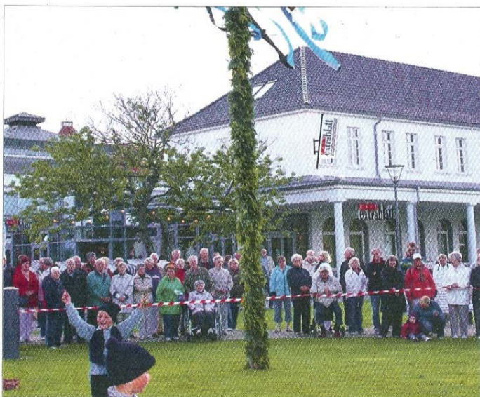
Die Kinder des Heimatvereins tanzten um den Pfingstbaum.