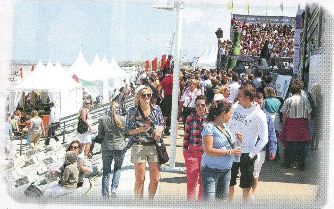
Kaum noch ein Durchkommen auf der oberen Promenade.