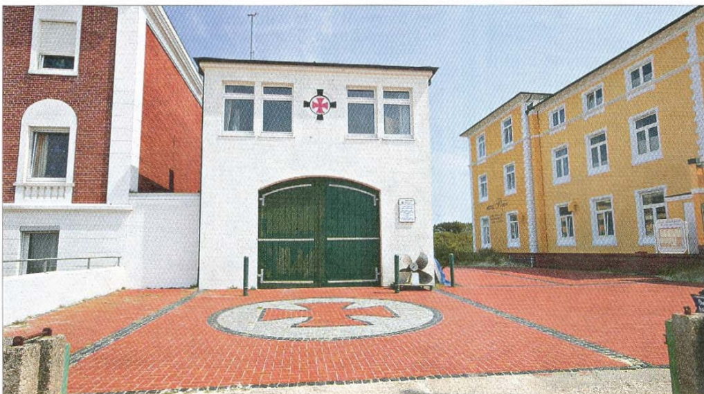
Die heutige Rettungsstation West der DGzRS am Westbadestrand.