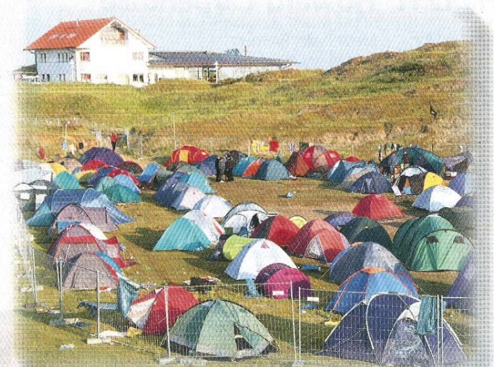
Als Ausweichalternative wurde das Dünenal unterhalb des Cornelius zum Zeltplatz umfunktioniert.