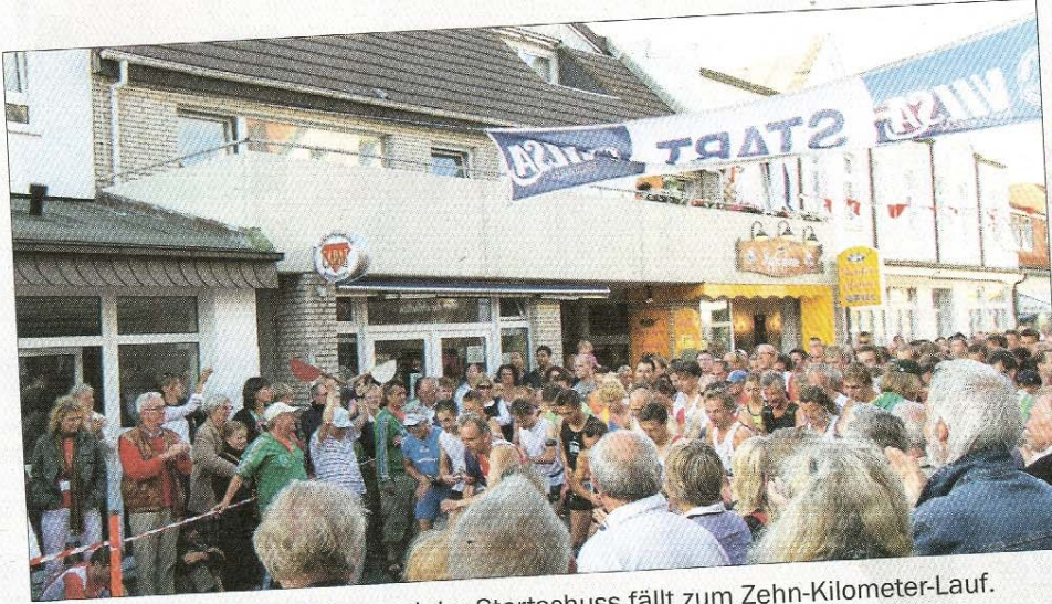
Nur noch wenige Sekunden und der Startschuss fällt zum Zehn-Kilometer-Lauf.