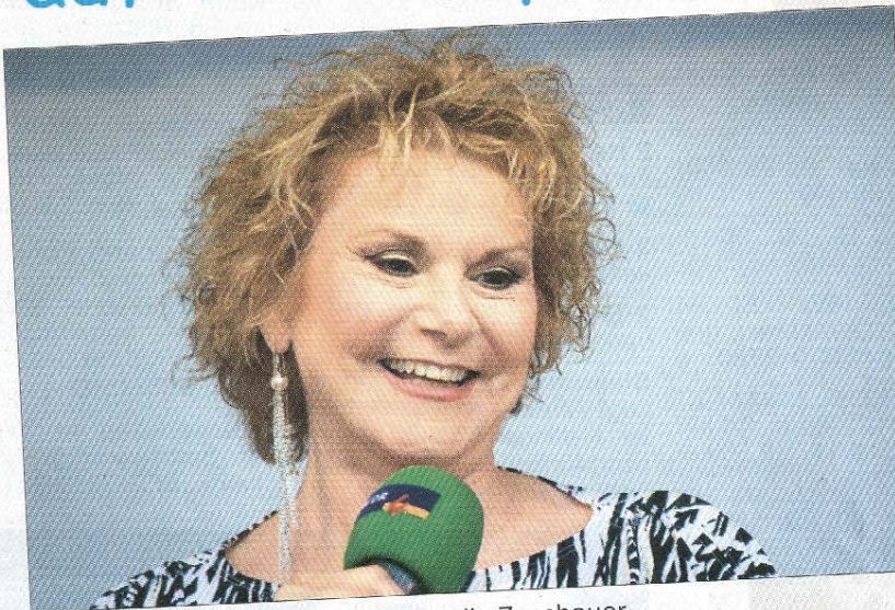
Peggy March unterhält gut gelaunt die Zuschauer.

und der WDR 4 Schlagerexpress auf dem Kurplatz.