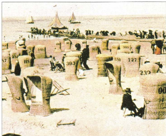
Strandkörbe am Damenstrand um 1900. Es gab zu der Zeit vorwiegend Einsitzer.