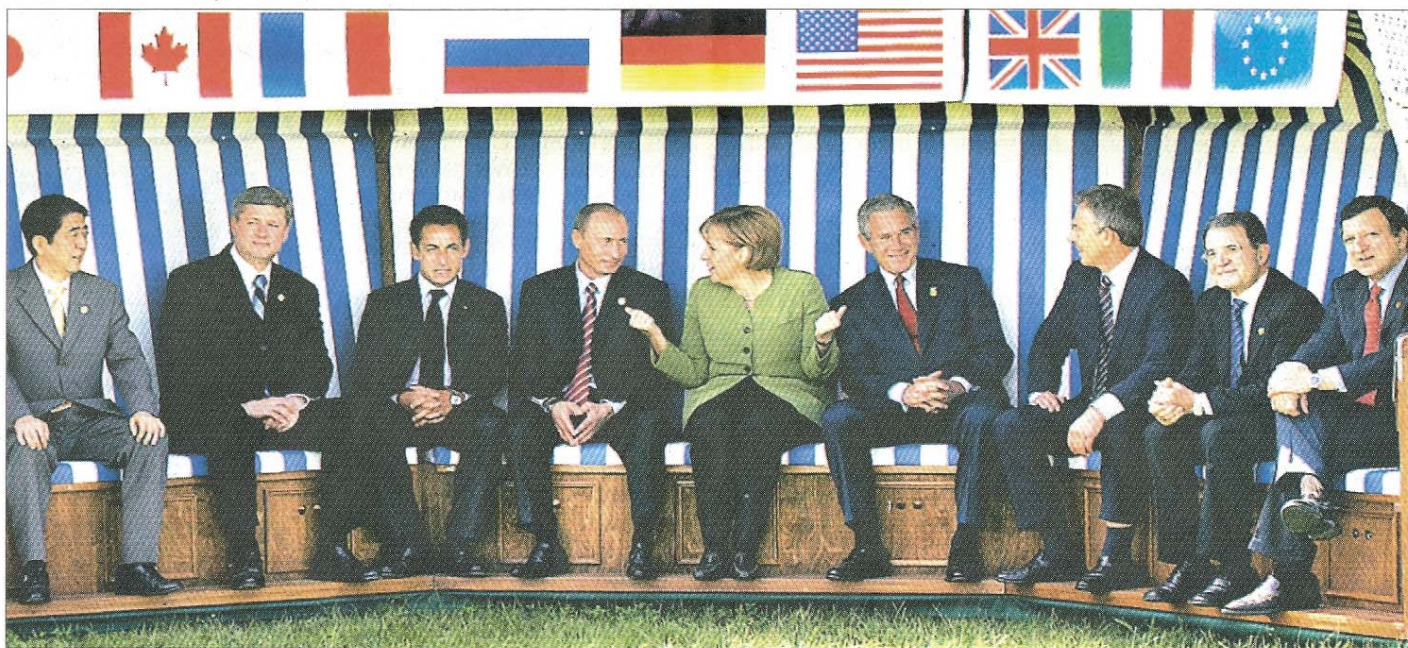
Gipfeltreffen der G8 Regierungschefs im Strandkorb in Heiligendamm.

NORDERNEY – In einer Norderney-Beschreibung heißt es 1890: „Steigst du links hinab zum Strande, entrollt sich dir das Bild des echt modernen Badelebens. Etwa 600 Strandkörbe bilden förmlich Straßen, Alleen und Plätze. Hier ruhen, lesen, arbeiten Erholungsbedürftige, dort entwickeln sich Badekorbrömer mit mehr oder weniger naturalistischem Hintergrund.“ Zum Umziehen diente der Strandkorb vorerst nicht, dafür gab es Badekarren. So saß man züchtig bekleidet in den bequemen Sitzkörben und schaute dem