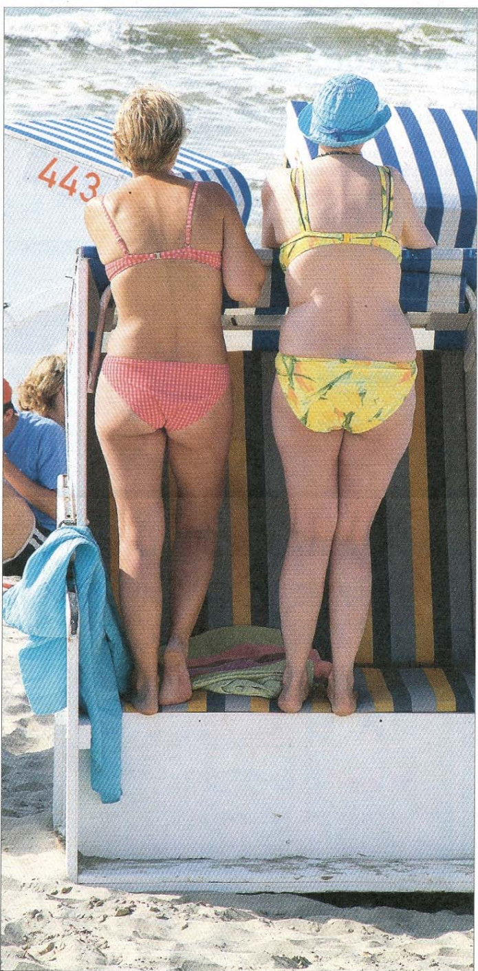
Schöne Aussichten aus dem Strandkorb

Bundeskanzlerin Angela Merkel hat zum G. 8-Gipfel in Heiligendamm in Mecklenburg-Vorpommern am 8. Juni 2007 einen achtsitzigen Strandkorb anfertigen lassen, indem sie sich zusammen mit den Regierungschefs der acht führenden Wirtschaftsnationen hat ablichten lassen – als Gruppenbild mit Dame. Dadurch hat sie dem Strandkorb zur weltweiten Bekanntheit verholfen. Bravo Angela!