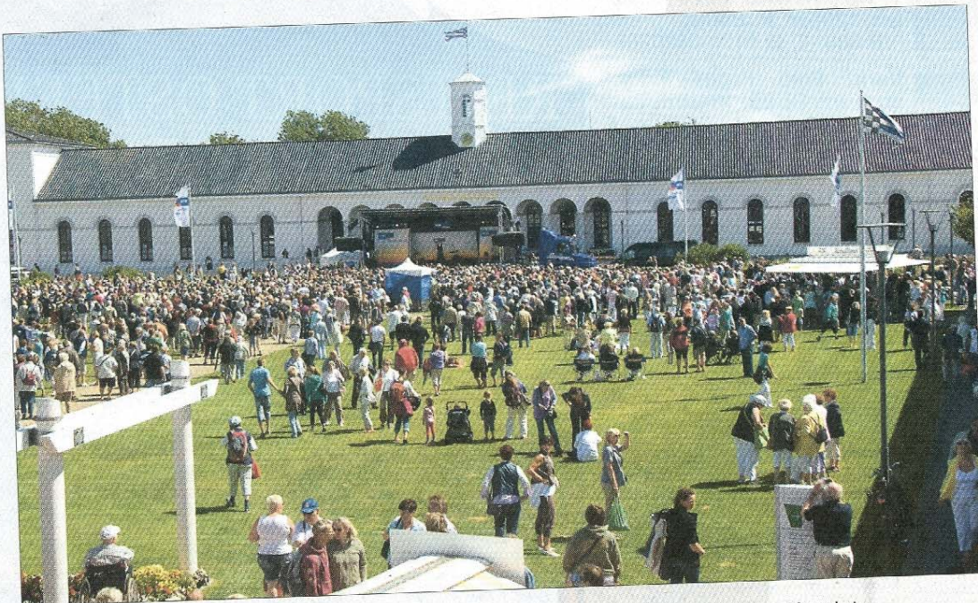
Als die Regengüsse aufhörten, strömten die vielen Menschen zurück auf den Kurplatz.