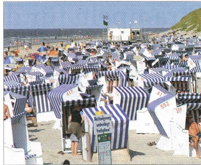
Der Nordstrand von heute: Die Strandkörbe sind einheitlich blau-weiß gestreift.