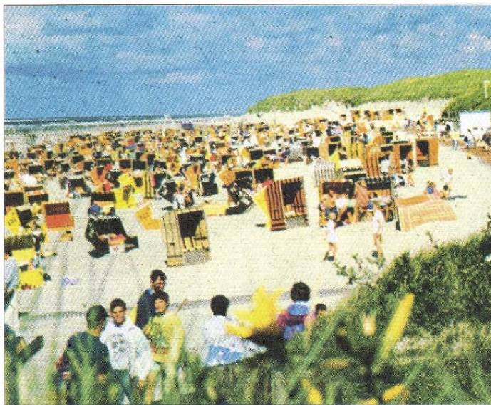
So sahen die Strandkörbe am Nordstrand in den 1970er-Jahren aus.