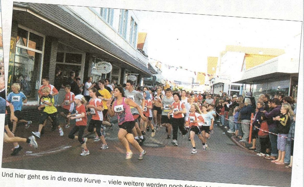
Und hier geht es in die erste Kurve - viele weitere werden noch folgen, bis die Ziellinie in Sicht ist.

und der WDR 4 Schlagerexpress auf dem Kurplatz.