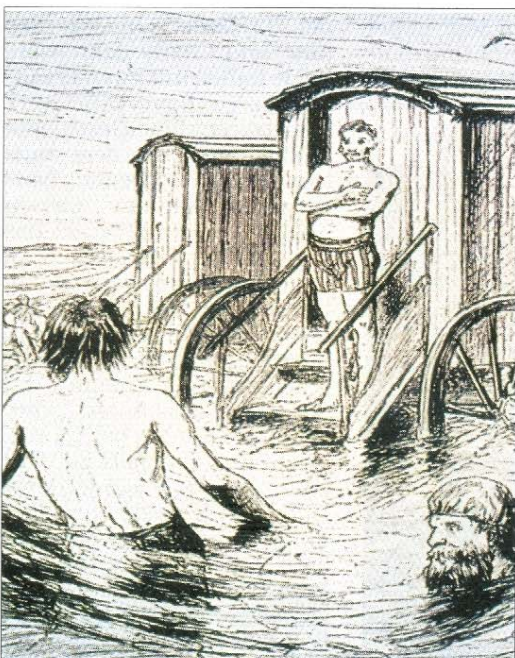
Das Badeleben von anno dazumal: Links baden die Herren, rechts haben sich die Umstände des Strandlebens denn doch ein wenig gelockert.

Offensichtlich nach dem Geschmack des Kurdirektors erhalten die Strandkörbe nunmehr einen einheitlichen blau-weiß gestreiften Markisenstoff, so dass ein Einheitslook an allen Strän-