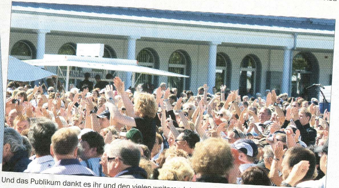
Und das Publikum dankt es ihr und den vielen weiteren Interpreten des WDR 4 Schlagerexpresses.