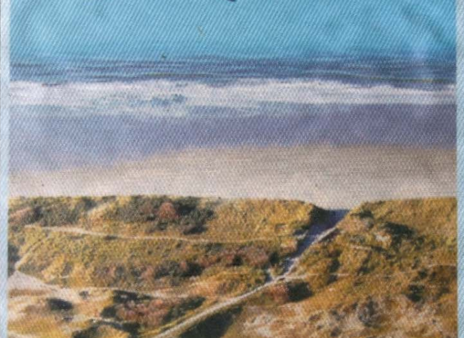
Der neue Flyer des Krankenhaus-Fördervereins, Herzstück der KURIER-Kampagne 1000 +.