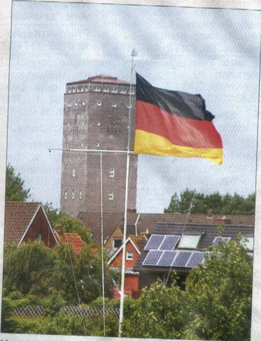
Hart im Wind: die Deutschland-Flagge vor dem Wasserturm.