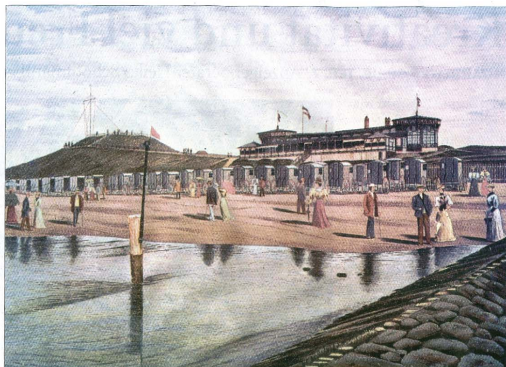
Baden in hoher Brandung heute (links) sowie am Strand vor dem Herrenbad nach der Badezeit von früher. Im Hintergrund die Giftbude und die Georgshöhe.