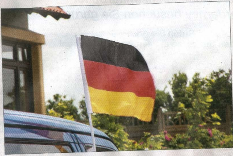
Stadtbildprägend: die Nationalflagge fürs Auto.