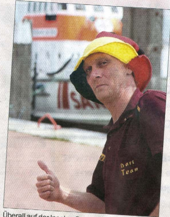
Überall auf der Insel zu finden, sogar vor dem Seenotrettungskreuzer – Farbe bekennende Fans.