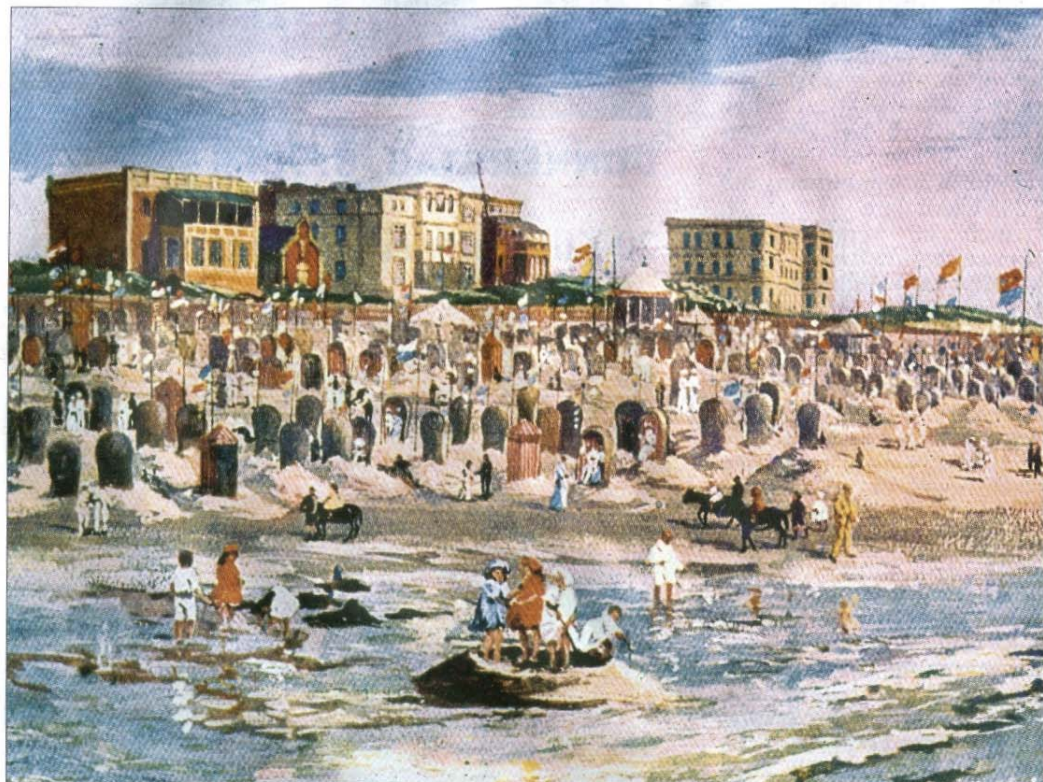
Am Weststrand 1912, nach der Badezeit, schon Familienbad. Der Single-Strandkorb hat in diesem Bereich den Karren schon abgelöst (links). Fröhliches Getümmel in den Wellen vor Norderney (rechts).