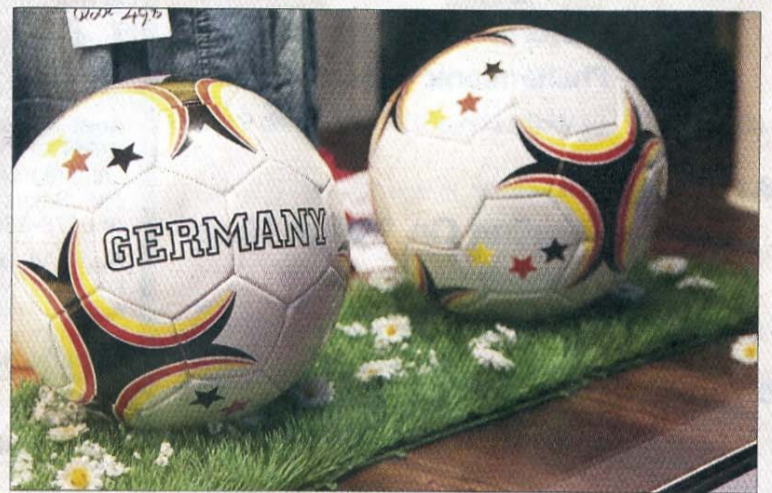
Originell: Gänseblümchen auf dem „heiligen Rasen“.