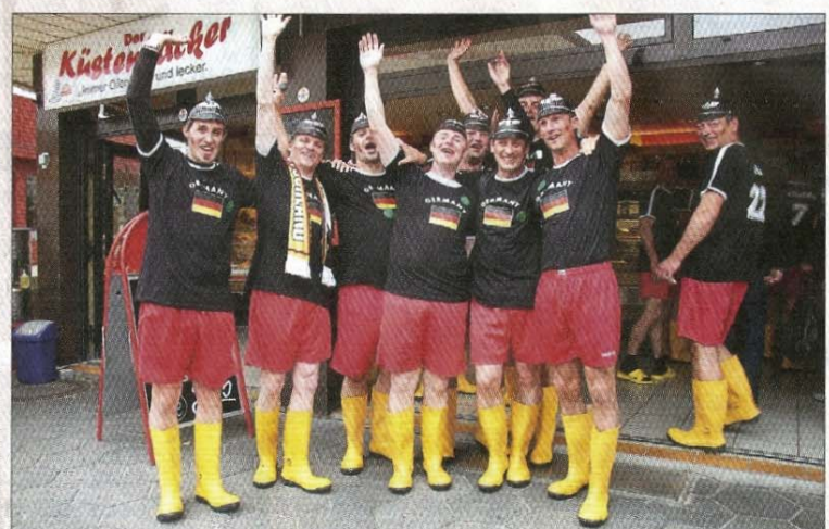
Ein Paar Gummistiefel zu wenig – der „Kapitän“ trägt Strandlatschen.