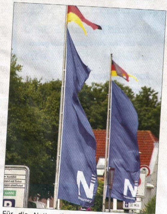
Für die Nationalfahne wird gern Platz gemacht.