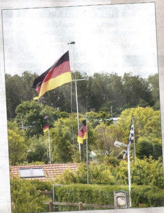
Nationalempfinden in den Schrebergärten.