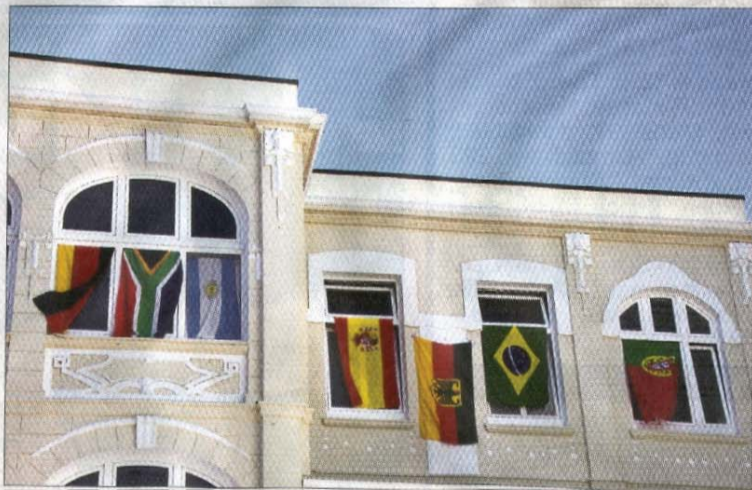
Hier fehlt noch die Flagge des zweiten Finalisten, die der Niederlande.