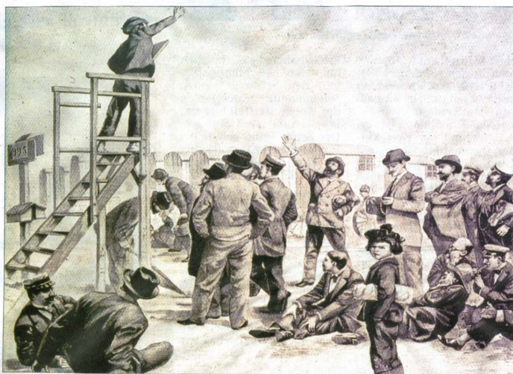
Ein Aufrufer dirigiert den Ablauf des Badelebens, der genau festgelegt war.

Fortsetzung: Ein Kurgast beschreibt in seinen Reisebriefen die Badeprozedur im Herrenbad. Der erste Teil ist in der letzten Ausgabe erschienen. Heute der zweite Abschnitt dieses Berichtes.